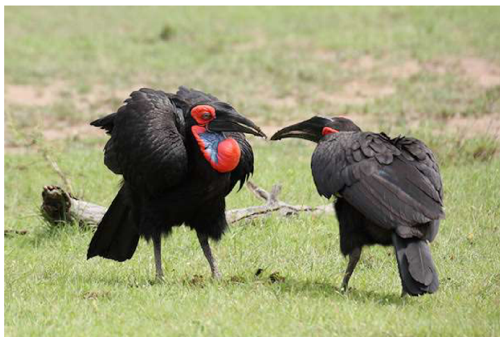
Obrázek 8: Zoborožec kaferský, Masai Mara, Keňa (Wildlife of Africa 2014)

Zabíjení zoborožců je v některých zemích, například v Keni zakázáno. Místní obyvatelé totiž věří, že zabití zoborožce přináší zkázu a smrt, protože má tento pták moc. Stejně tak je v Zimbabwe zakázáno honit nebo sbírat pírka zoborožce. Pírko by se podle místních mělo ignorovat a nechat ho odfouknout větrem. Porušení tohoto pravidla by mohlo osobě, nebo celé vesnici přinést neštěstí (Msimanga 2004).