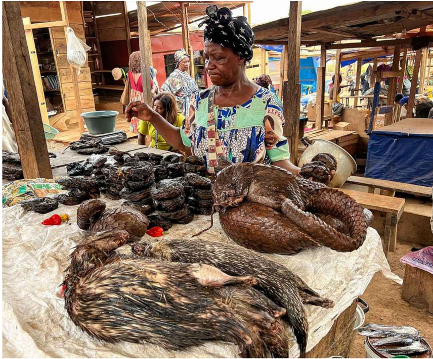
Obrázek 3: Luskouni na tržišti Nkoabang v kamerunském Yaoundé (Miroslav Bobek 2021)