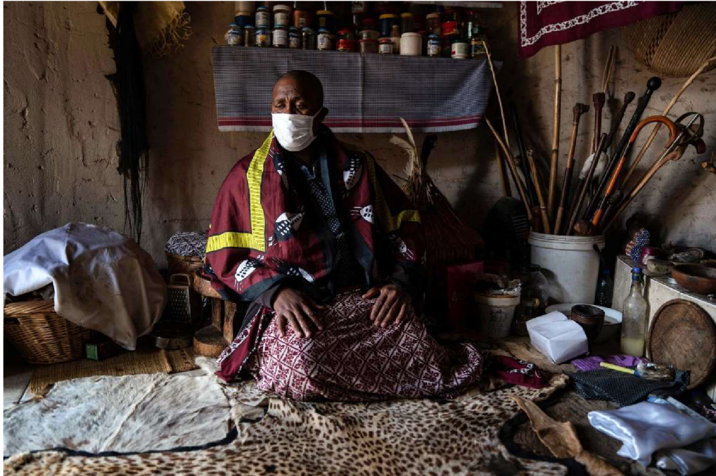
Obrázek 1: Tradiční léčitel, Jižní Afrika (James Oatway 2020)