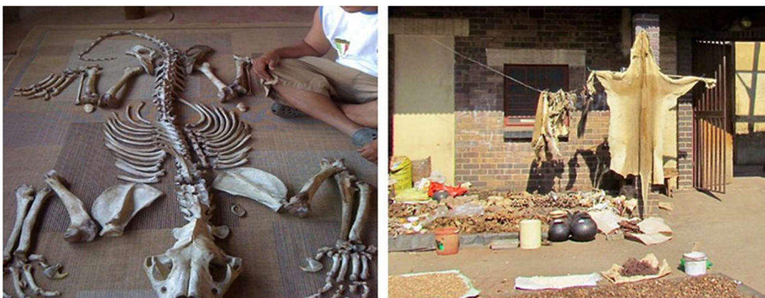
Obrázek 2: Produkty získávané ze lvů, Jižní Afrika (nalevo) a Kwa Mai Mai trh s TM, Johannesburg

zmiňovány jako léčebný prostředek lví struky. Mléko lvů je používáno pro nápoj nebojácnosti. Okrajově je využívána i krev lvů, pro moc ovládnout duchy a sliny, které se využívají při onemocnění spojené s ušima. U lvích žil a penisu se uvádí léčebný účinek při erektilních dysfunkcích a také využití pro ochranu od zlých duchů (TRAFFIC 2018).