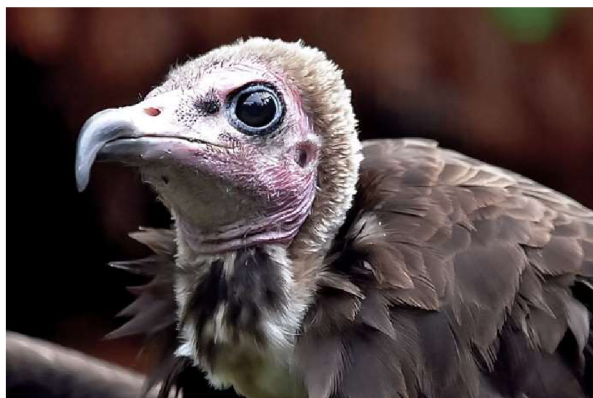
Obrázek 7: Sup kapucín Necrosyrtes monachus , nejmenší africký druh supa (ZOO Liberec 2020)

Nigérii. Zde cena za celého supa šplhá až na 64,8 USD. Cena hlavy se pohybuje okolo 19,2 USD a cena křídla je stejná, jako ve městě Katsina, tedy 8,4 USD (Muhammad & Mustapha 2020).