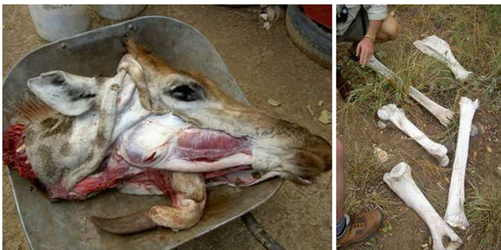
Obrázek 4: Hlava a kosti žirafy (Muller Zoe 2008)

V některých oblastech Afriky jsou žirafy bohužel významnou součástí místní víry a tradiční medicíny. V Tanzanii se věří, že žirafí mozek a kostní dřeň poskytují ochranu před AIDS a dokonce mohou vyléčit či dokonce oživit oběti nákazy HIV-AIDS (Arusha Times 2004). Právě tato léčebná víra je hnací silou pytláctví žiraf v Tanzanii a trvalá poptávka znamená, že ceny pytláckých žiraf zůstávají vysoké. Čerstvě uříznuté hlavy a žirafí kosti mohou dosáhnout ceny až 140 USD za kus, což z pytláctví žiraf činí vysoce lukrativní a výnosnou obchodní činnost (Muller Zoe 2008).