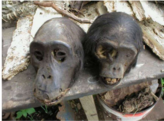
Obrázek 5: Lebky goril západních vystavené na trhu v Nigérii (Soewu 2013)