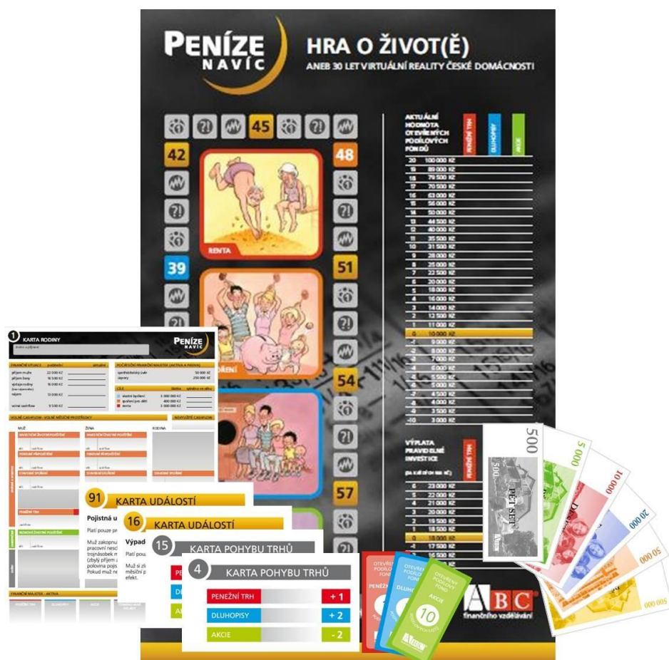
Obrázek 13: Hra Peníze navíc (ABC finanční vzdělávání, b.r.)

Po skončení celého projektu nastává hodina sebereflexe, reflexe a souhrn poznatků vhodných pro běžný budoucí život. Hodnotit můžou žáci i učitelé, a každý hodnotí projekt a cíle projektu ze svého úhlu pohledu.