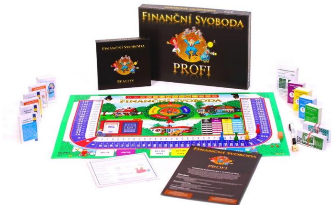
Obrázek 12: Desková hra Finanční svoboda (Finanční svoboda, b.r.)

pojištění trvalých následků úrazu - sjednání, zrušení, úmrtí a invalidita klienta; pojištění majetku – sjednání, zrušení).