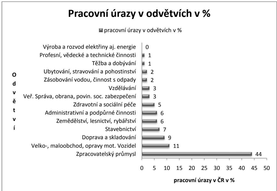
Graf 1: Podíl počtu pracovních úrazů s pracovní neschopností v jednotlivých odvětvích v roce 2014