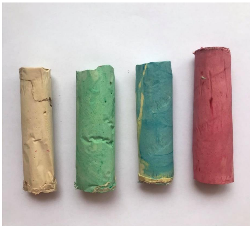
Obrázek 6: Křídý