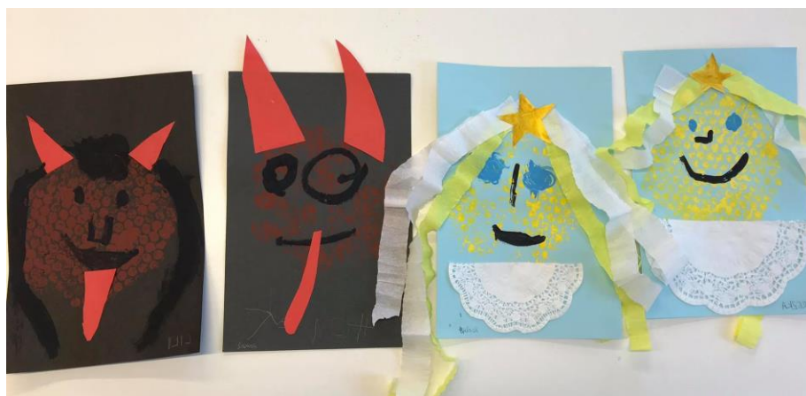
Obrázek 4: Mikuláš, čert a anděl