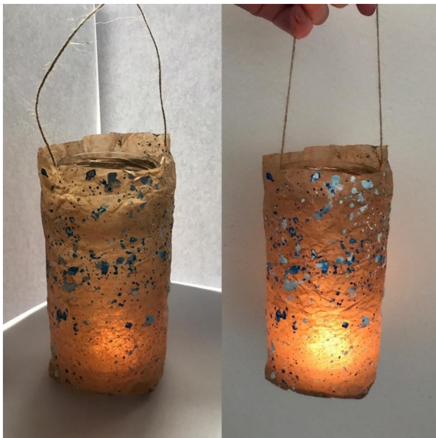
Obrázek 3: Zasněžený lampión