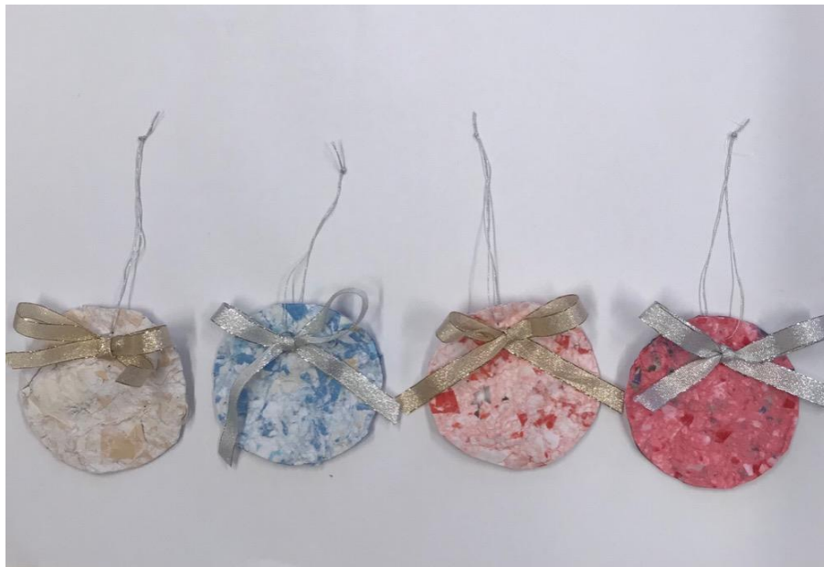
Obrázek 5: Ozdoby z mozaikového papíru