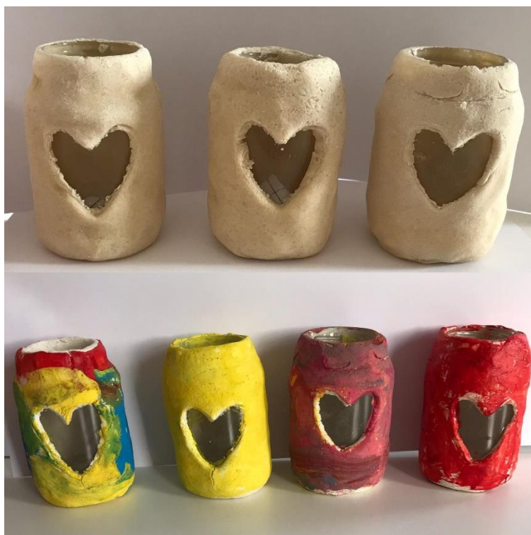
Obrázek 2: Svícný