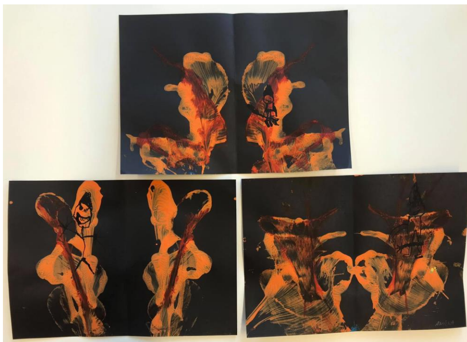
Obrázek 8: Oheň