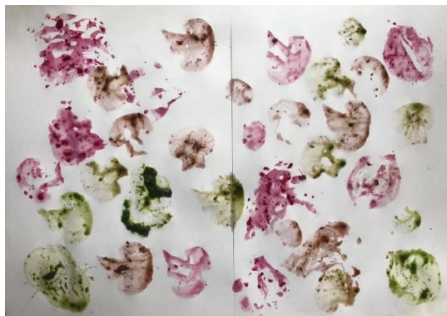
Obrázek 1: Otisky zeleniny