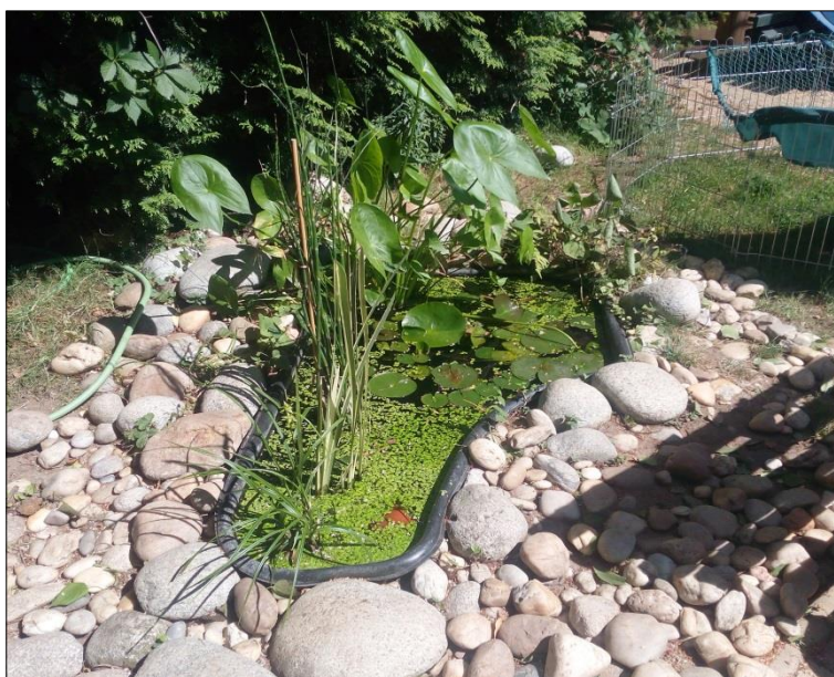
Obr. 31 Vodní prvek – jezírko s rostlinami