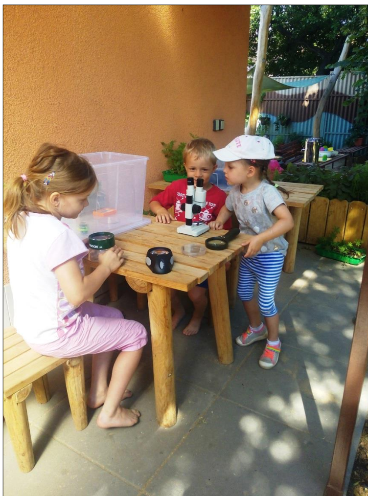
Obr. 32 Mini-laboratoř, dar od organizace Veronica