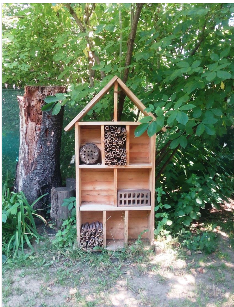
Obr. 34 Rozestavěný hmyzí hotel