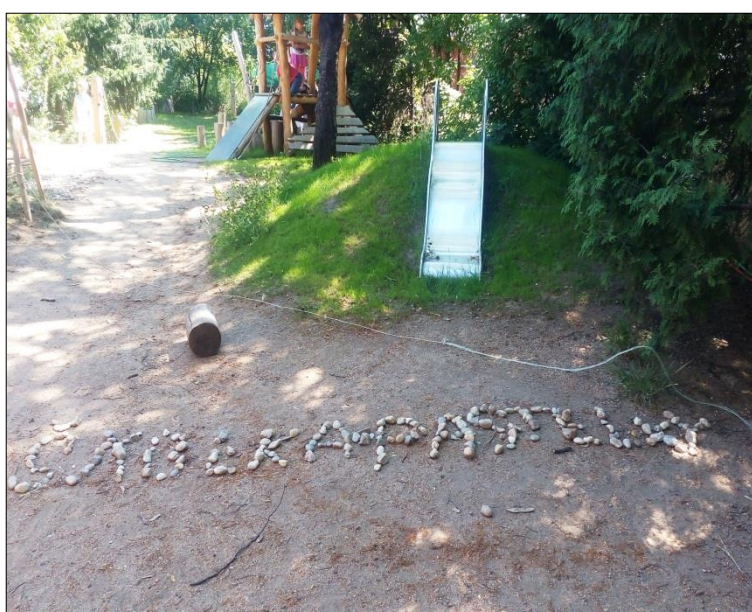
Obr. 33 Svahová skluzavka – využití terénu