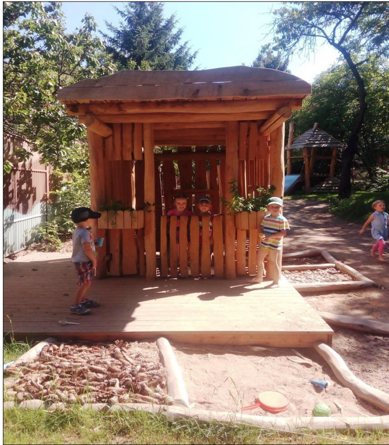
Obr. 36 Dřevěný altán s bylinkami a zelenou střechou