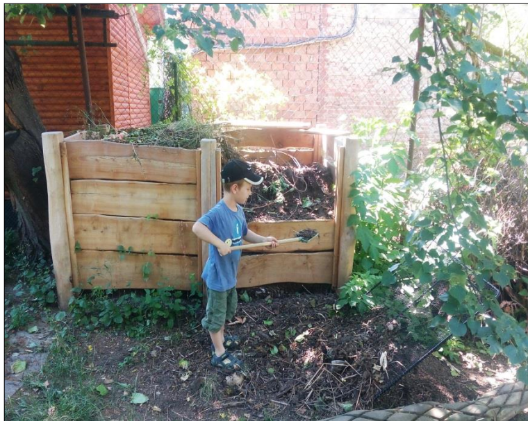
Obr. 37 Dřevěný kompostér