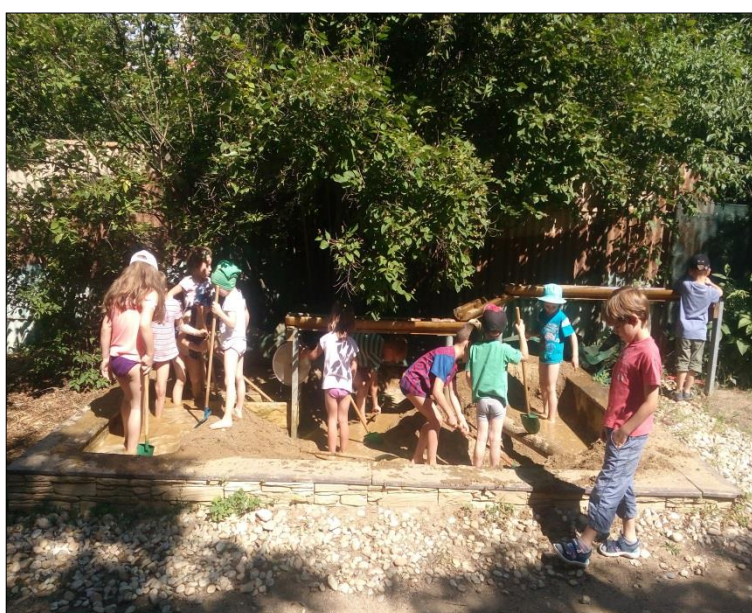
Obr. 35 Oblíbený herní prvek - blátoviště