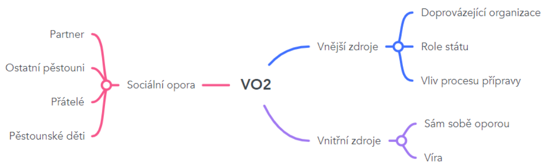
Obrázek 2: Myšlenková mapa VO2