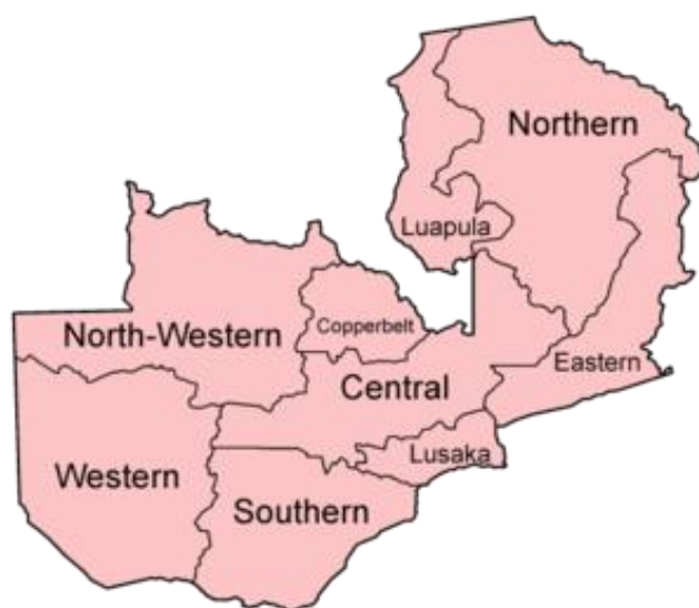
Obrázek č. 2: Mapa zambijských provincií

Pro kontext je ještě nutné uvést hlavní etnika v Zambii, kterými jsou Bemba, Nyanja, Tonga a Lozi. Mezi lety 1991-2001 měla MMD všeobecně podporu napříč etnickými skupinami, které vítaly návrat k vícestranickému systému. Velkou podporu měla MMD a prezident Chiluba také mezi etnikem Bemba, jehož příslušníci hovořili stejným jazykem jako prezident (Kim 2017: 25-27). Náležitost k etnickým či lingvistickým skupinám je v Zambii velmi komplikovaná a vzhledem k povaze práce není podstatné se jimi blíže zabývat. Pro lepší přehlednost je zde nicméně přiložena mapa provincií (obrázek č. 2) a mapa kmenů a lingvistických skupin v Zambii (obrázek č. 3). Následující část je zaměřena na specifickou roli, kterou sehráli náčelníci v rámci pokusu o získání třetího funkčního období.