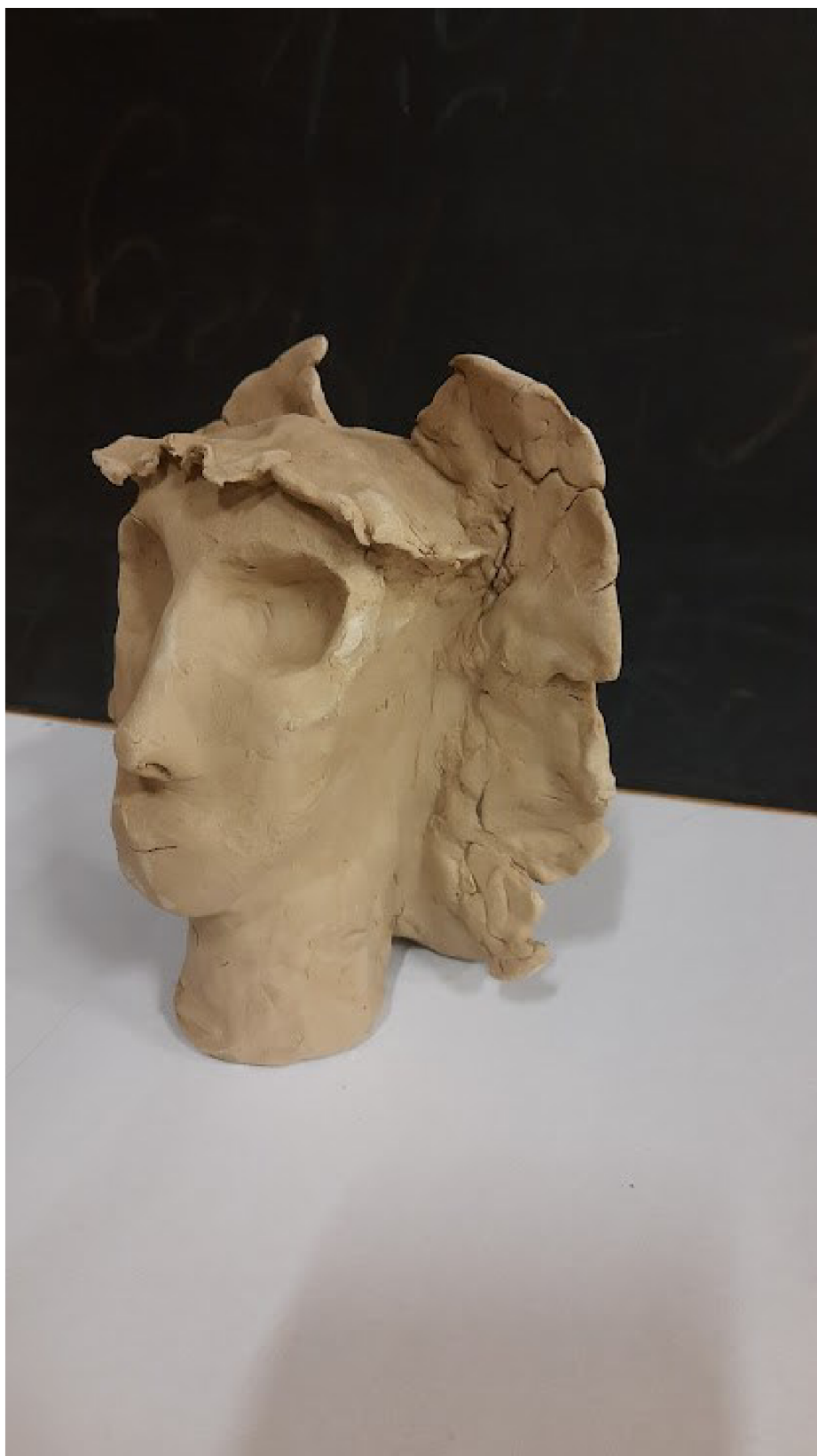
Příloha č. 5 – Amazonka – klientka B.