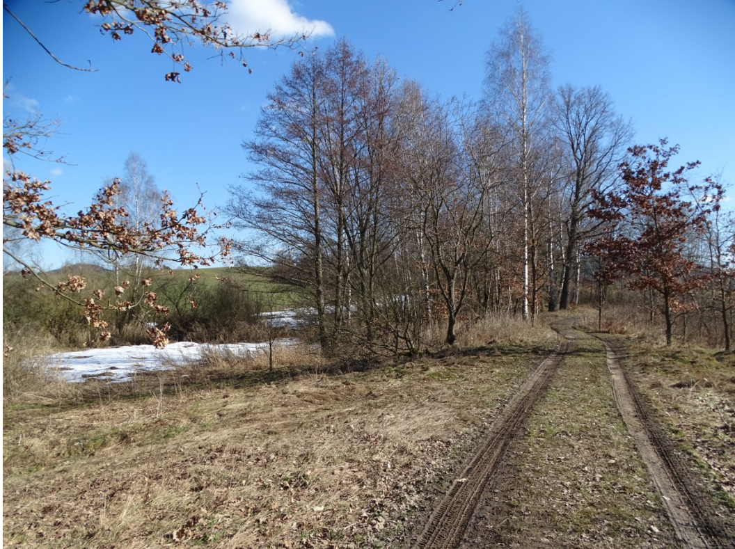
Obrázek 15: Zaniklá vodní plocha č. 27 - Cesta po hrázi, vlevo lokalita rybníka, pohled od západu.