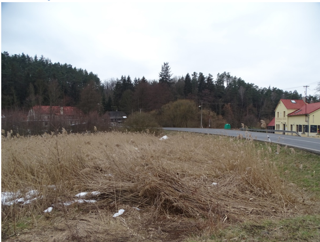
Obrázek 17: Zaniklá vodní plocha pod hradem, pohled ze severu.