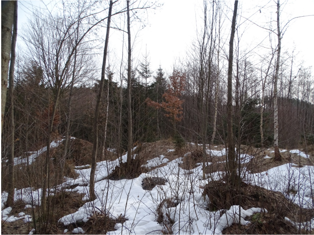
Obrázek 4: Zaniklá vodní plocha č. 2 - Hráz, pohled ze západu.