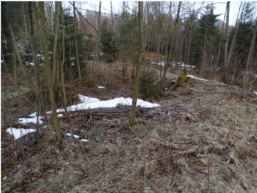
Obrázek 5: Zaniklá vodní plocha č. 3 - Hráz, pohled z jihozápadu.