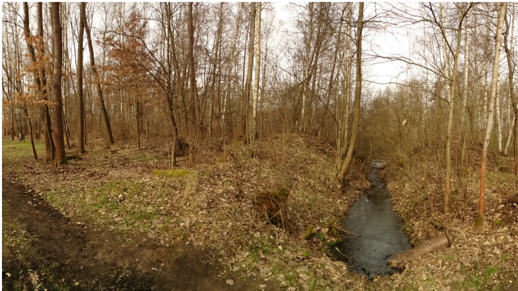
Obrázek 13: Zaniklá vodní plocha č. 10 - Hráz, pohled z jihovýchodu.