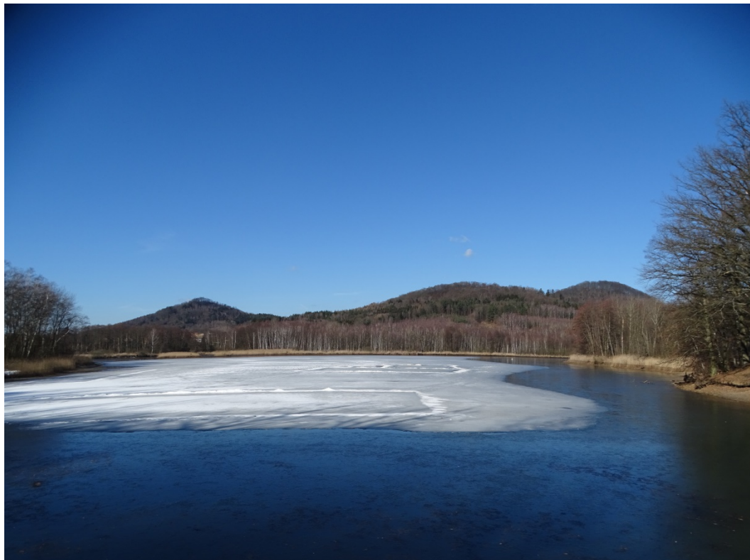
Obrázek 16: Vodní plocha č. 26 - Červený rybník, pohled z jihovýchodu.