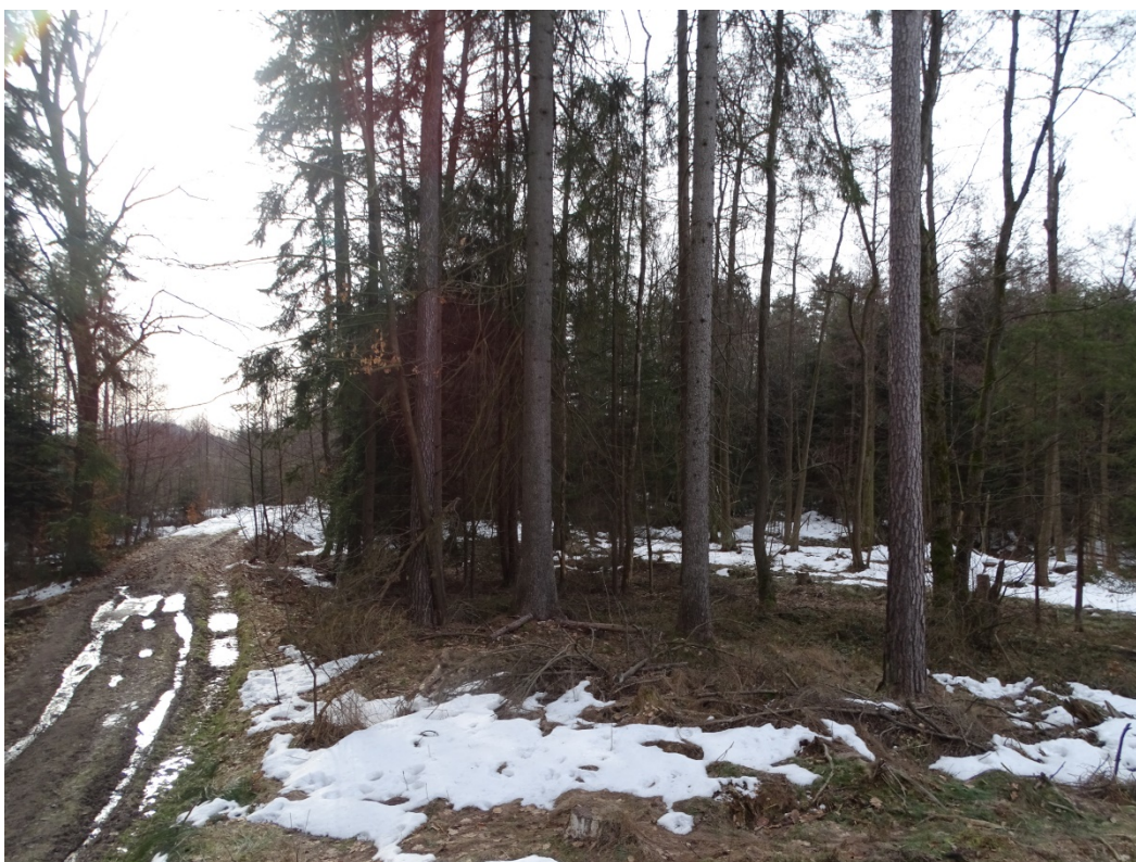
Obrázek 2: Zaniklá vodní plocha č. 1 - Lokalita zaniklého rybníka (vpravo do cesty), pohled od severu.