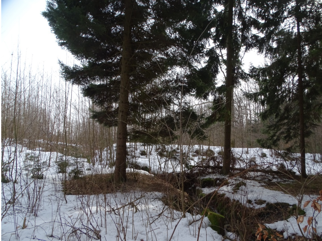
Obrázek 12: Zaniklá vodní plocha č. 8 - Hráz, pohled ze severu.