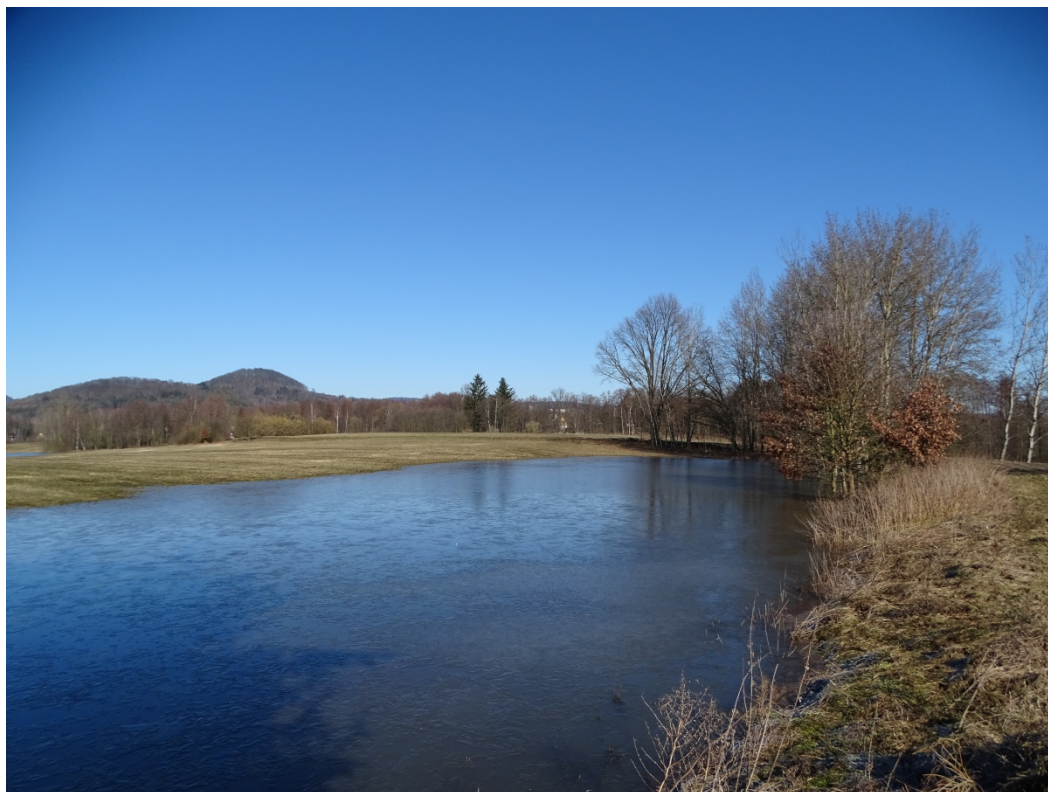
Obrázek 15: Zaniklá vodní plocha č. 19 - Lokalita rybníka na jaře s vodou, pohled z jihozápadu.