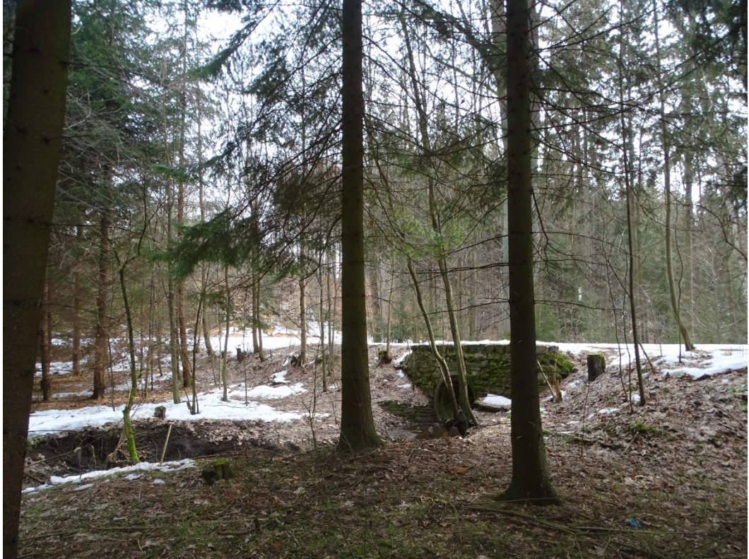
Obrázek 9: Zaniklá vodní plocha č. 5 - Hráz s propustkem, pohled ze západu.