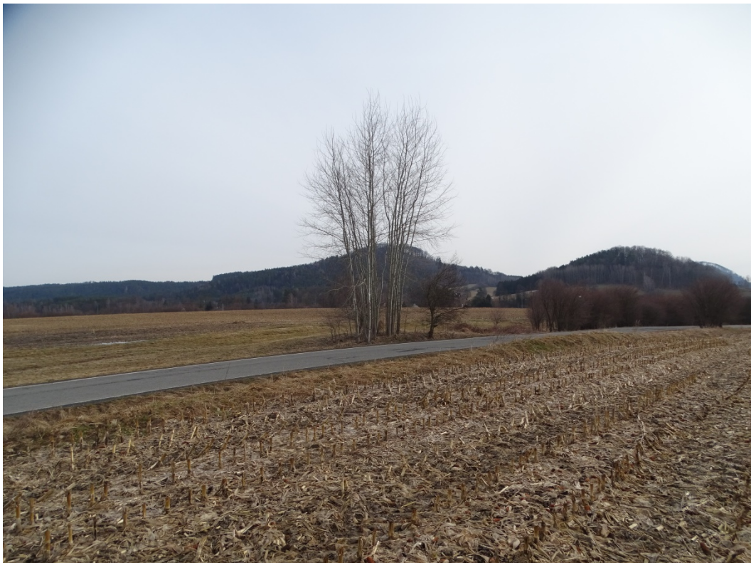
Obrázek 7: Zaniklá vodní plocha č. 4 - Místo bývalé hráze, pohled ze západu.