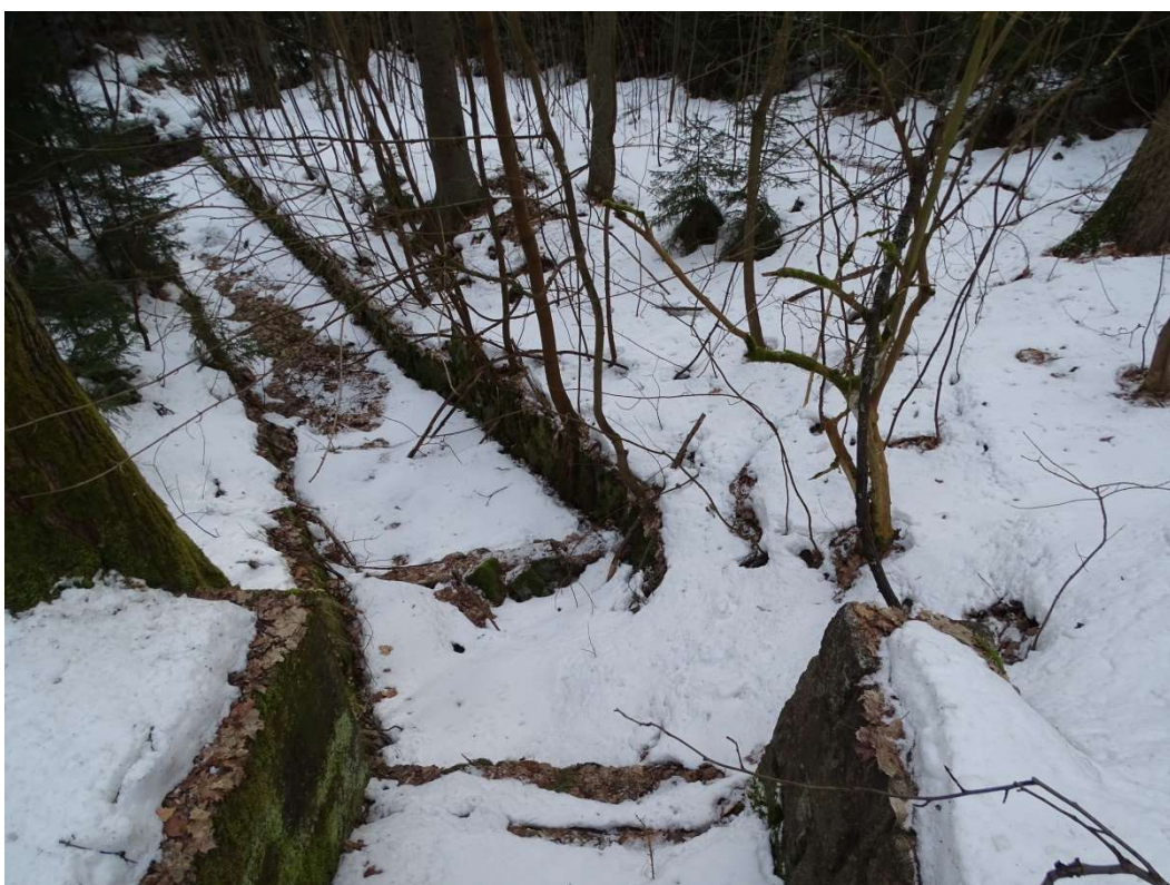
Obrázek 11: Zaniklá vodní plocha č. 7 - Bezpečnostní přeliv, pohled ze severu z hráze.