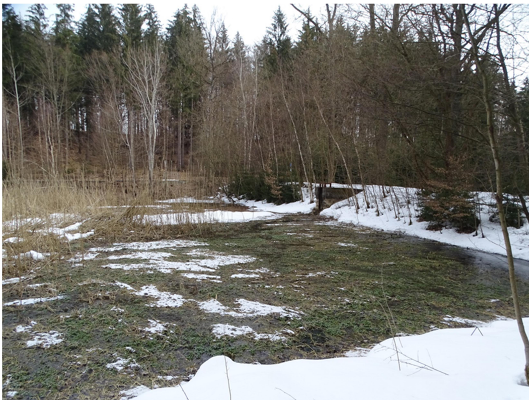
Obrázek 10: Zaniklá vodní plocha č. 7- Hráz, pohled z jihozápadu.