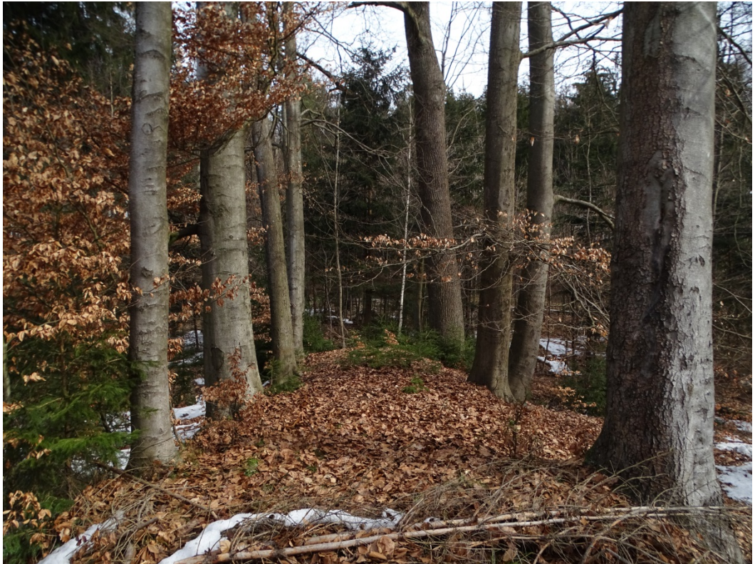
Obrázek 8: Zaniklá vodní plocha č. 6 - Hráz se vzrostlými buky, pohled z jihozápadu.