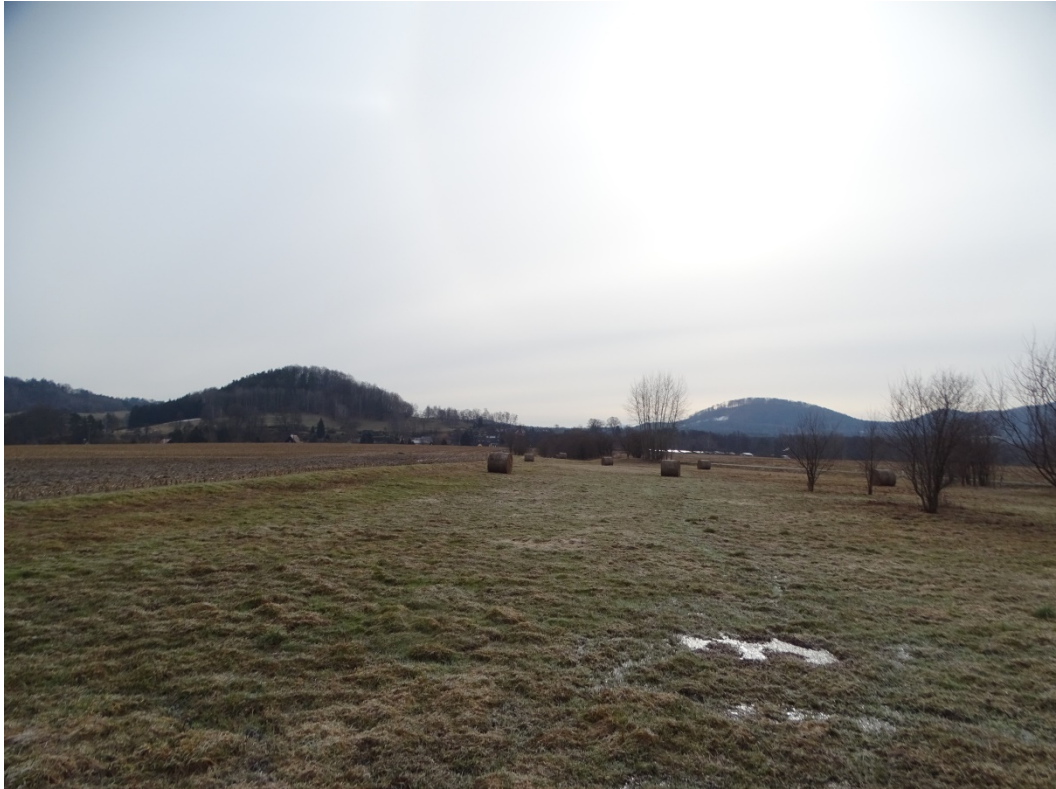
Obrázek 6: Zaniklá vodní plocha č. 4 - Lokalita, pohled ze severozápadu.