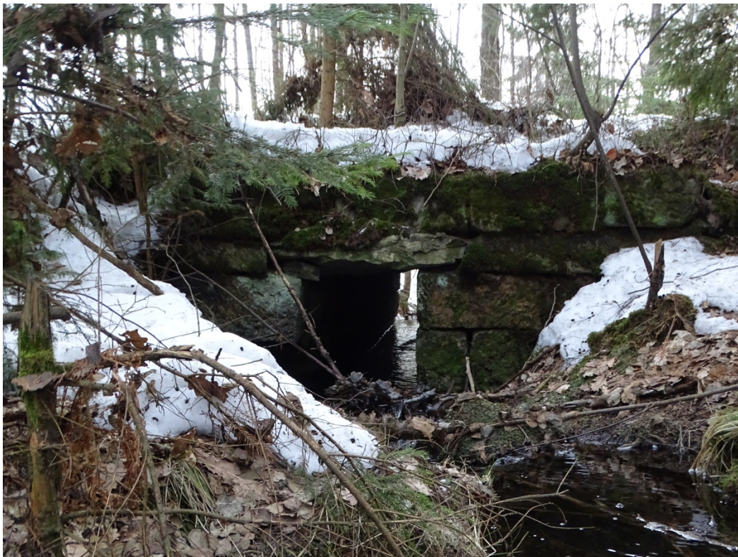
Obrázek 3: Zaniklá vodní plocha č. 1 - Kamenný propustek v místě hráze, pohled od severu.