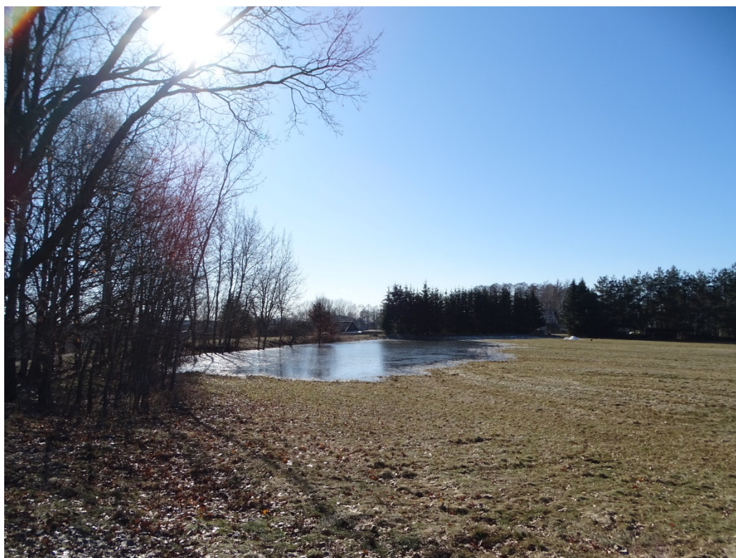
Obrázek 14: Zaniklá vodní plocha č. 19 - Lokalita rybníka, pohled ze severu.