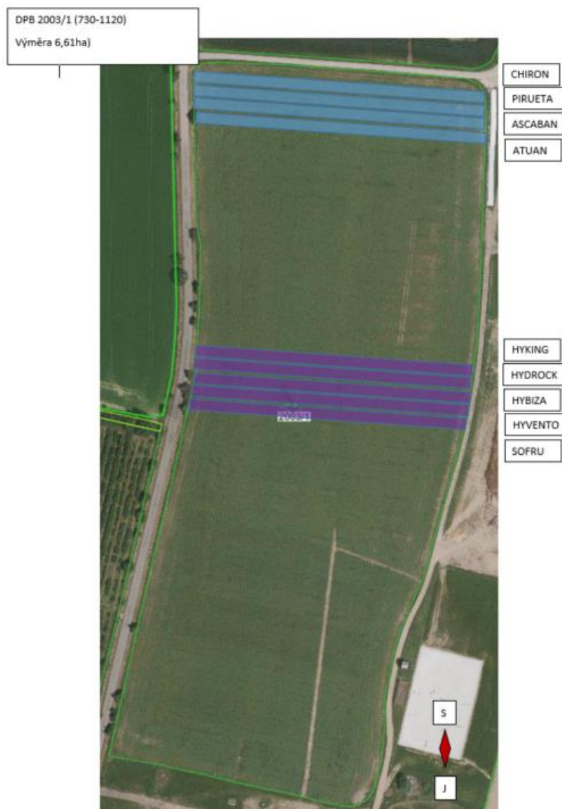
Obrázek 1 Plánek osetí pozemku