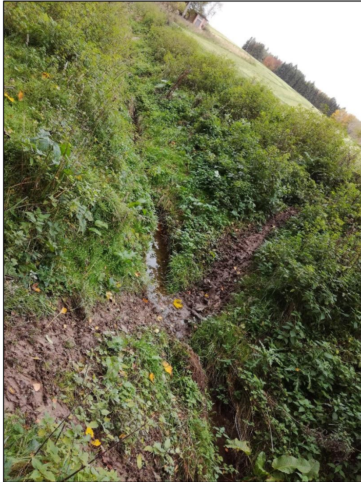
Příloha číslo 3 – Vyústění melioračního příkopu do Brejlského potoka