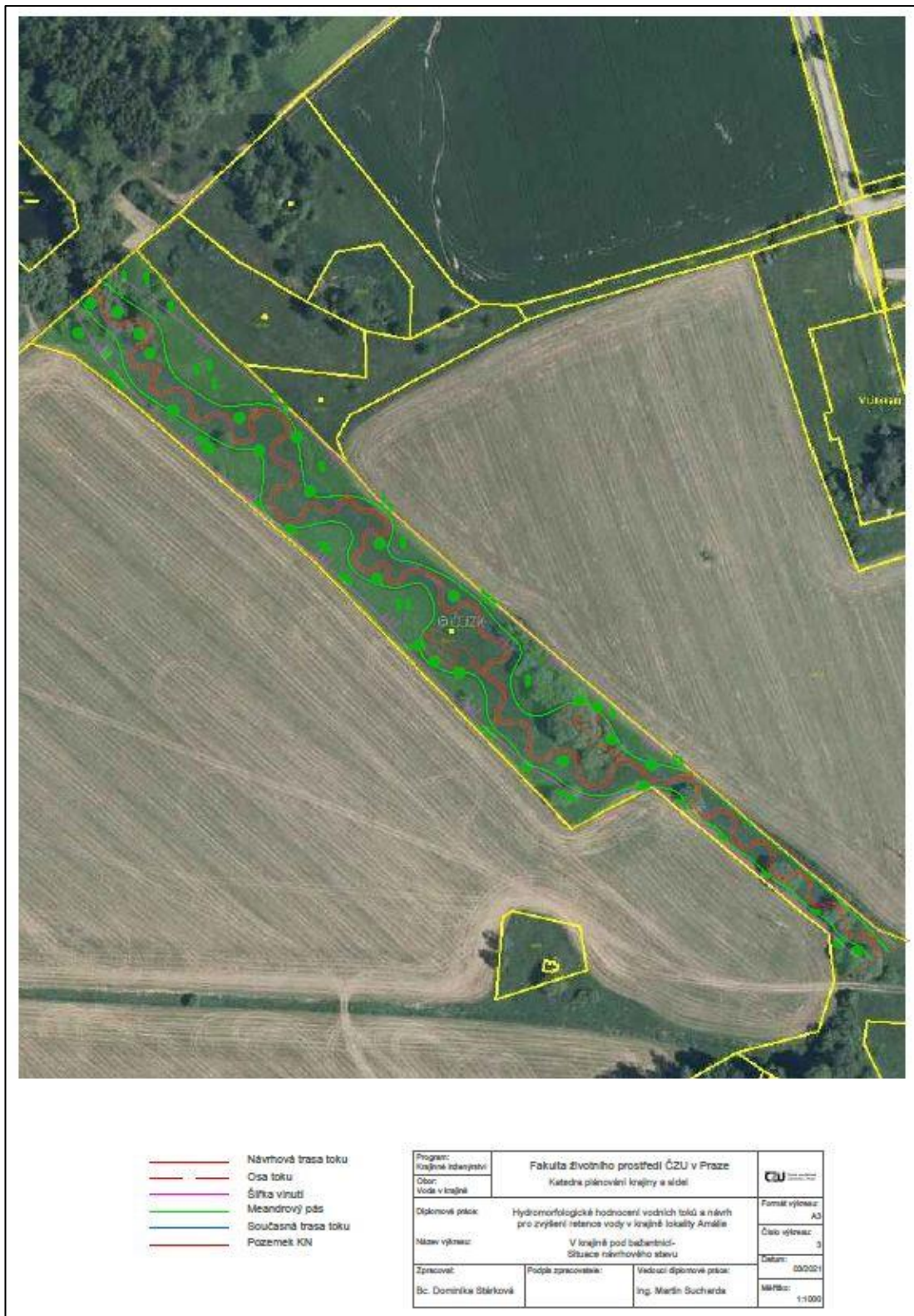
Příloha číslo 1 – Návrh retence vody na pozemku pod bažantnicí ortofoto