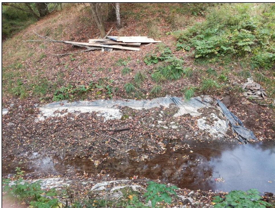
Příloha číslo 4 – Úprava na úseku číslo 8 Brejlského potoka