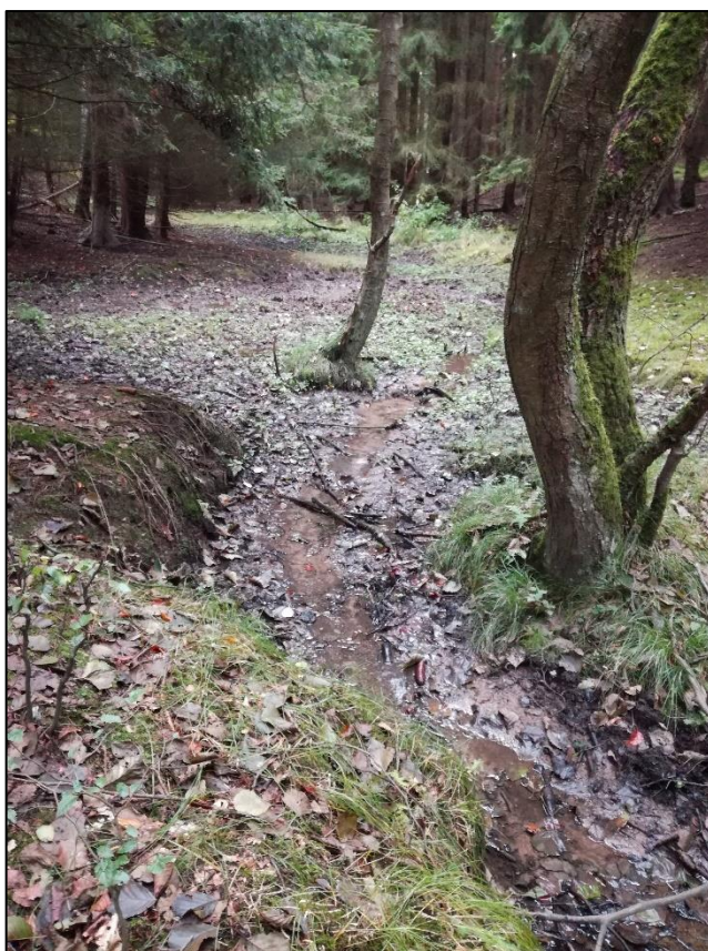
Příloha číslo 5 – soutok 1. a 2. větve Karlova luhu