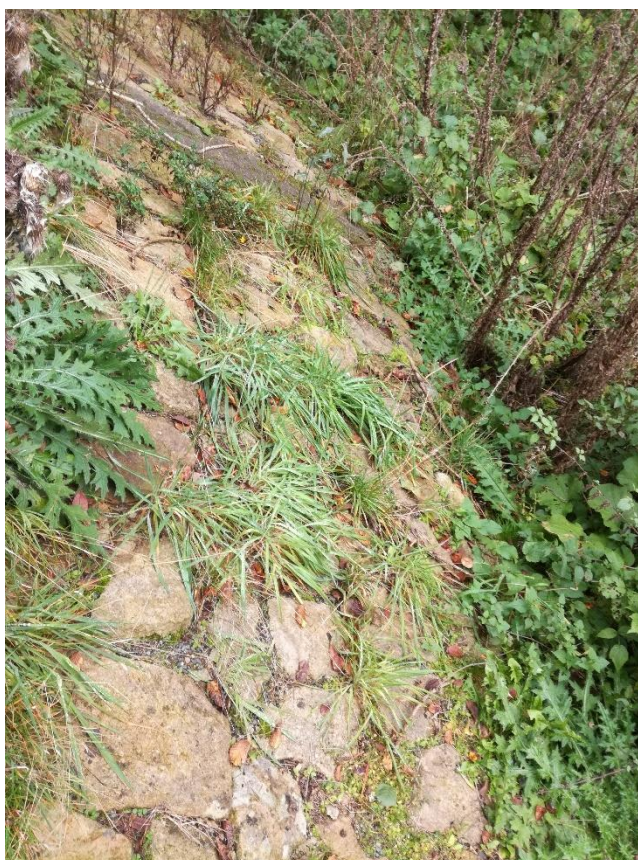
Příloha číslo 6 – Zpevnění koryta v úseku číslo 7 Karlova luhu