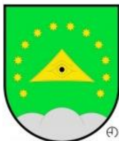
Obrázek č. 1: Znak obce