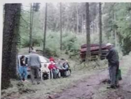
výlet do přírody