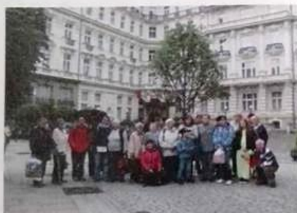
výlet do Karlových Varů