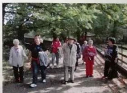
návštěva chomutovského zooarku