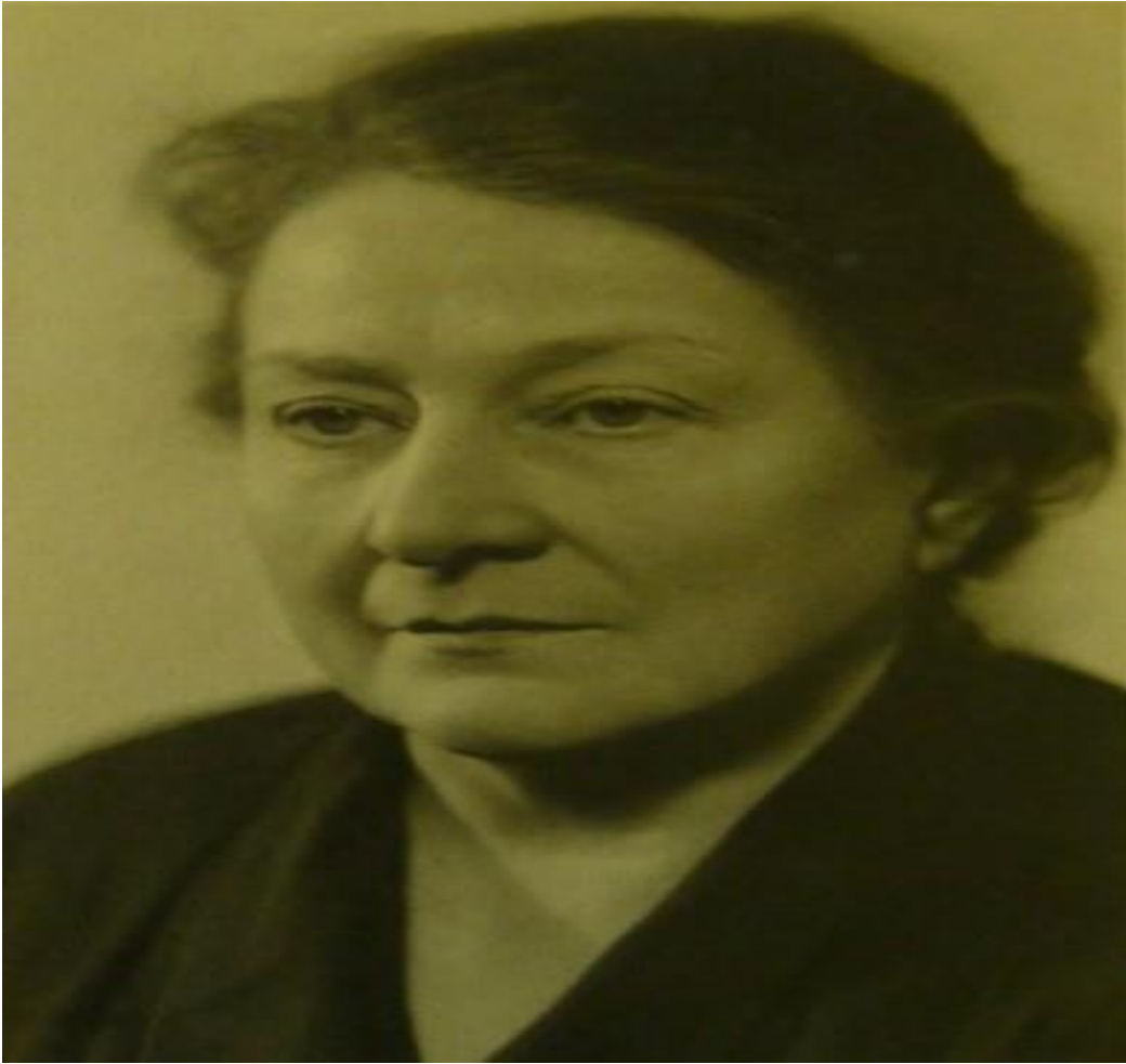
Příloha 1: Senátorka Františka Ferdinanda Plamínková