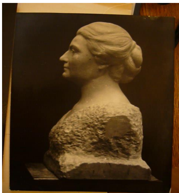
Příloha 9.: Busta Františky Plamínkové