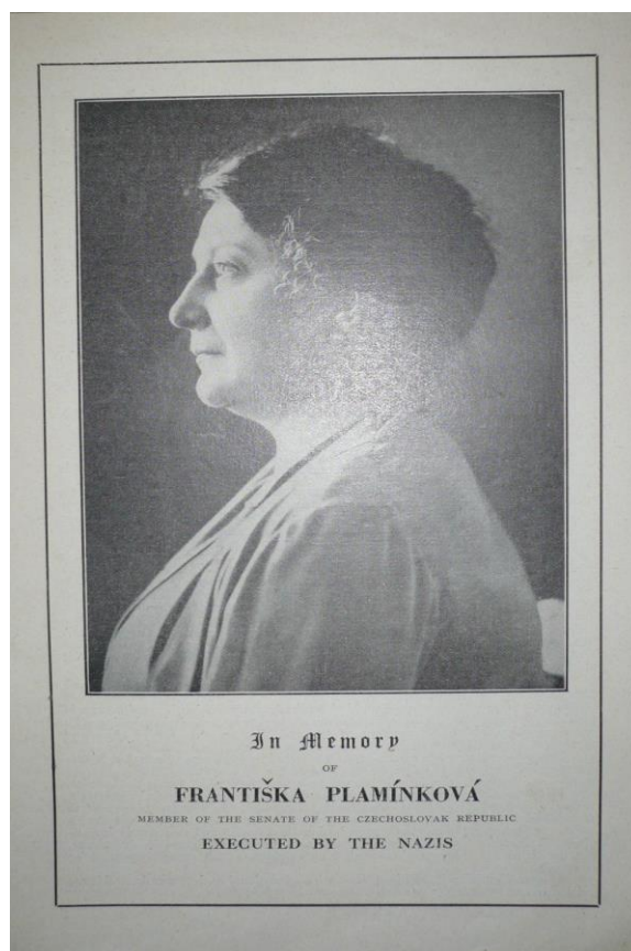
Příloha 8.: Vzpomínka na Františku Plamínkovou z Velké Británie