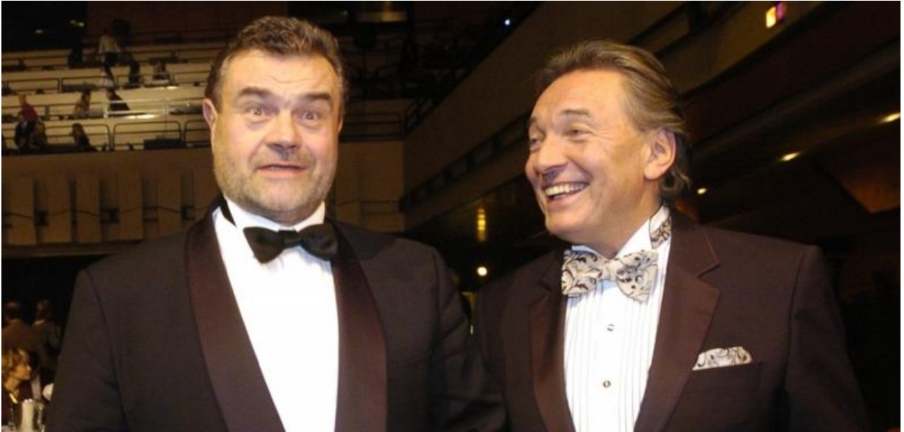
Příloha č. 2: Karel Svoboda s Karlem Gottem