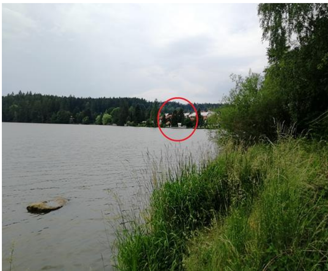
Příloha č. 9: Fotografie domu Karla Svobody v Jevanech