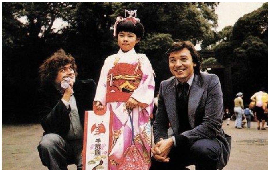
Příloha č. 3: Rok 1977, festival Yamaha v Tokiu, Karel Gott vzpomíná: S Karlem Svobodou