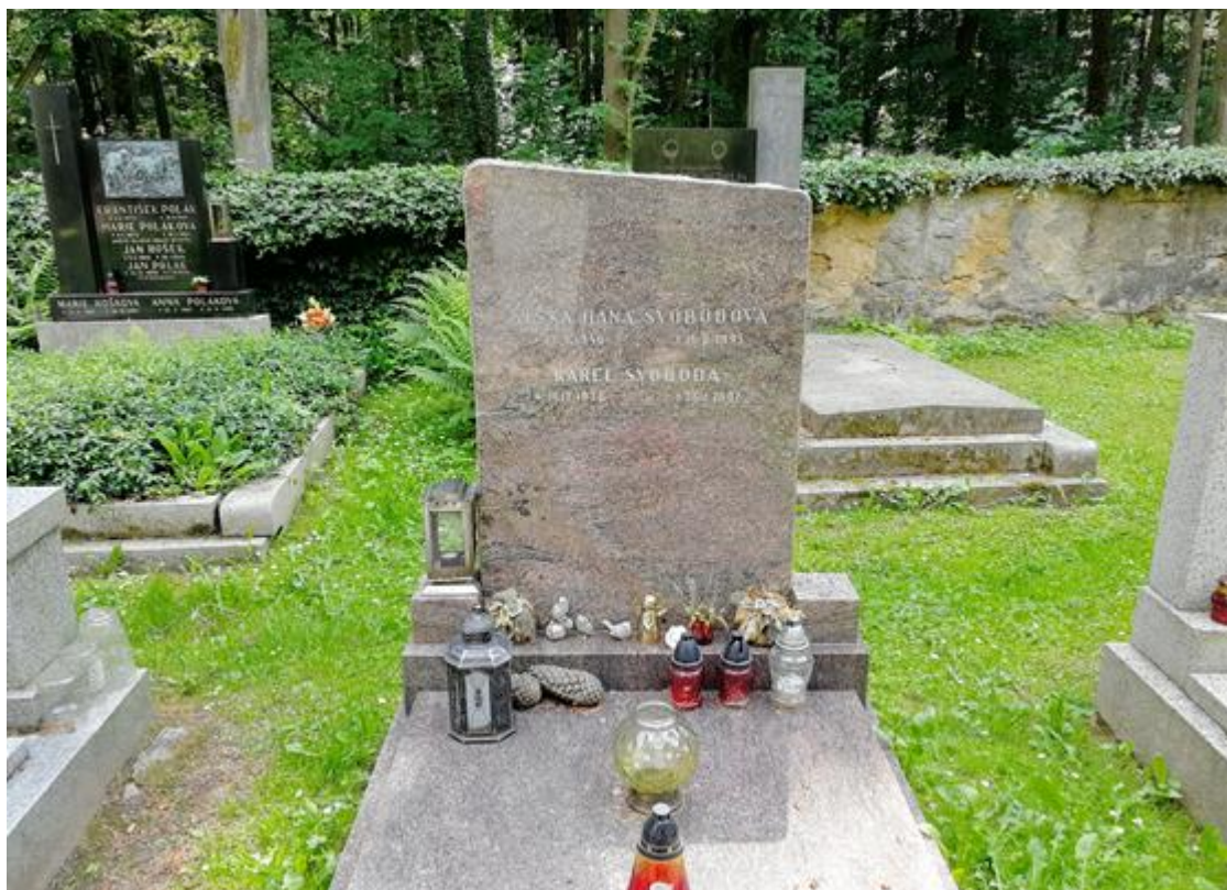
Příloha č. 8: Fotografie hrobu Karla Svobody