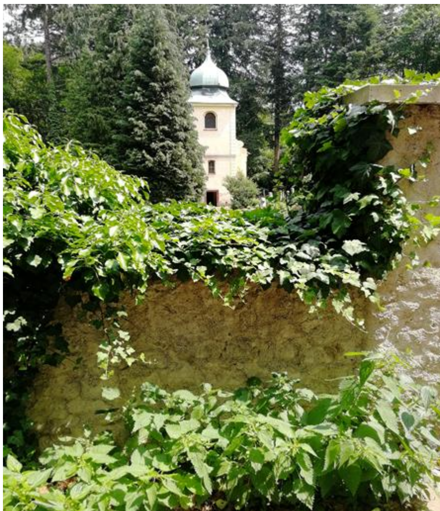
Příloha č. 6: Fotografie kostela na hřbitově na Aldašíně