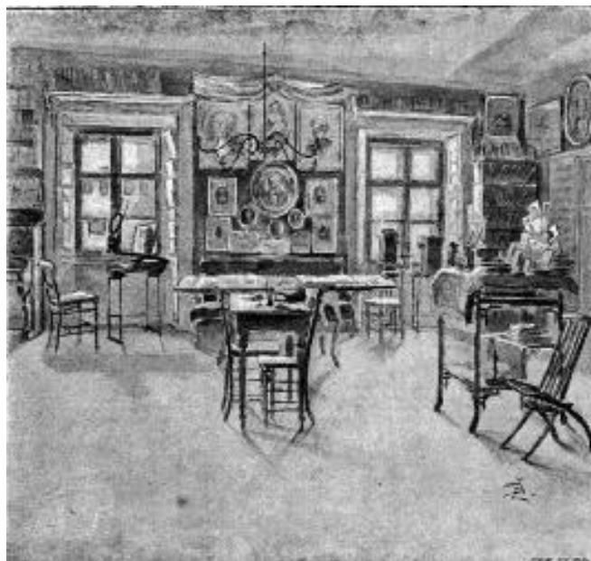
Obr. 5: Čítárna Amerického klubu dam na kresbě Zdeňka Braunerova.