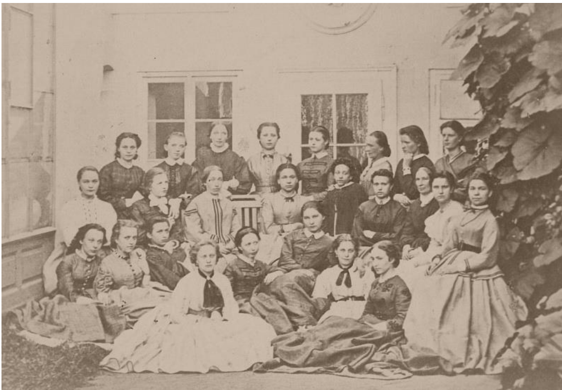
Obr. 4: Část členek Amerického klubu dam v roce 1871.