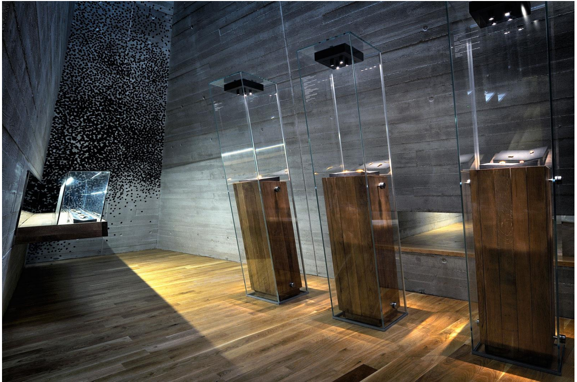
Obr.4 Archeologický park Pavlov – výstava [23]