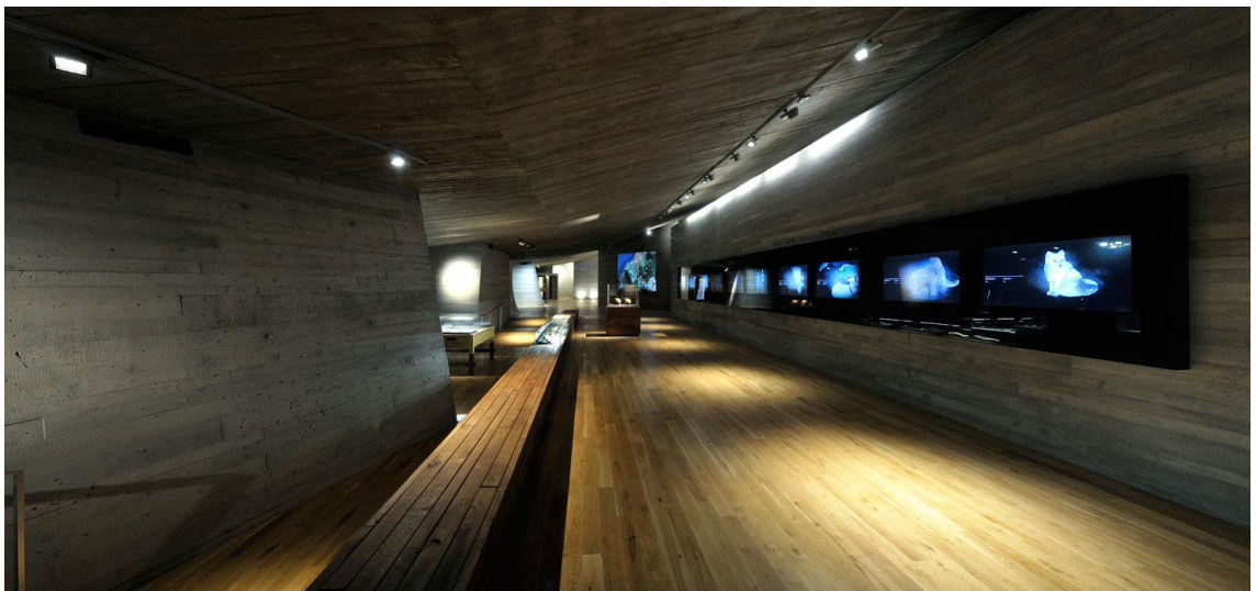
Obr.5 Archeologický park Pavlov – vnitřní prostory [23]