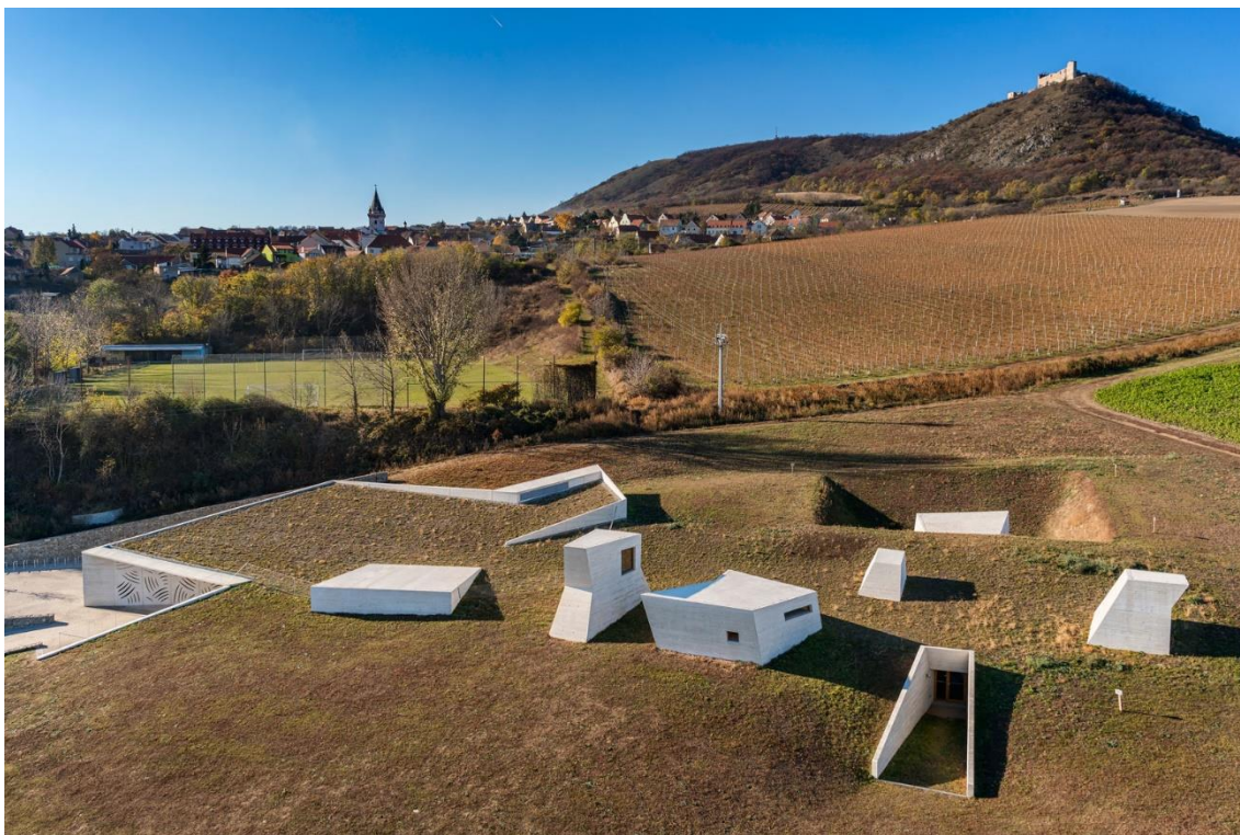
Obr.2 Archeologický park Pavlov – venkovní pohled [23]