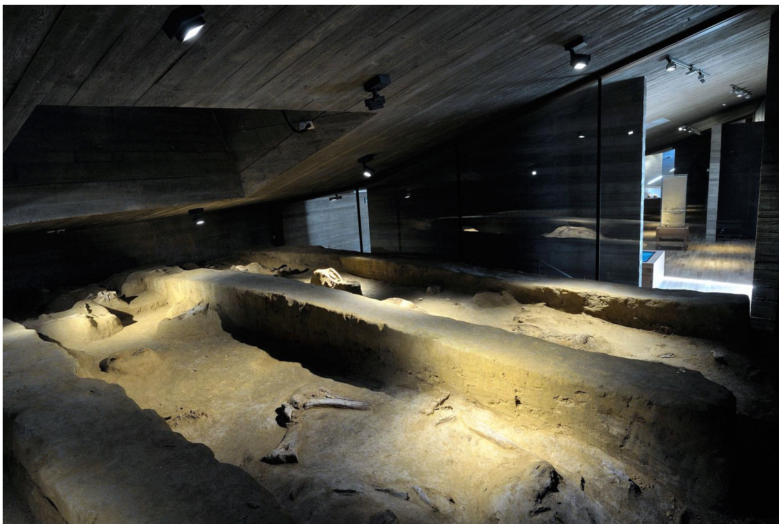
Obr.3 Archeologický park Pavlov – otevřený archeologický výkop [23]