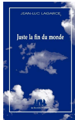
Image 7, la couverture typique pour la maison d'édition Les Solitaires Intempestifs