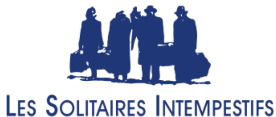
Image 6, logo de la maison d'édition Les Solitaires Intempestifs

Le logo de l'entreprise représente quatre personnes avec des valises. Il n'a donc rien à voir avec les livres, mais il a probablement été choisi en raison des raisons internes.