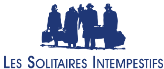
Image 6, logo de la maison d'édition Les Solitaires Intempestifs

Le logo de l'entreprise représente quatre personnes avec des valises. Il n'a donc rien à voir avec les livres, mais il a probablement été choisi en raison des raisons internes.