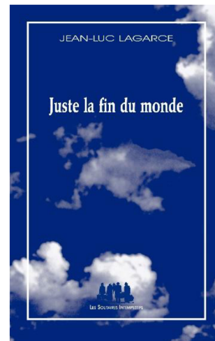
Image 7, la couverture typique pour la maison d'édition Les Solitaires Intempestifs