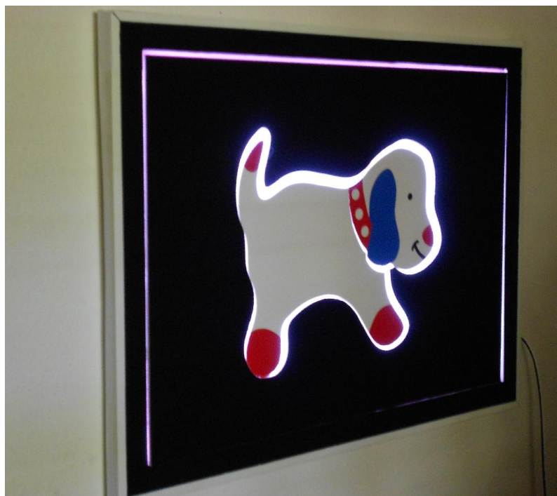
Magnetický světelný panel - pes