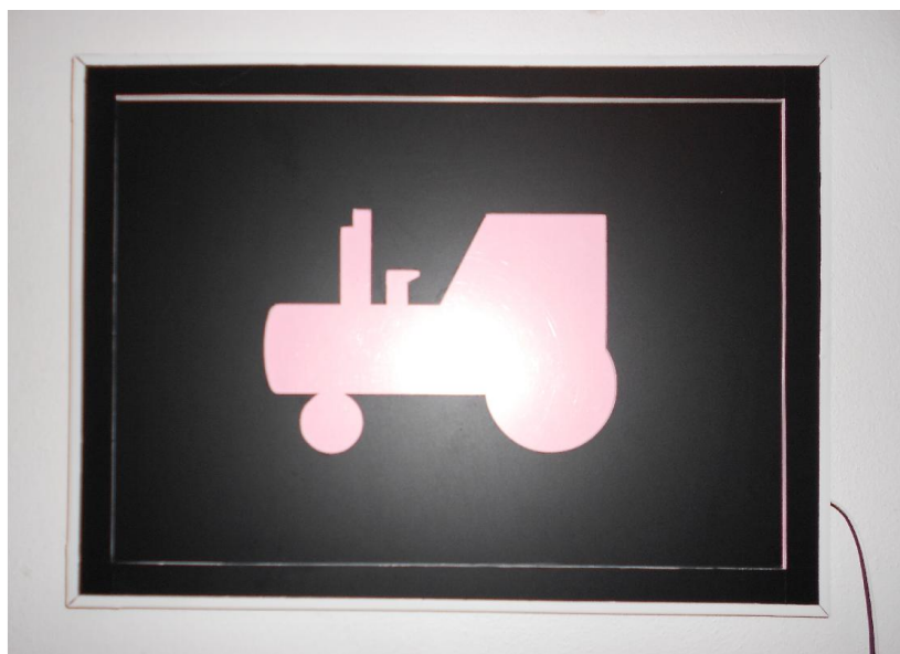
Magnetický světelný panel - traktor