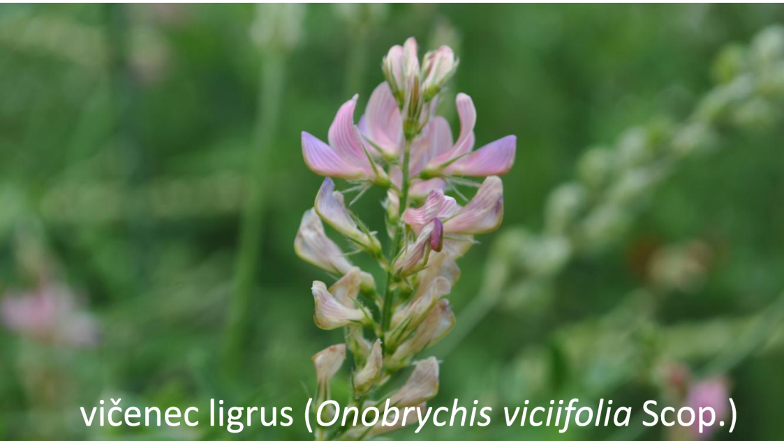
vičenec ligrus ( Onobrychis viciifolia Scop.)