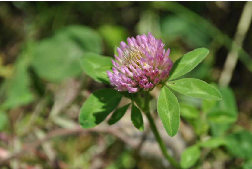
Jetel švédský ( Trifolium hybridum )