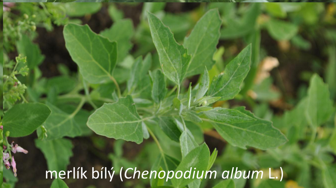
merlík bílý ( Chenopodium album L.)