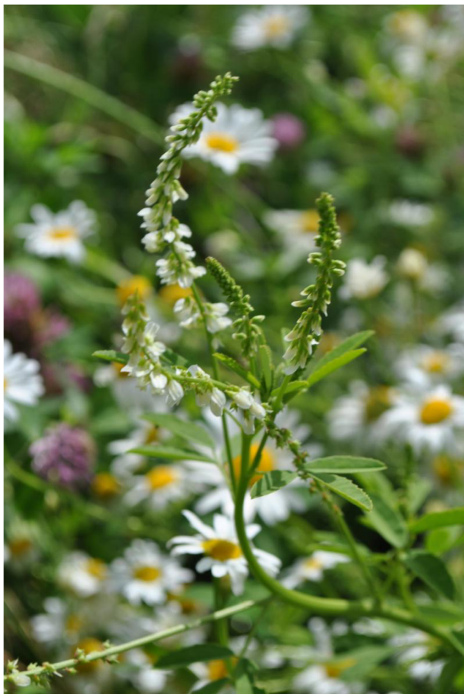
Komonice bílá ( Melilotus albus )