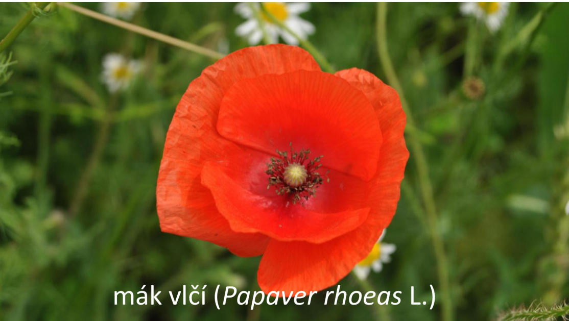
mák vlčí ( Papaver rhoeas L.)