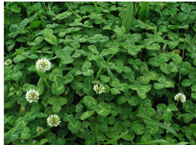
Jetel plazivý ( Trifolium repens )