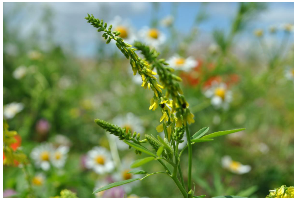
Komonice lékařská ( Melilotus officinalis )