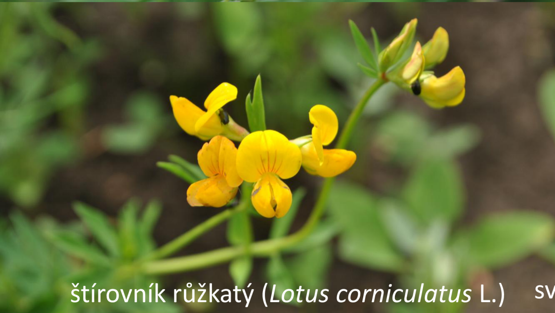
štírovník růžkatý ( Lotus corniculatus L.)