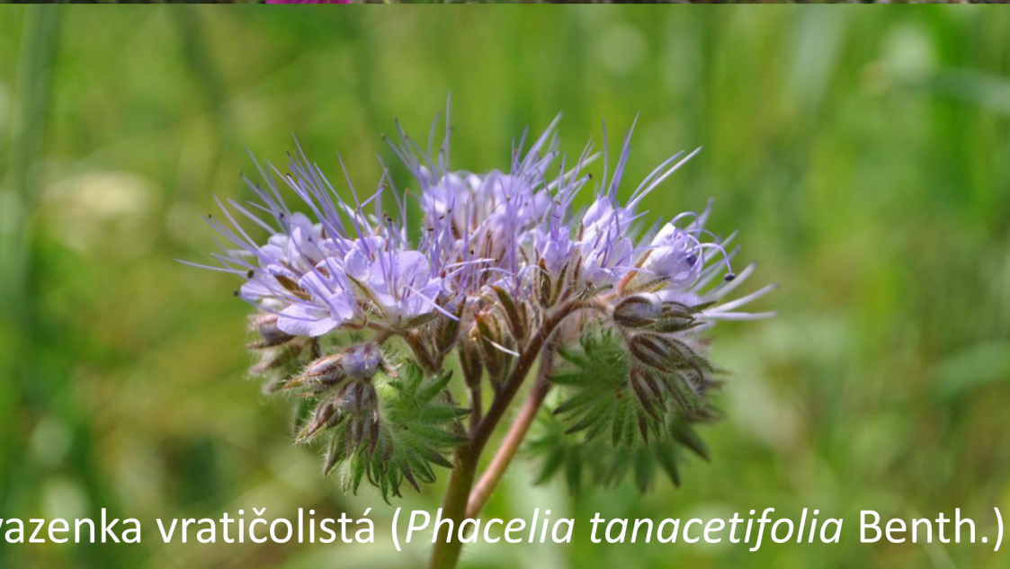
svazenka vratičolistá ( Phacelia tanacetifolia Benth.)