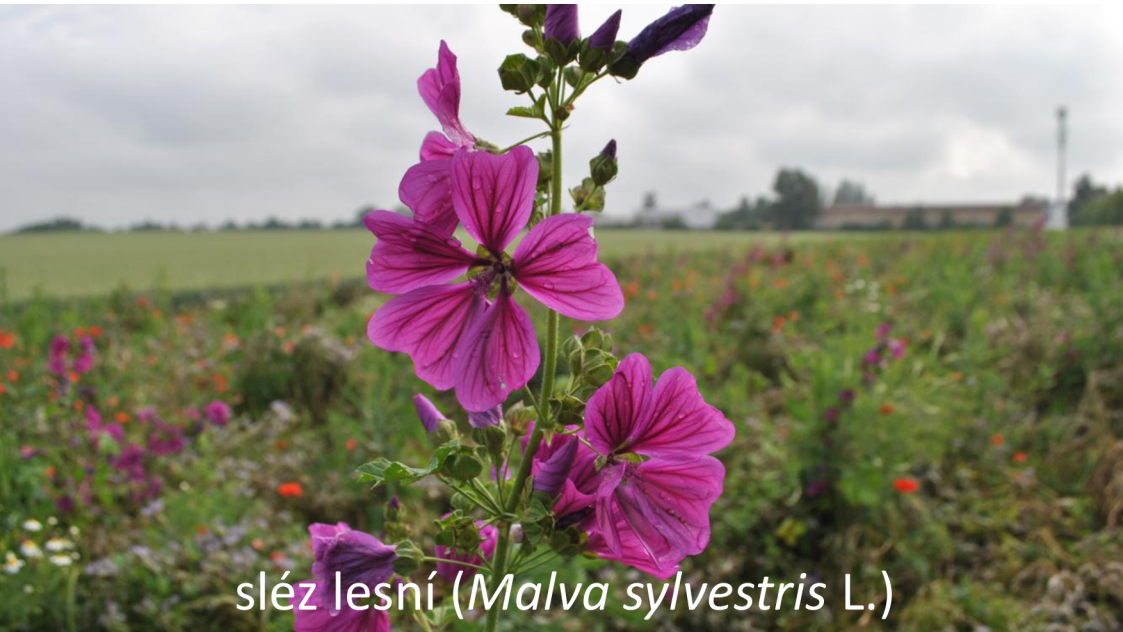
sléz lesní ( Malva sylvestris L.)