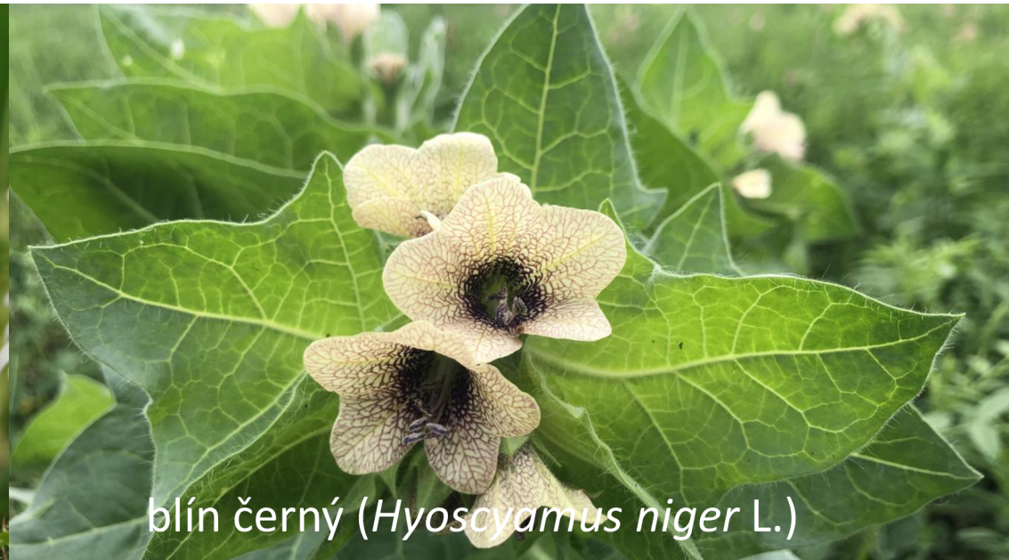
blín černý ( Hyoscyamus niger L.)