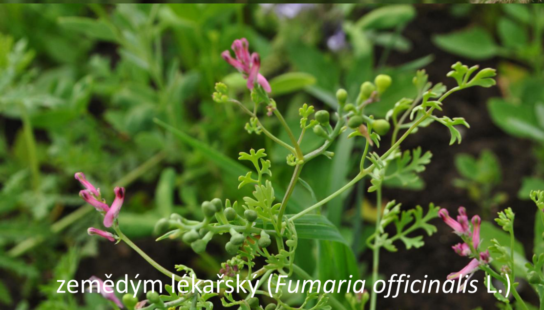
zemědým lékařský ( Fumaria officinalis L.)