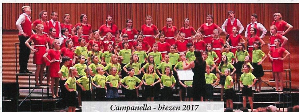
Campanella - březen 2017