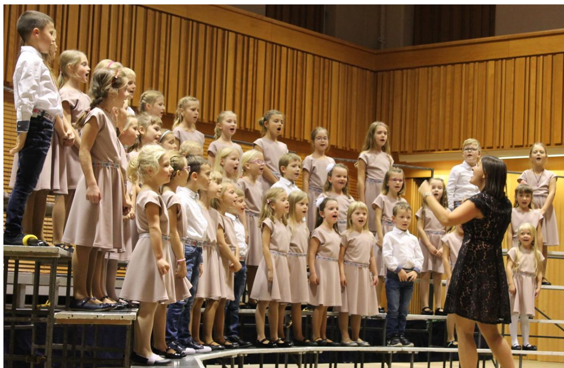
Obrázek č.2 – Pěvecký sbor BERUNKY.