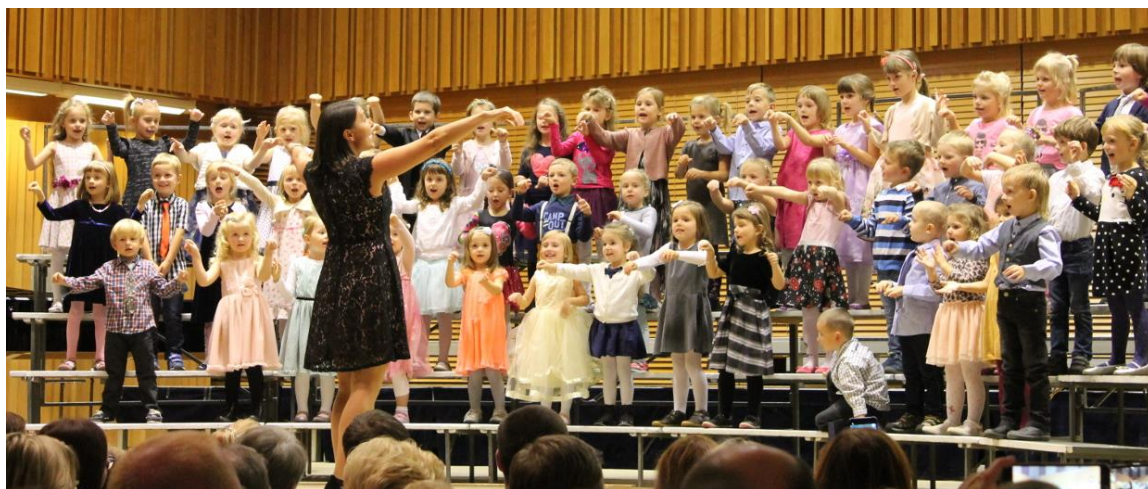
Obrázek č.1 Pěvecký sbor BROUČCI.