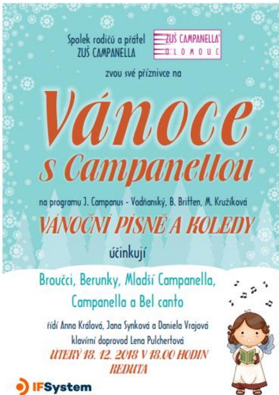
Obrázek č. 7 – Vánoce s Campanellou.