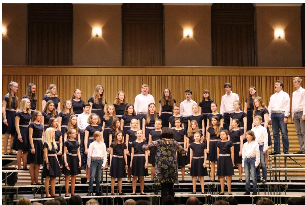
Obrázek č.4 – pěvecký sbor CAMPANELLA.