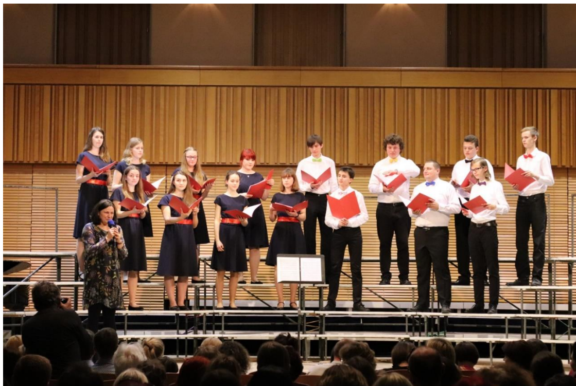
Obrázek č.5 – Pěvecký sbor BEL CANTO.