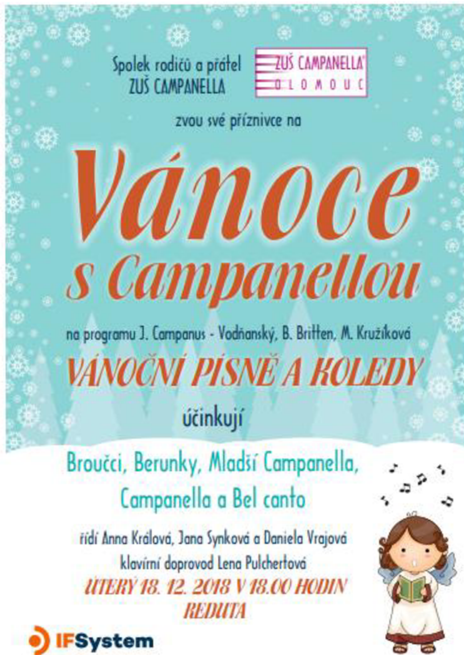
Obrázek č. 7 – Vánoce s Campanellou.