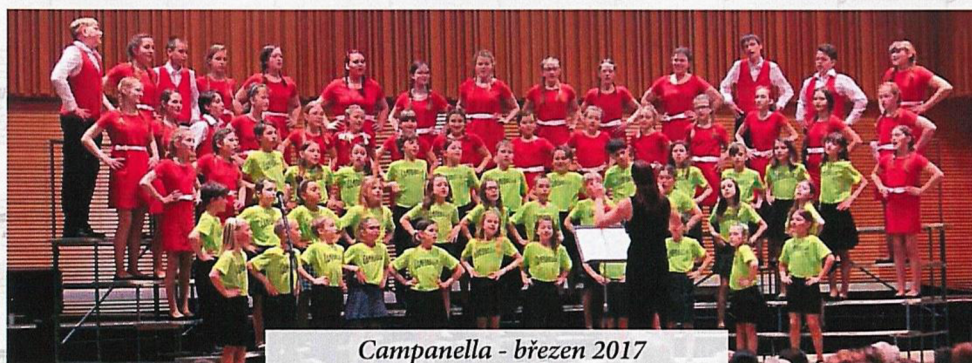
Campanella - březen 2017