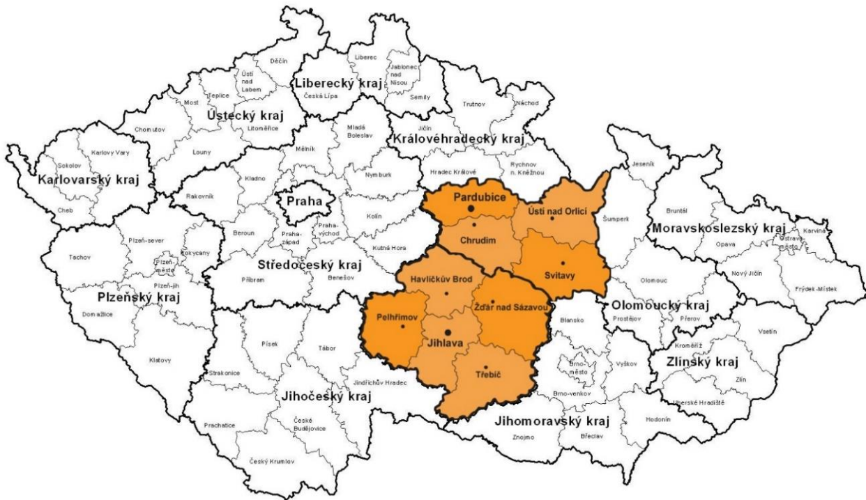
Obrázek č. 1: Znárodněný rozsah lokality mediačních případů

Tatáž výzkumná otázka se také zabývala prostory využívané pro účel mediace. Pokud bylo místo sezení zmíněné v mediační dohodě, využívaly se prostory probační a mediační služby, krizového centra, OSPOD, střediska výchovné péče, resocializačních bytů nebo na vlastní přání se využívaly byty klientů, pro lepší spolupráci v přirozeném prostředí. Pokud by se měla zmínit efektivita přirozeného prostředí na vzniku dohody, velký podíl na tomto faktu nemělo. Bylo využíváno zejména v situaci, kdy byly mediace zúčastněny, buď děti, nebo starší lidé.