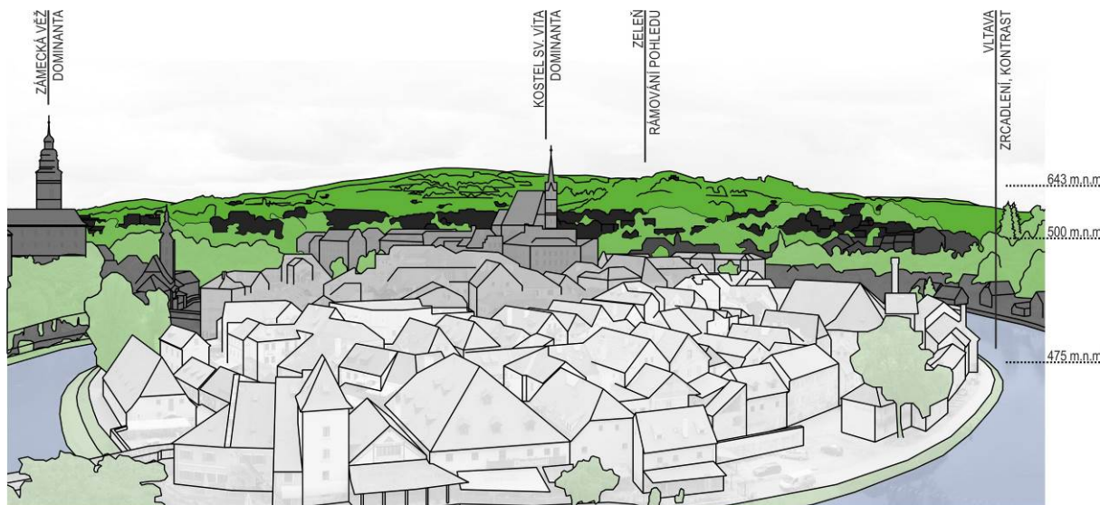
obr. 4 – Český Krumlov – rozbor panoramatického pohledu z hlediska uplatnění přírodních prvků, pohled na město ze zámeckých zahrad. Pohled na jedno z nejkrásnějších českých měst ukazuje vyvážené zastoupení vody, zeleně a architektury – na tomto snímku je to 7% plochy tvořené vodou, 26% zelení a 67% architekturou. Dramatický terén zaklesnutého meandru o převýšení přes 150 m nabývá charakteru členité pahorkatiny až ploché vrchoviny (Demek et al., 2006). (Hejtmánková, 2014)

morfologie terénu. V jednotlivých panoramatech byly vyznačeny architektonické dominanty, které by mohly mít vliv při hodnocení estetického působení (vizuální atraktivita) daného záběru. Hlavním krokem pak bylo stanovení poměru mezi uplatněním přírodní a architektonické (urbánní) složky. Aby nebyl poměr složek zkreslen polohou horizontu na fotografii, byla z celku odečtena plocha oblohy. Výsledná hodnota pak byla vyjádřena vzájemným poměrem a procenty.