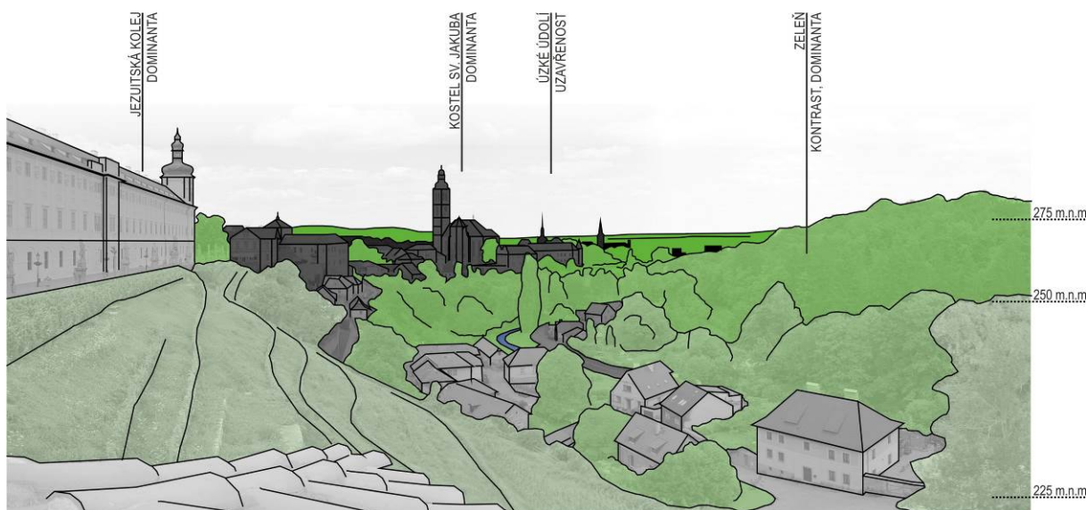
obr. 3 – Kutná Hora – rozbor panoramatického pohledu z hlediska uplatnění přírodních prvků, pohled na město z vyhlídky u kostela sv. Barbory. Díky meandru Vrchlice je možné vnímat historické město zároveň se zalesněným údolím. Ačkoli zde voda tvoří minimální část obrazu, přírodní prvky reprezentované plochami zeleně na vizuálně exponovaných svazích pokrývají přes dvě třetiny plochy (67%) oproti třetině tvořené zástavbou. Převýšení údolí cca 50 m odpovídá charakteru ploché pahorkatiny (Demek et al., 2006). (Hejtmánková, 2014)

Fotografie z jednotlivých referenčních bodů byly překresleny a zjednodušeny v grafickém programu tak, aby bylo vidět zastoupení přírodních a architektonických prvků. V rámci rozboru panoramat byla stanovena urbanistická patra (Říha et al., 1956), která panorama rozčlenila do jednotlivých prostorových plánů (kulís), což vedlo ke zvýraznění