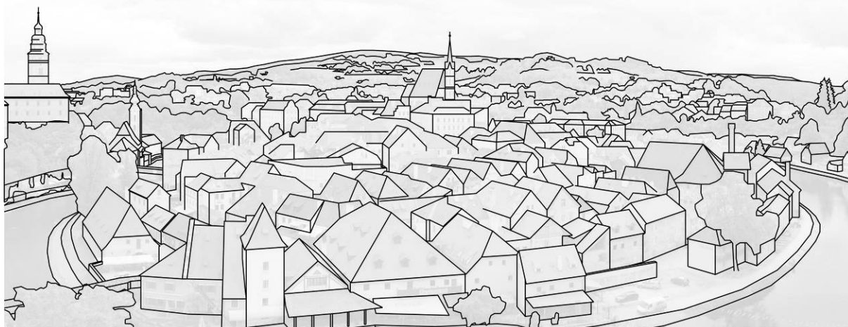
obr. 1 – Vytvoření podkladu pro analýzu panoramatického pohledu (Hejtmánková, 2014)

Vytvoření podkladů. Podkladem pro analýzu je obvykle panoramatická fotografie. Fotografie se v současnosti používá zcela běžně jak pro hodnocení stávajícího stavu, tak pro hodnocení případných zásahů do řešeného prostředí, byť jsou dobře popsány i limity využití fotografií. Otázkou totiž zůstává, nakolik objektivní jsou výsledky hodnocení (městské) krajiny prostřednictvím fotografie, která zůstává uměleckým dílem a jako taková podléhá uměleckým pravidlům. Z tohoto důvodu je využití fotografie v tomto směru kritizováno. O pořizování krajinářských fotografií existuje poměrně rozsáhlá literatura a řada studií, proto není předmětem tohoto příspěvku podrobnější popis zásad jejich pořizování (Hejtmánková, Kupka, 2014).