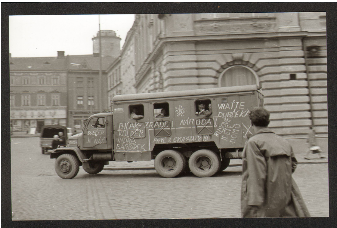
Příloha č. 4: Vozidlo sovětských vojáků na Dolním náměstí v Píerově (dnešní náměstí T. G. Masaryka). Píerovští občané jej popsalí hesly požadujícími odchod intervenčních vojsk.