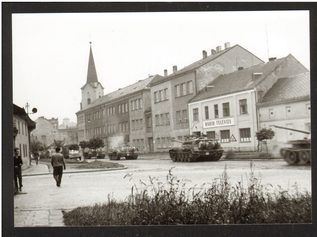
Příloha č. 1: Průjezd tanků vojsk Varšavské smlouvy ulicemi Pířerova ve dnech bezprostředně následujících po vojenské intervenci do Československa v srpnu 1968.