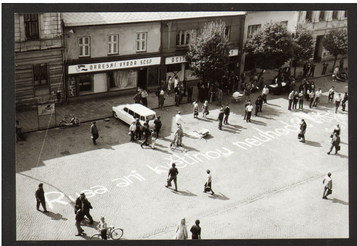
Příloha č. 8: Pohled na dokončený nápis z přílohy č. 7.