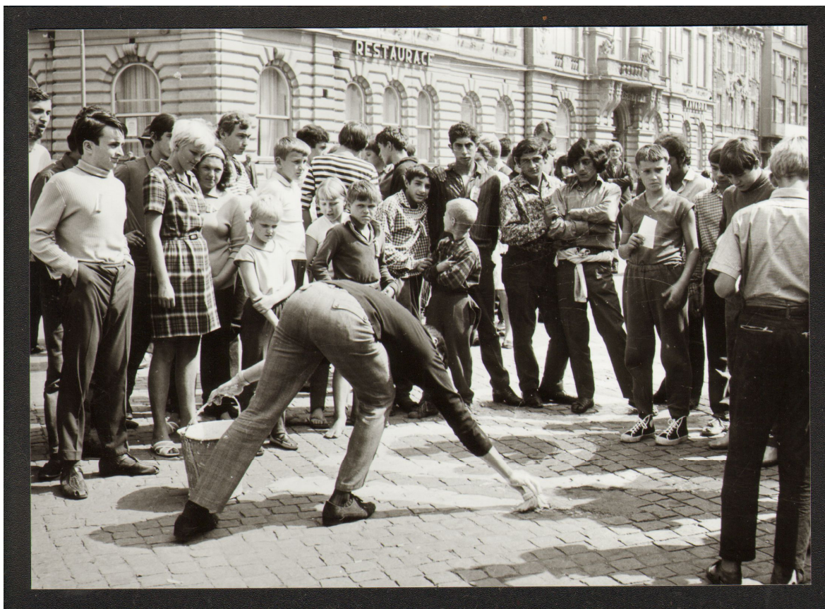
Příloha č. 7: Přerovské Dolní náměstí (dnešní náměstí T. G. Masaryka), srpen 1968. Muž obklopen hloučkem přihlížejících vytváří antisovětsky laděný nápis.