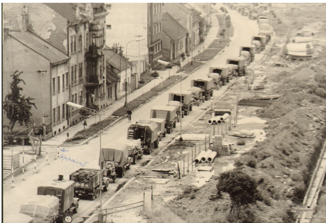
Příloha č. 2: Příjezd vozidel vojsk Varšavské smlouvy do Pířerova v srpnu 1968.