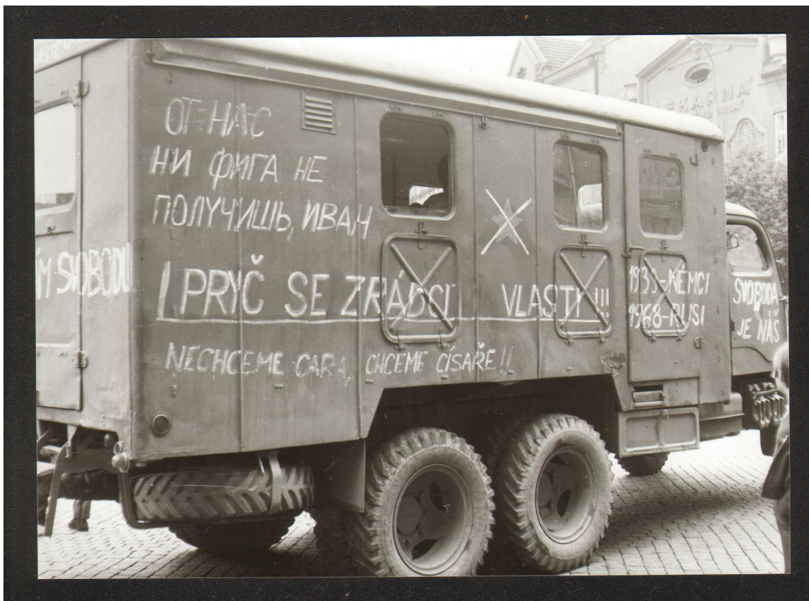
Příloha č. 5: Jiný pohled na vozidlo sovětských vojáků na Dolním náměstí v Přerově (dnešní náměstí T. G. Masaryka).