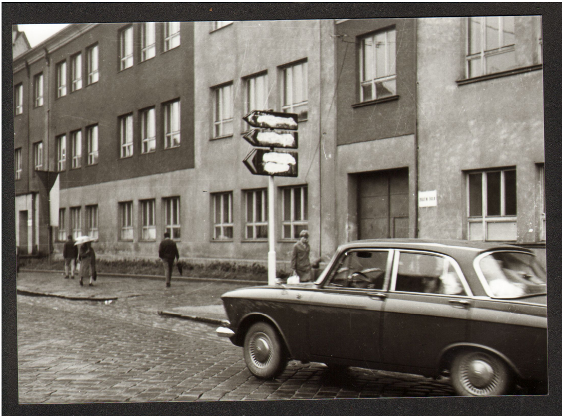
Příloha č. 3: Obyvatelé města Píera zabílili dopravní značení, aby tak ztížili intervenčním vojákům orientaci ve městě a jeho okolí.