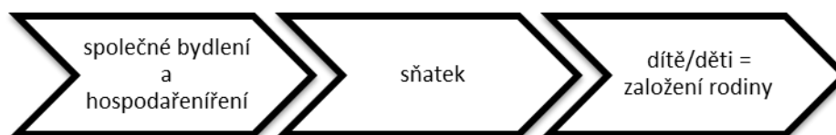
Obrázek č. 1: Diagram založení rodiny

Vztah partnerů často provází i plánování rodiny. Vhodný scénář událostí k založení rodiny vidí dotazovaní mladí muži shodně. Takový scénář obsahuje společné žití na zkoušku a hospodaření, poté sňatek a následně narození prvního dítěte (viz. Obrázek č. 1).