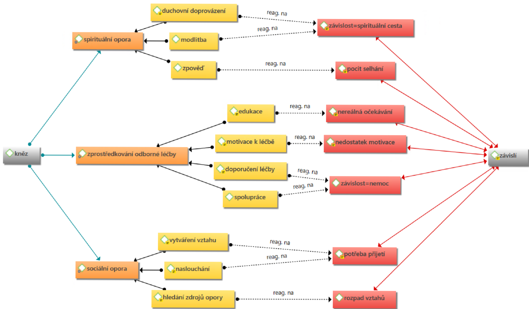
Obrázek 2: Redakce kněží na vnitřně charakteristický uživatelů