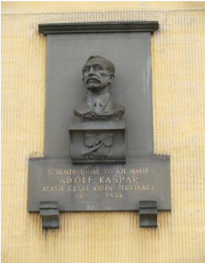
[13] Busta na domě AK v Lošticích