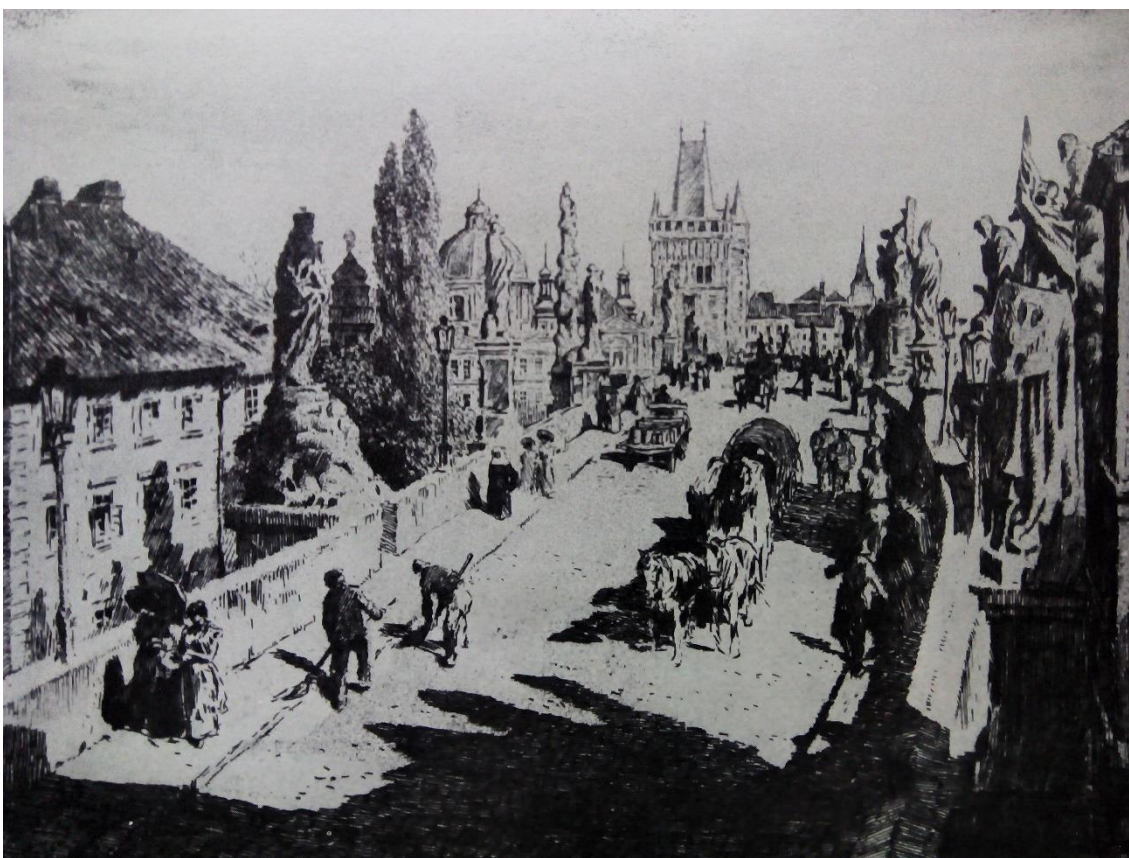
[2] Karlův most - lept 1909