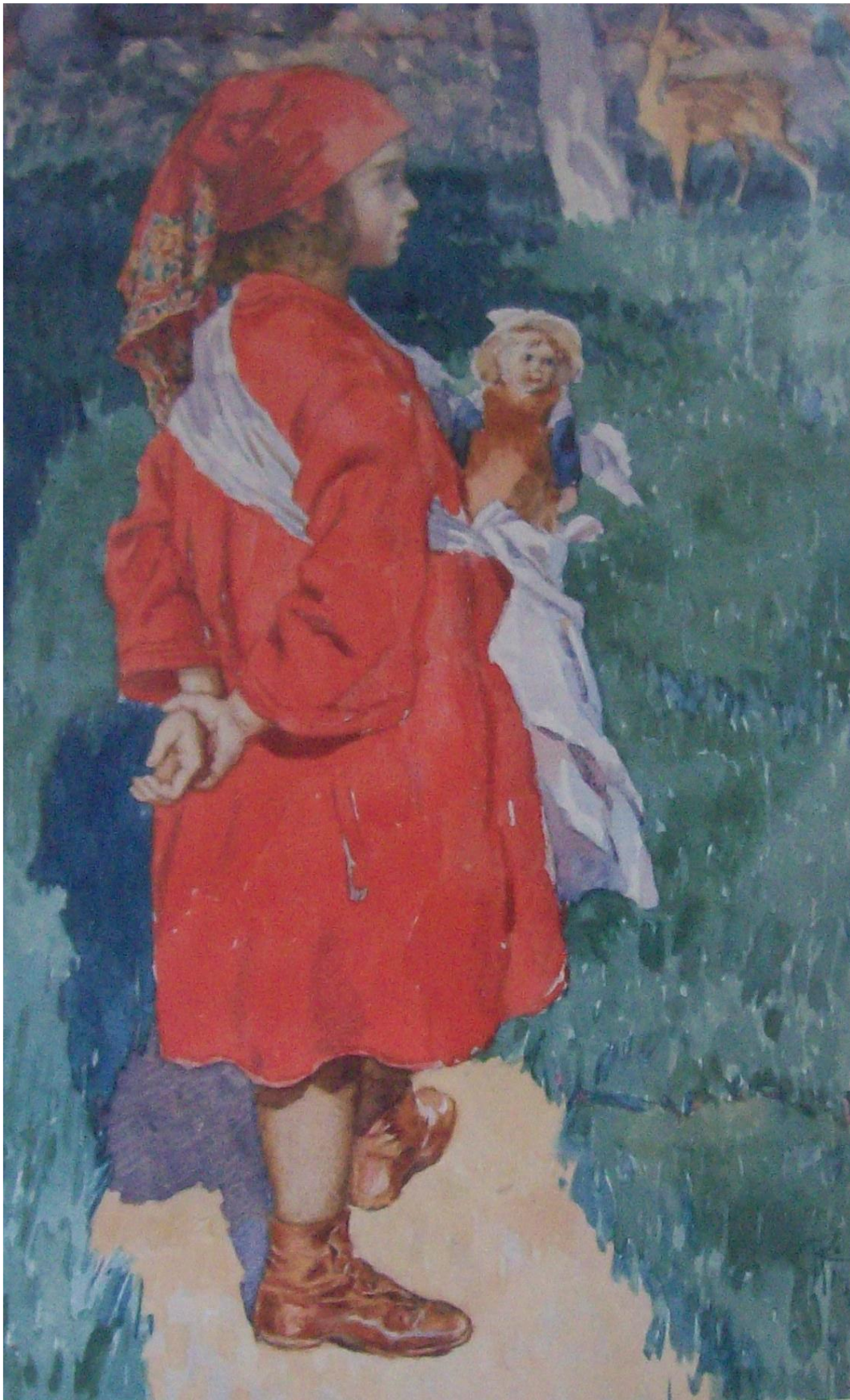
[10] Jitka se srnkou v loštické zahradě - akvarel 1913