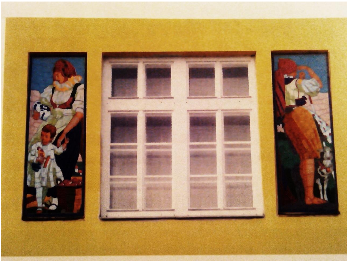
[12] Průčelí domu v Lošticích s malbami podle Kašpara