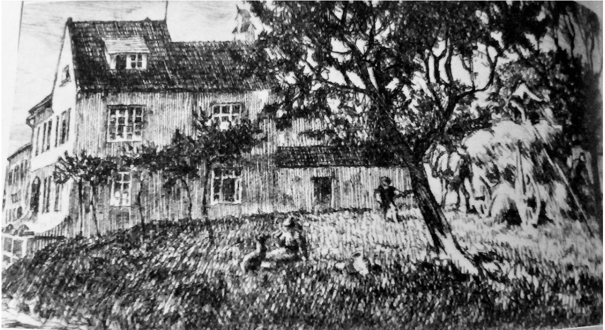
[4] Kašparův dům v Lošticích, lept 1911