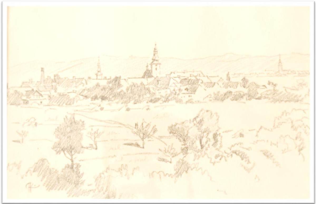
[16] Adolf Kašpar - Loštice