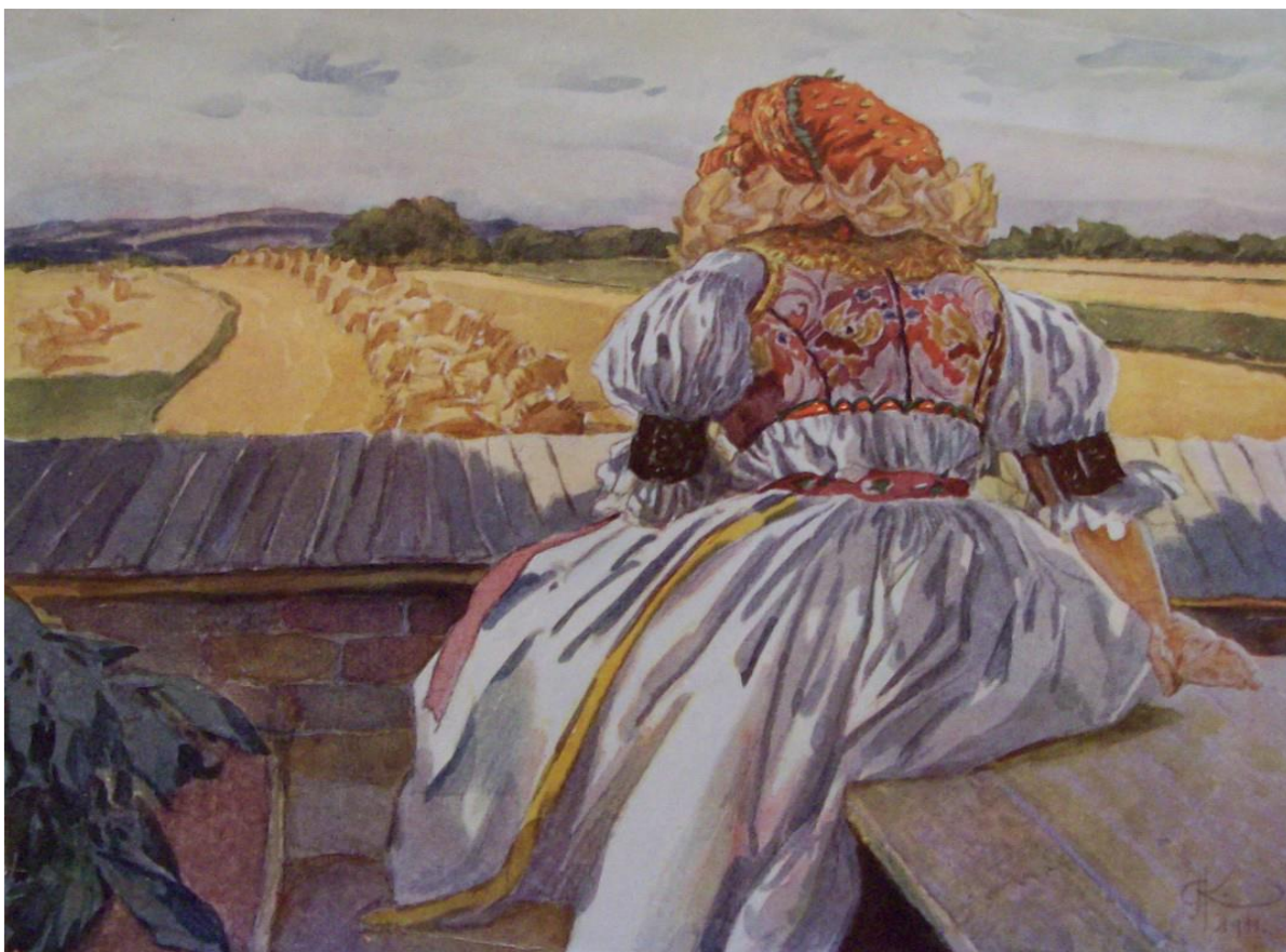
[9] Plakát Hanačka - motiv z Loštice 1911

Zdroj: JANÍČKOVÁ, P. ŠTĚTINOVÁ, D., TURKOVÁ, A. Adolf Kašpar a Loštice . Šumperk, 2004. str.35