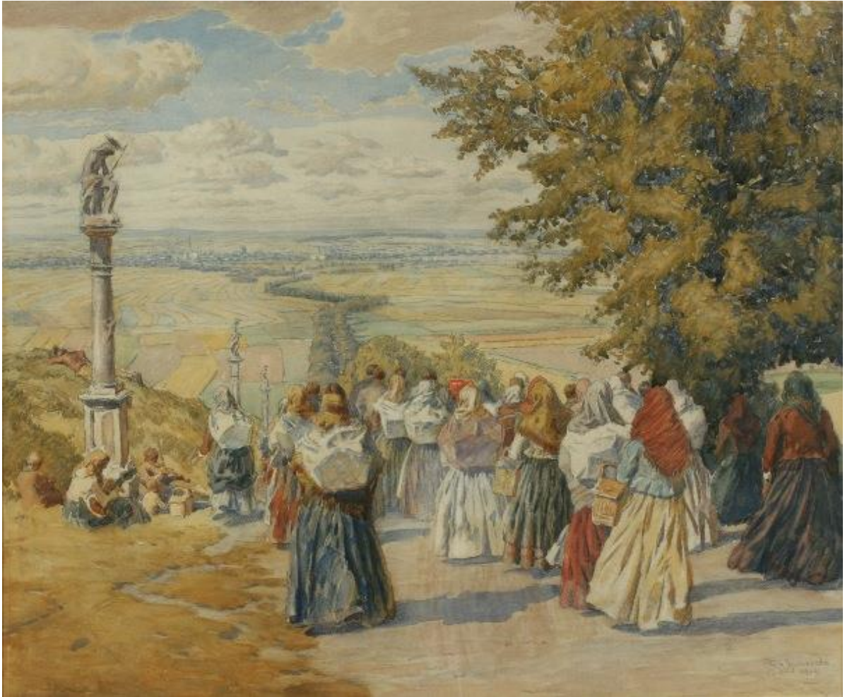
[8] Pouť na Svatém Kopečku 1909