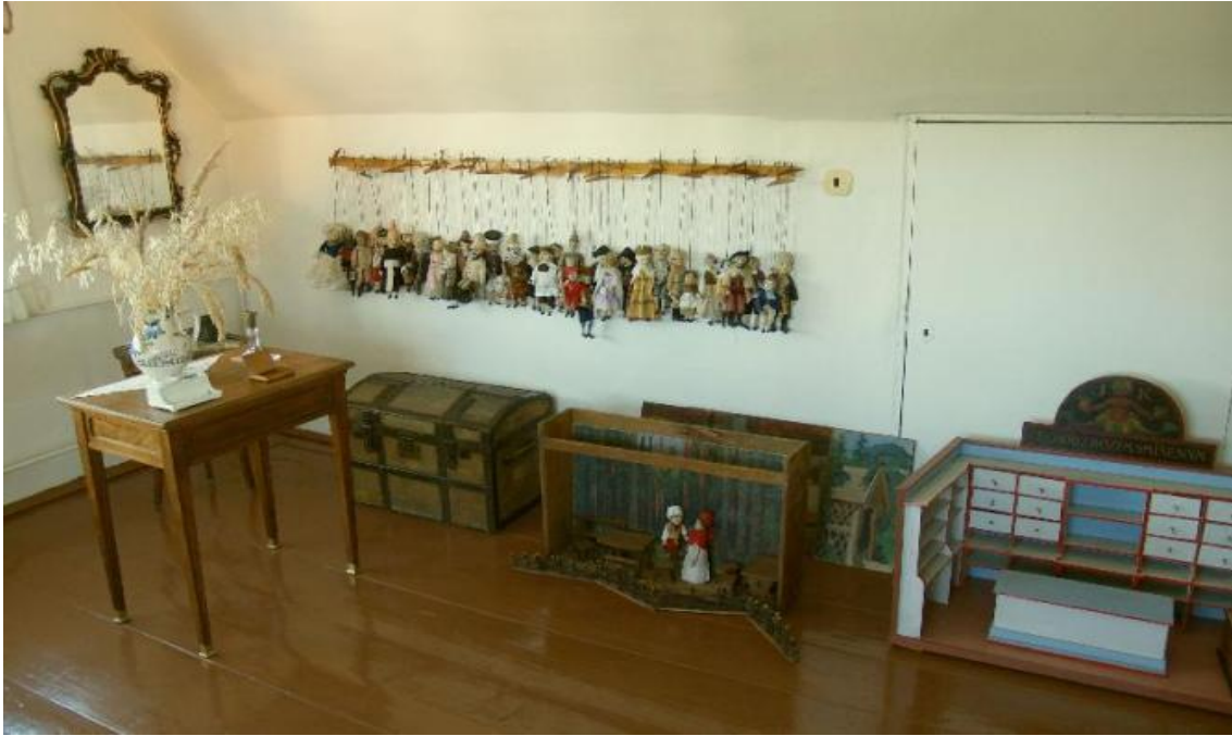
[11] Památník AK v Lošticích - loutky