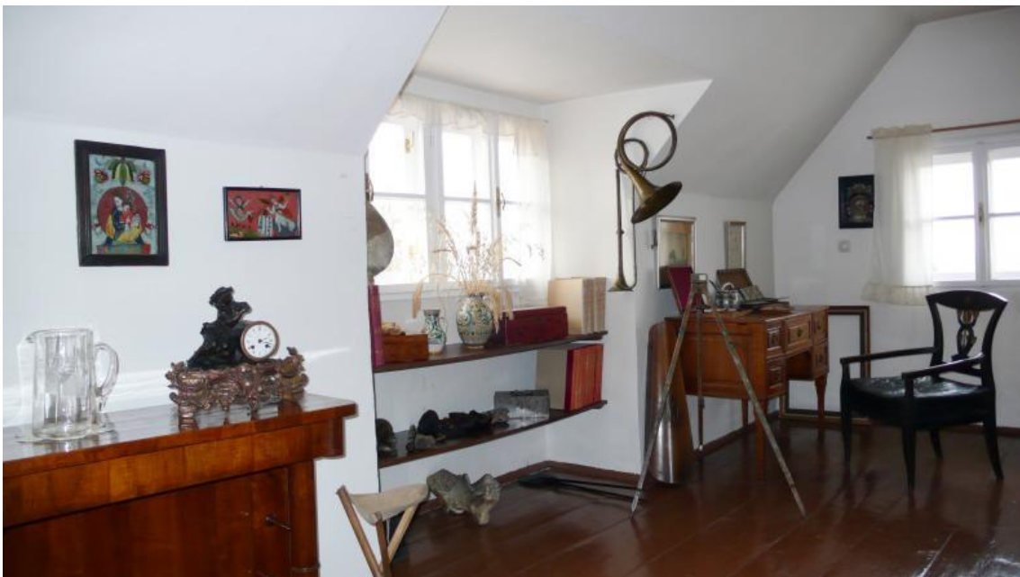
[14] Památník AK v Lošticích - ateliér