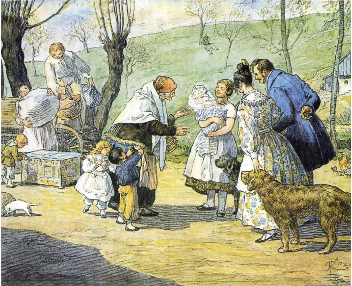
[3] Kašparova ilustrace 1 z knihy Babička od Boženy Němcové