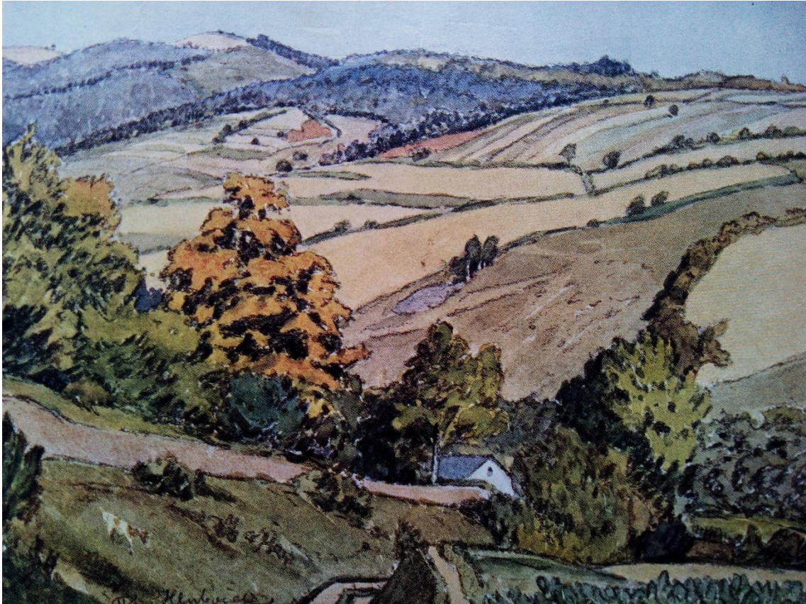
[7] V polích za Hlubočkem - akvarel 1909

Zdroj: SCHEYBAL, J. V. Adolf Kašpar, život a dílo . 1. vyd. Praha: Státní nakladatelství krásné literatury, hudby a umění, 1957. příloha