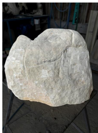
Obrázek.č. 12 – Materiál před tvorbou pana Miloše Obrázek.č. 13 – Výsledné dílo pana Miloše