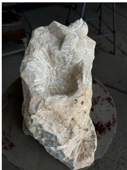
Obrázek č.9 – Výchozí podoba materiálu