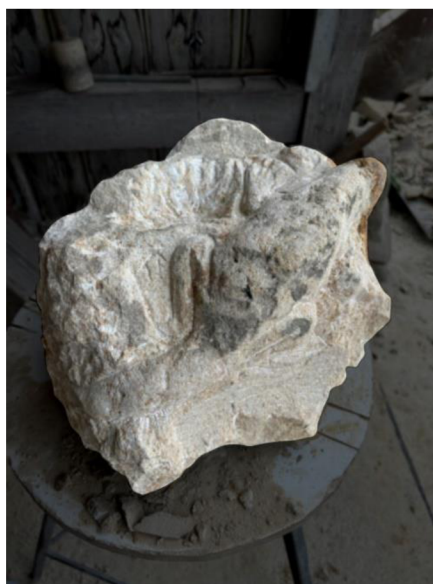
Obrázek č.7. – Výchozí podoba materiálu pro tvorbu paní Jiřiny