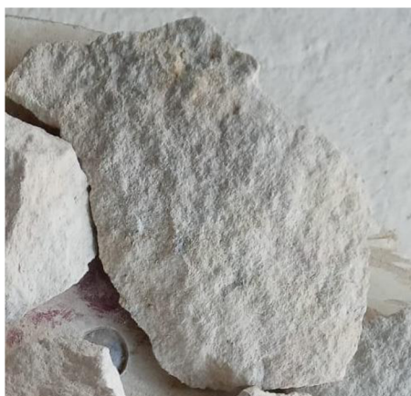
obr.č.18 odštěpek před opracováním

Na workshopu si vybrala odštěpek kamene, který jí připomínal rybu, a pracovala na něm samostatně. Na závěr řekla, že ryba symbolizuje volnost, což naznačuje její touhu po svobodě a volném pohybu. Ráda by viděla umělecká díla v zahradě domova, která by kombinovala křídla a prvky akumulace vody, symbolizující životní energii a sílu.