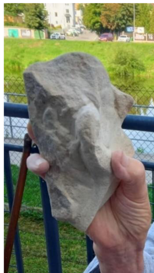
Obrázek. č. 25 – Odštěpek kamene před opracováním