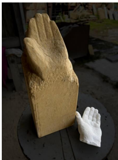
Obrázek.č. 14 – Porovnání ruky se sádrovou kopií