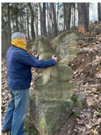
Příloha č.3 - Fotodokumentace programu - hmatové prozkoumávání prostorového a povrchového uspořádání soch z Cesty Andělů