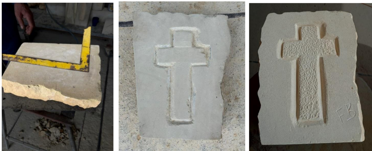
Obrázek. č.1 - výchozí materiál Obrázek. č. 2 - průběh tvorby Obrázek.č.3 – výsledné dílo