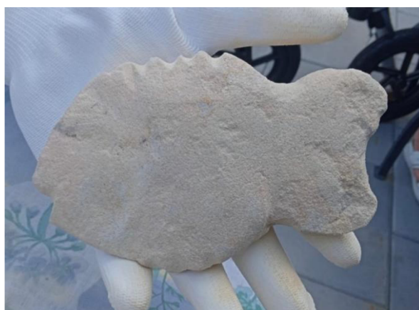
obr.č.19 Výsledná podoba artefaktu paní H.

Dokončený artefakt vytvořený seniorkou z odštípnutého úlomku kamene připomíná fantazii a představivost pravěkého člověka z doby asi před padesáti tisíci lety. „ Díky ní si mohl povšimnout nalezených nebo odštípnutých úlomků kamene, které mu připomínaly tvary těl zvířat, jež znal důvěrně z lovu. Stačilo nalezený kámen dotvořit několika přesnými údery kamenného nástroje. “ (Šamšula, 2009, s.9). U předmětů připomínající tvary těl zvířat, tzv. zoomorfů se dle Šamšuly (2009) dodnes vědci přou, zda je neandrtálský člověk skutečně vytvořil, nebo jen našel. Literatura uvádí, že