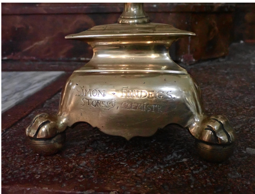
Příloha č. 7: Bronzové svícny darovány roku 1693 Šimonem Findejsem a Matějem Němců