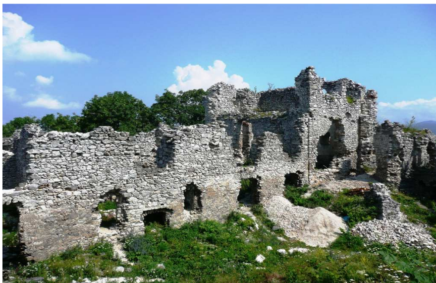
Obrázok 6: Zrúcanina hradu Tematín

Tematín – k zrúcanine hradu Tematín je najlepšia cesta autom alebo horským bicyklom, je vzdialený 25 km od Piešťan. Je tu aj možnosť turistiky po vyznačenej trase. Hrad vznikol v 2. polovici 13. storočia ako jeden zo strážnych hradov nad cestou nad údolím Váhu. Hrad veľakrát zmenil majiteľov. Dnes si môžeme pozrieť len ruiny hradu, obvodové murivá spevnené kamennou bosážou.