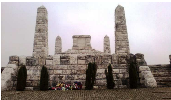
Obrázok 3: Mohyla na Bradle

Štefánikova mohyla na Bradle nadchne obdivovateľov monumentov a aj milovníkov prírody. Týči sa na kopci vo výške 543 metrov nad morom a je odiaľ nádherný výhľad na okolitý kraj, na dolinu s dedinou Košariská a mestom Brezová pod Bradlom, na kopce Bielych a Malých Karpát, vidno z nej siluety Čachtického hradu.