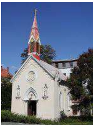
Obrázok 1: Kaplnka

Kaplnka pri Kolonádovom moste – neogotická Kaplnka Božského Srdca Ježišovho z roku 1897, postavená o sto metrov východnejšie na pobreží Váhu. Pôvodne baroková kúpeľná kaplnka sv. Jána Nepomuckého z roku 1760 bola zbúraná koncom 19. storočia.