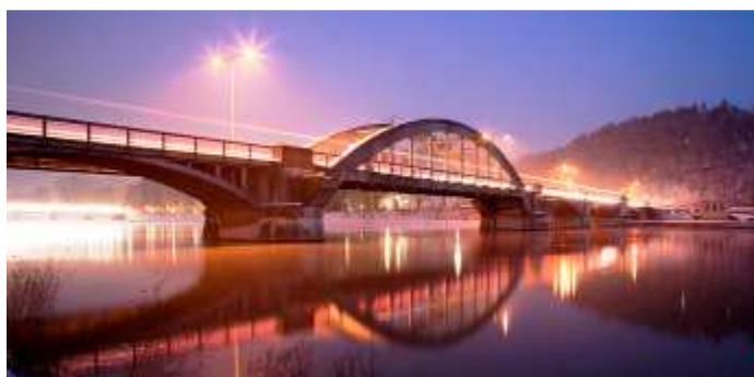
Obrázok 2: Krajinský most

doska nesúca vozovku je v širšom poli zavesená na bočných železobetónových oblúkoch, v užších poliach podopieraná spodnými oblúkovými doskami. Tento most bol v apríli 1945 poškodený ustupujúcimi fašistickými vojskami. Ale ihneď bol rekonštruovaný. Jeho nevýhodou je, že je úzky.