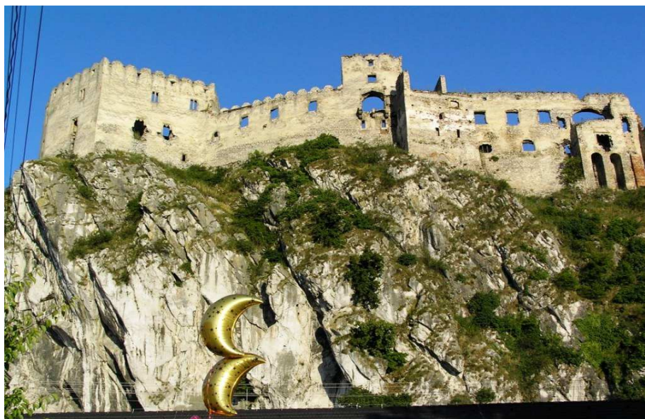
Obrázok 5: Zrúcanina hradu Beckov

ktoré budú tvoriť vhodnú dekoráciu k hlavnému účelu využitia.“(Hrad Beckov, online, cit. 2013-01-08).