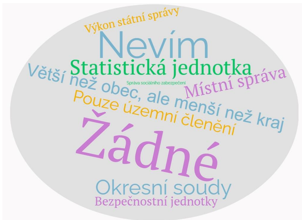
Obr. 6 Odpovědi respondentů na otázku 28 (zdroj: vlastní data)

Čestnosti odpovědí jsou znázorněny v příloze 6. Respondent 5 se vyjádřil: „Ze zkušenosti vím, že soudnictví a také policie třeba.“