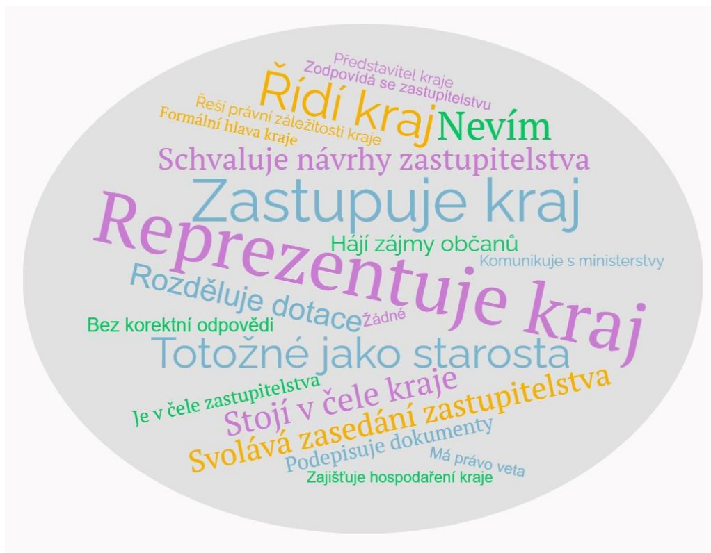
Obr. 5 Odpovědi respondentů na otázku 24

Čestnosti odpovědi jsou znázorněny v příloze 5. V odpovědích se i objevily dvě odpovědi, které byly zařazeny do kategorie Bez korektní odpovědi .