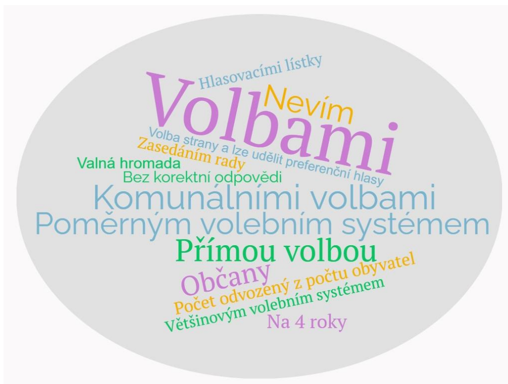
Obr. 4 Odpovědi respondentů na otázku 18

Čestnosti odpovědí jsou znázorněny v příloze 4. V odpovědích se objevila 1 odpověď, a to: „V Olomouci podle financí,“ která byla zařazena do vlastní kategorie Bez korektní odpovědi .