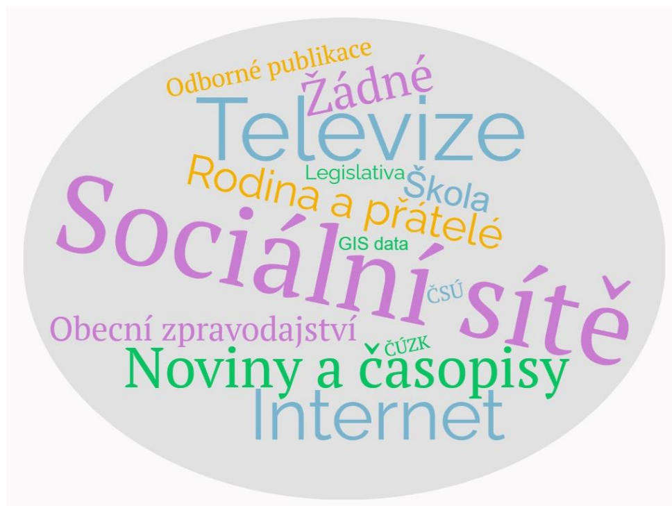
Obr. 7 Odpovědi respondentů na otázku 30

4.5. Jaký způsob zpravodajství nebo informačního zdroje používáte nejčastěji k získání informací o územně-správním systému?