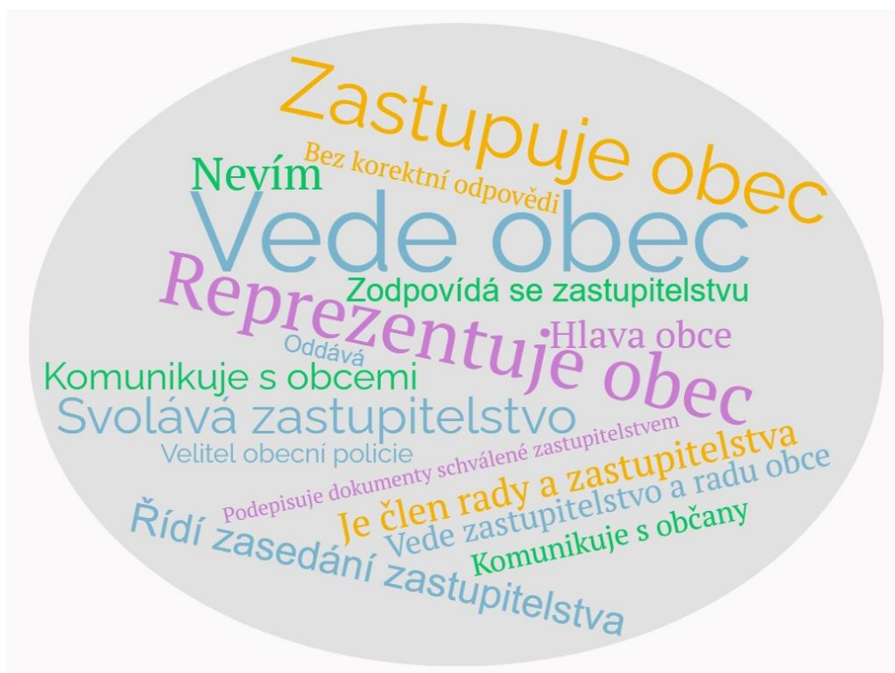
Obr. 3 Odpovědi respondentů na otázku 17

Čestnosti odpovědí jsou znázorněny v příloze 3. V odpovědích se i objevily dvě odpovědi, které byly zařazeny do kategorie Bez korektní odpovědi .