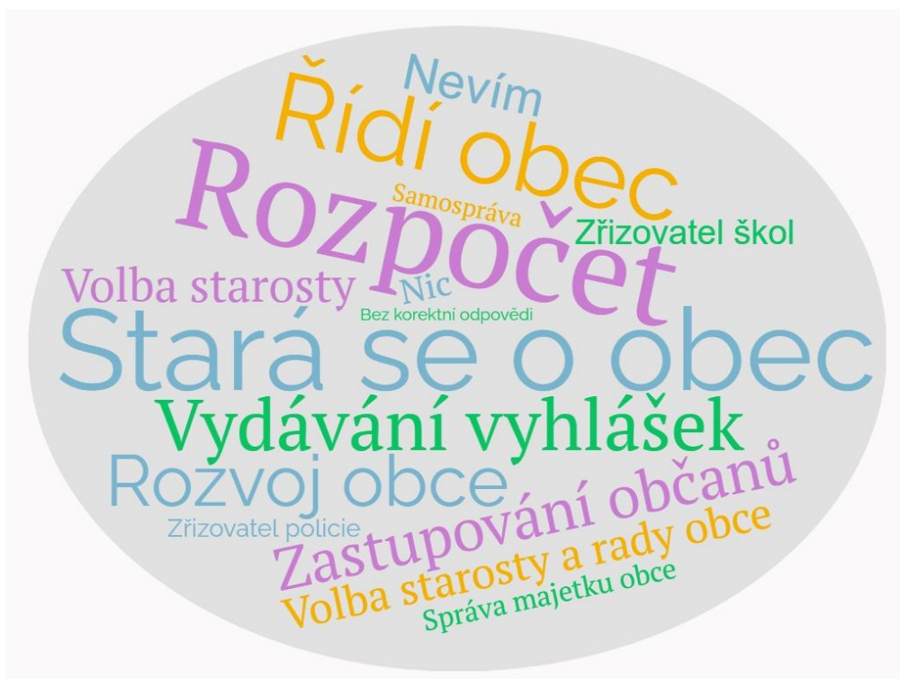
Obr. 2 Odpovědi respondentů na otázku 16

Čestnosti odpovědí jsou znázorněny v příloze 2. V odpovědích se i objevily tři odpovědi, které byly zařazeny do kategorie Bez korektní odpovědi .