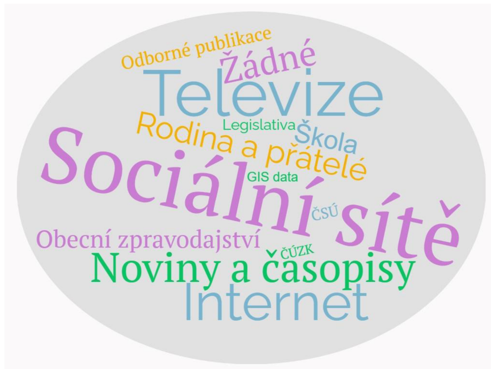
Obr. 7 Odpovědi respondentů na otázku 30

4.5. Jaký způsob zpravodajství nebo informačního zdroje používáte nejčastěji k získání informací o územně-správním systému?