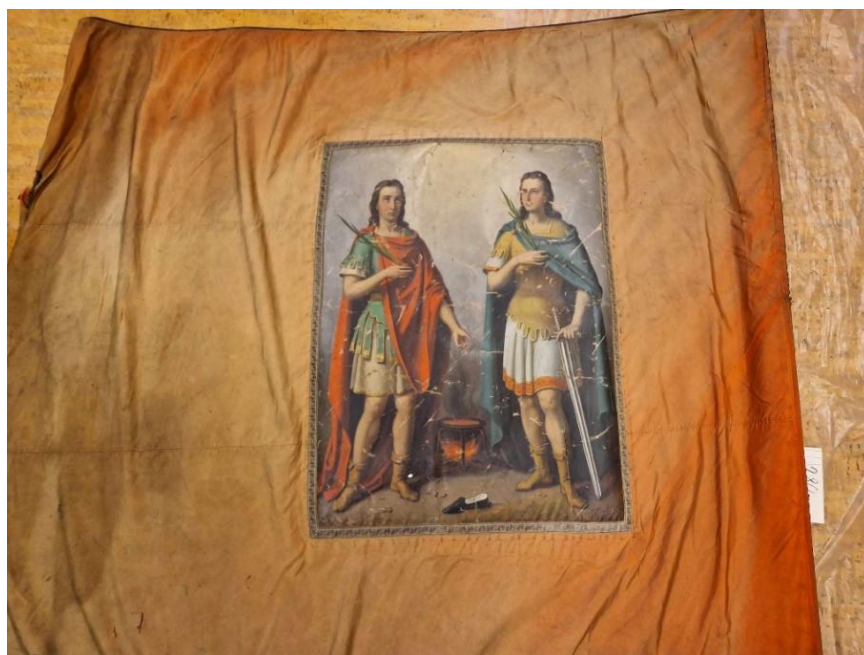
Rubní strana praporu