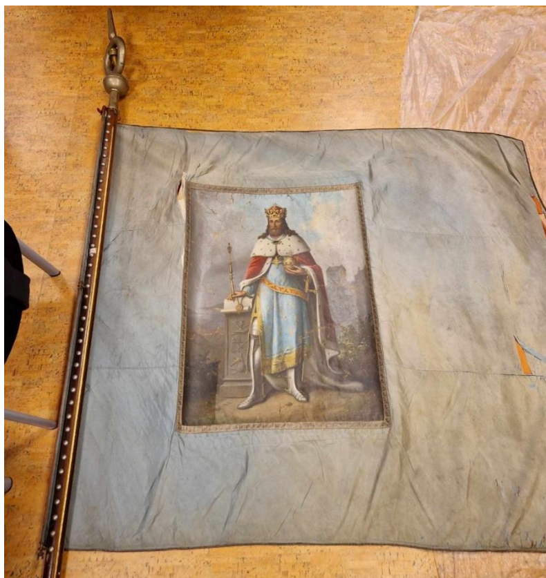
Lícní strana praporu