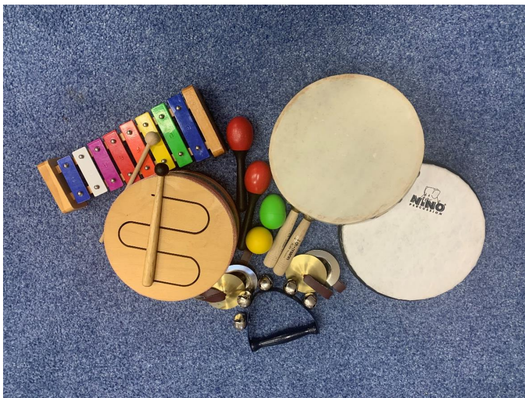
Obrázek 2 Orffovy nástroje

Pro děti byla připravena sada nástrojů, přičemž některé z nich byly autorky, ostatní byly zapůjčeny ze Základní umělecké školy, kde autorka působila. Jednalo se o bubínky (6ks), rolničky (4 ks), činely (2 ks), rumba koule (2 ks), vajíčka (2 ks) paličky (3 ks) a xylofon (1 ks).