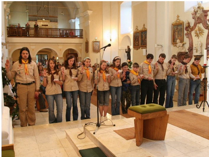
Obr. 4: Obnova skautských slibů při mši svaté, 2007