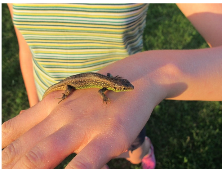
Obr. 21: Ještěrka – obyvatel areálu klubovny