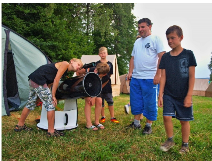
Obr. 12: Astronomický kroužek na táboře, 2015