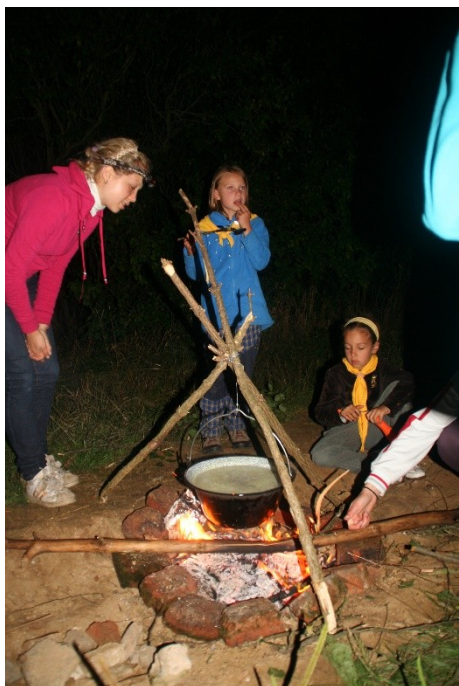
Obr. 7: Vaření v přírodě