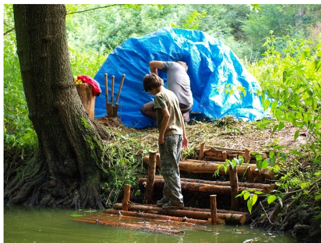
Obr. 9: Táborová indiánská sauna