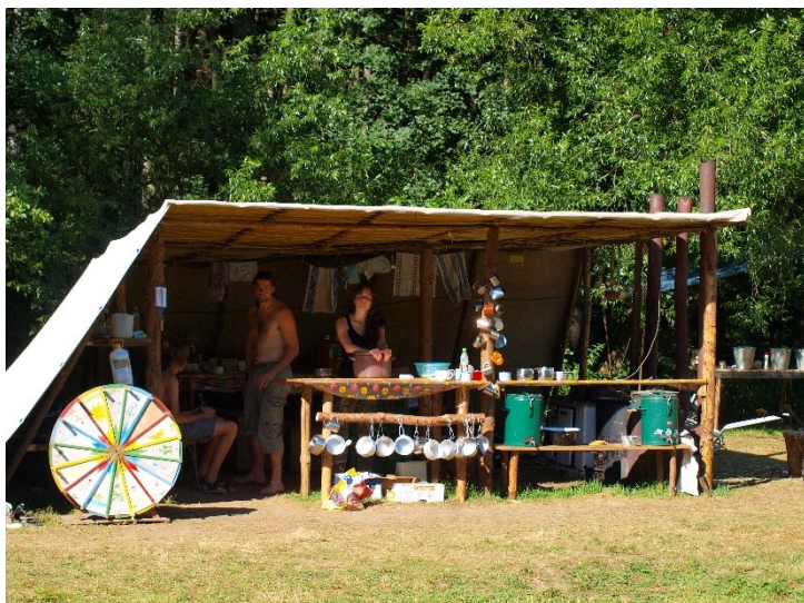
Obr. 14: Táborová kuchyně