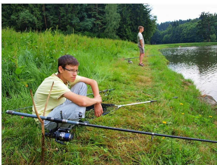
Obr. 19: Táborové rybaření