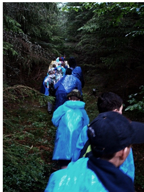
Obr. 18: Táborové putování