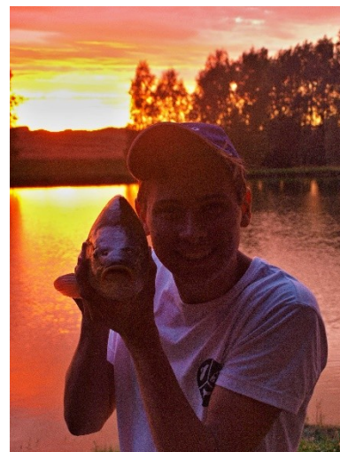
Obr. 20: Úlovek a jeho puštění