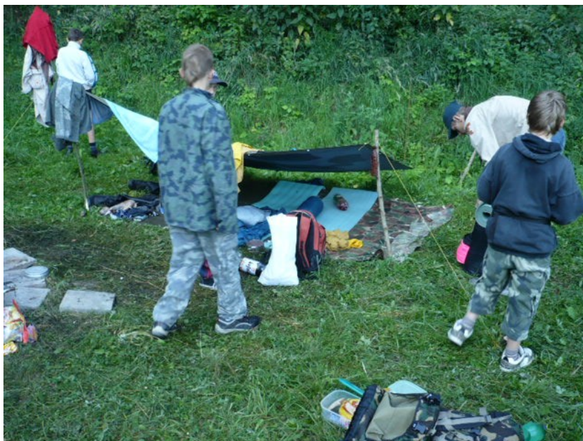
Obr. 10: Nocleh v přírodě při dvoudenní výpravě