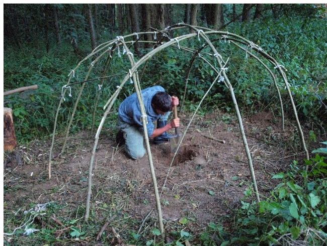
Obr. 8: Stavba indiánské sauny na táboře