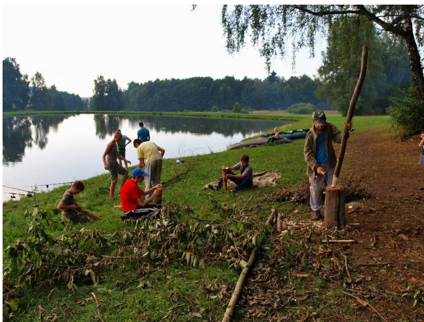
Obr. 16: Táborová rukodělná činnost se dřevem