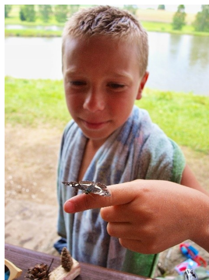
Obr. 22: „Ochočený“ motýl