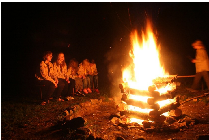
Obr. 17: Tradiční táborové ohně