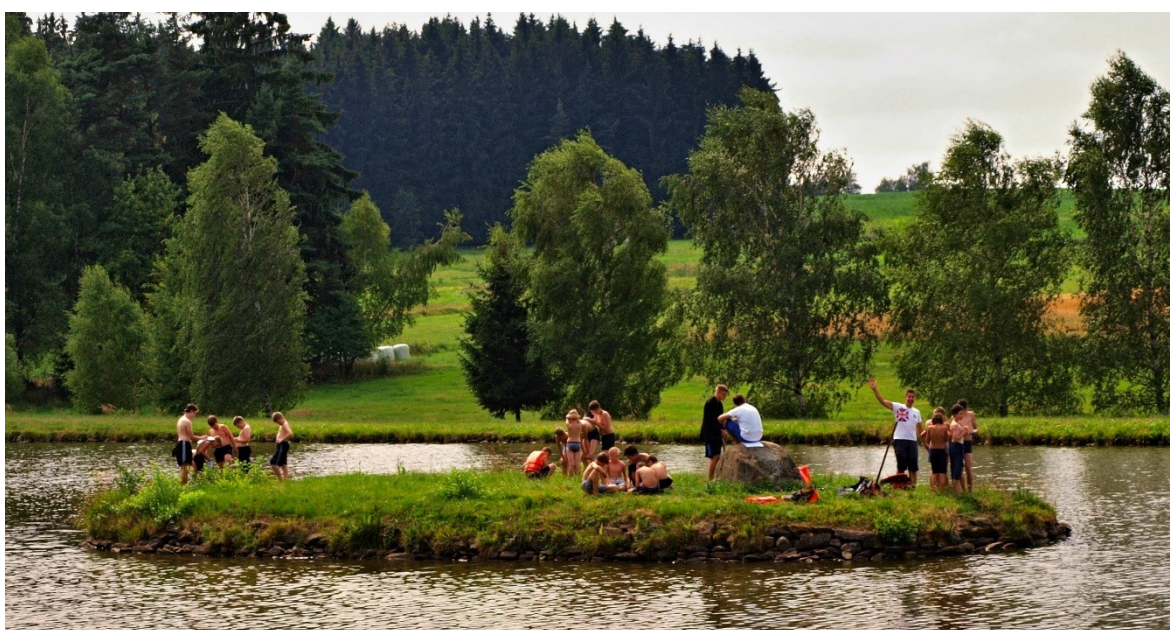
Obr. 13: Etapová celotáborová hra na táboře v Nové Vsi u Batelova, 2015