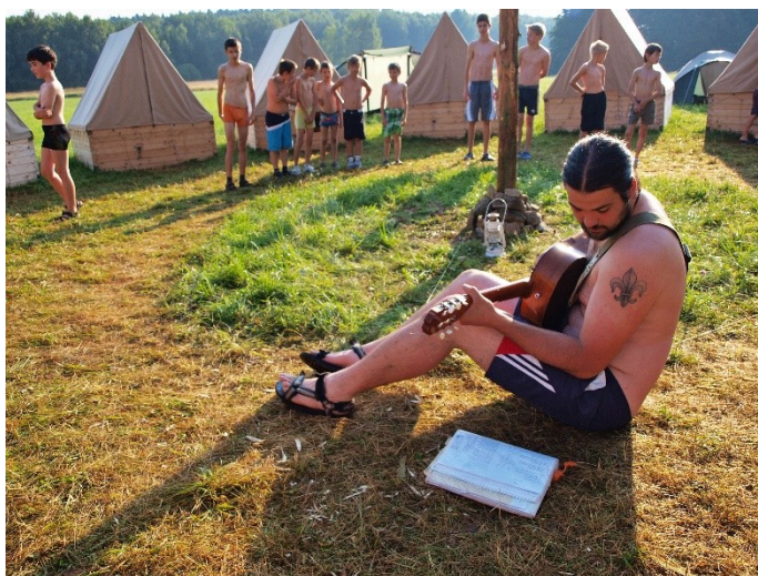
Obr. 15: Táborová rozsvička