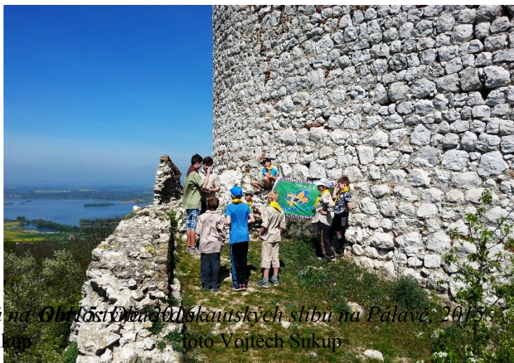
Obr. 6: Obnova skautských slibů na Obřadostě Otava foto Vojtěch Sukup Obřad skautských slibů na Pálavě, 2013 foto Vojtěch Sukup