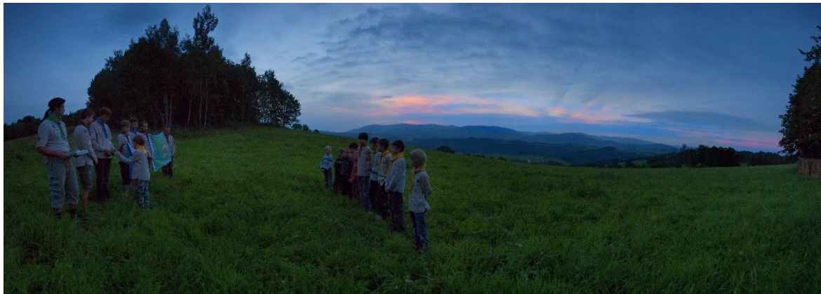
Obr. 3: Skládání slibu vlčat ve Vysokých Žibřidovicích, 2012