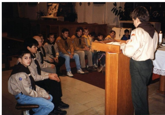
Obr. 1: Skládání skautského slibu v Olešnici 2002