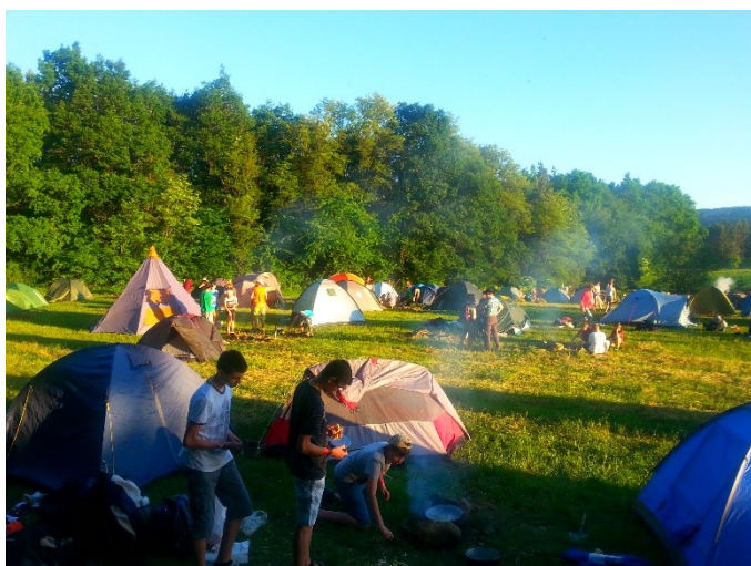
Obr. 11: Svojsíkův závod v Boskovicích, 2015