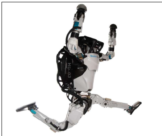
Obr. 15 Robot Atlas

Robot Atlas od Boston Dynamic je výzkumná platforma navržená tak, aby posouvala hranice celotělové mobility. Projekt Atlas si klade za cíl dosáhnout pokroku v hardwaru a softwaru robotů, který nám umožní vyrovnat nebo překonat průměrný lidský výkon v úlohách dynamické mobility (Boston Dynamic, 2022).