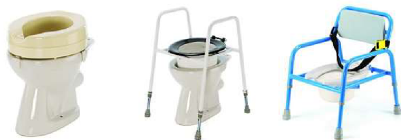
Obr. 6 Nástavce na WC, klozetové křeslo