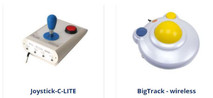
Obr. 1 Počítačová myš fungující na principu páky a koule

V oblasti problematiky augmentativní a alternativní komunikace je často využívána asistivní technologie. Mezi takové asistivní technologie v oblasti IT můžeme zařadit externí spínače a adaptéry - pomocí takových externích spínačů (tlačítek) a za pomoci speciálního software dokáže ovládat počítač i člověk s těžkým tělesným postižením. Externí tlačítka slouží také pro zjednodušené ovládání speciálních programů mentálně i tělesně postiženými dětmi, kterým by ovládání počítače přes standardní periferie (myš, klávesnice) dělalo velké potíže. Dále jsou k dispozici speciální klávesnice. Mnozí lidé s postižením nezvládají díky svému handicapu psaní na standardní klávesnici. Typickým příkladem jsou lidé s mozkovou obrnou. Dále jsou na trhu alternativní myši (polohovací zařízení) – ovládané rukama. Podobný problém jako při používání klávesnice mohou mít lidé s postižením při používání standardní myši, proto jsou k dispozici zařízení na principu trackballu (koule) tak i jouysticku (páky). U lidí s těžkým postižením, kteří nejsou schopni ovládat počítač pomocí rukou je nabízeno řešení v podobě ovládání počítače pohyby hlavy, ústy, očima, nebo speciálními spínači.