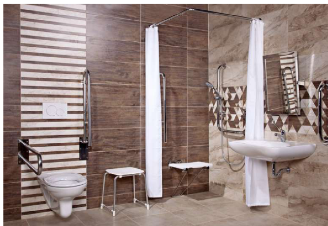
Obr. 7 Bezbariérová koupelna

V oblasti osobní hygieny je v literatuře zmiňován termín bezbariérová koupelna. V případě, že budujeme nové bydlení osobě s tělesným postižením, berme v potaz, že je nutné mít dostatečný prostor na případnou manipulaci s invalidním vozíkem. Bezbariérová koupelna se vyznačuje bezbariérovým stupem, podlahou bez překážek, umyvadlem v požadované výšce, toaletou s madly na stěnách, sprchovým koutem bez překážek na zemi, bezbariérová koupelna může být vybavena vanou s madly.