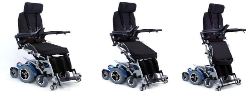
Obr. 8 Invalidní vozík s elektickým pohonem 4 kol a funkcí stání.

skončení následují soutěže paralympiády. OH v Sydney v roce 2000 se zúčastnilo již 123 zemí a téměř 4000 sportovců (Táborský, 2004).