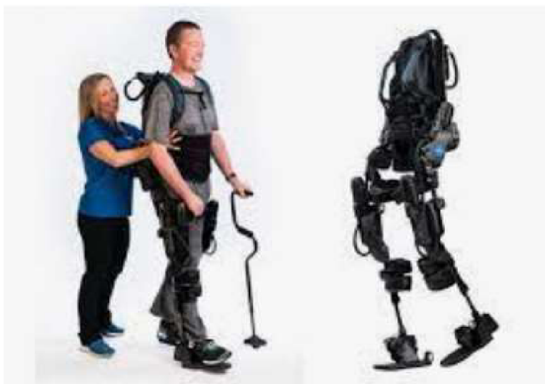
Obr. 11 EksoNR robotický exoskelet