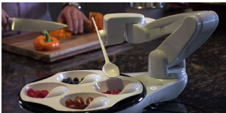
Obr. 5 Robotická ruka Obi

iEat je další robotické krmné rameno. Na rozdíl od iCraftu je však komerčně dostupné. iEat používá otočnou základnu, která se připevňuje k motorovému modulu (Medium, 2018).