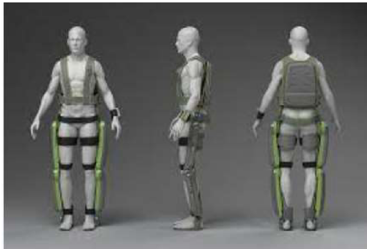
Obr. 10 ReWalk personal 6.

Pro podporu chůze a rehabilitace bylo navrženo a vyvinuto několik dalších exoskeletonů. Mezi ně můžeme zahrnout výrobek EksoNR a Ekso Indego od značky Ekso Bionics, dále pak výrobky japonské robotické a technologické společnosti Cyberdyne a jejich HAL (Hybrid Assistive Limb), což je celotělový exoskeleton navržený k podpoře a vylepšení pohybů osoby s tělesným postižením. Tyto výrobky jsou určeny pro lékařské, rehabilitační účely, v neposlední řadě jsou určeny pro podporu mobility. Mezi další pomůcky určené k podpoře chůze řadíme Walking Assist Device with Bodyweight Support Assist, který byl vytvořen společností Honda, dále MyoPro Orthosis od společnosti Myomo a EksoNS od společnosti EksoBionics.