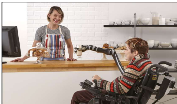
Obr. 12 Robotická paže Roboty Gen 2, která se připevňuje na invalidní vozík

Pokud se zaměříme na skutečně velice rychle se vyvíjející oblast asistivní technologie, je nutné zmínit asistenční robotické paže, které je možné připevnit na invalidní vozík. Jedním z takových zařízení je robotická paže Roboty Gen 2 od kanadské společnosti Kinova Robotics. Jedná se o lehké automatizované rameno z uhlíkových vláken, které se připojuje k jakémukoli dostupnému elektrickému invalidnímu vozíku. Bývá používán pro širokou škálu běžných činností (Geekmindset, 2022).