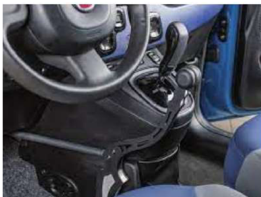
Obr. 16 Ovládání plynu a brzdy jednou pákou.