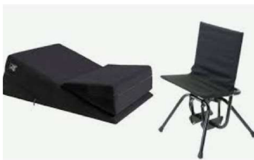
Obr. 17 Polohovací klíny a křesílko Intimaterider.

Intimaterider pomáhá párům už po několik let překonávat tělesné limity a zdravotní znevýhodnění. V pomůcce je patentovaná technologie umožňující dosažení širšího rozsahu pohybu navzdory minimálnímu úsilí (kývavý pohyb umožňuje tlačení). To přispívá k prožití vzájemné intimní chvíle naplno. Intimaterider je dle výrobců pohodlný, snadno ovladatelný, proto neexistuje dobrý nebo špatný způsob, kterak jej používat. Vše záleží na dané dvojici. Pomůcka je vhodná pro osoby s různými zdravotními znevýhodněními a pro jedince potýkající se s obezitou (Hanková, 2016).