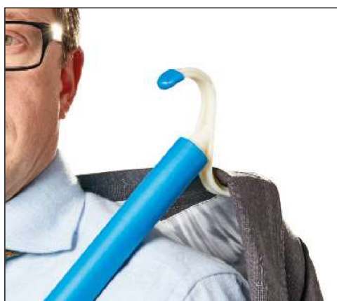
Obr. 4 Pomůcka pro oblékání