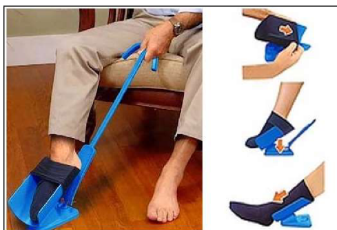
Obr. 3 Navlékač ponožek