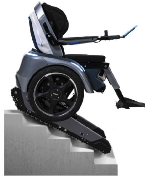
Obr. 9 Invalidní elektrický vozík Scewo BRO

byla vyvinuta elektrická pohonná jednotka invalidního vozíku schopná stoupat po schodech a pohybovat se po rovném terénu. I tato studie má však určitá omezení, zejména pokud jde o spolehlivost invalidního vozíku při chůzi po schodech. Nebezpečnost vzniká mechanickým pohonem bez elektronického ovládání. Další výzkum bude zaměřen na bezpečnější stoupání a sestupování po schodech pomocí metod elektronického ovládání (Lee a kol., 2021).