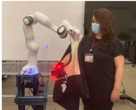
Obr. 13 Robotická paže od společnosti MIT CSAIL

testovacích případech, čímž potvrdil svou vhodnost pro běžné využití u osob s tělesným postižením (Emu, 2023).