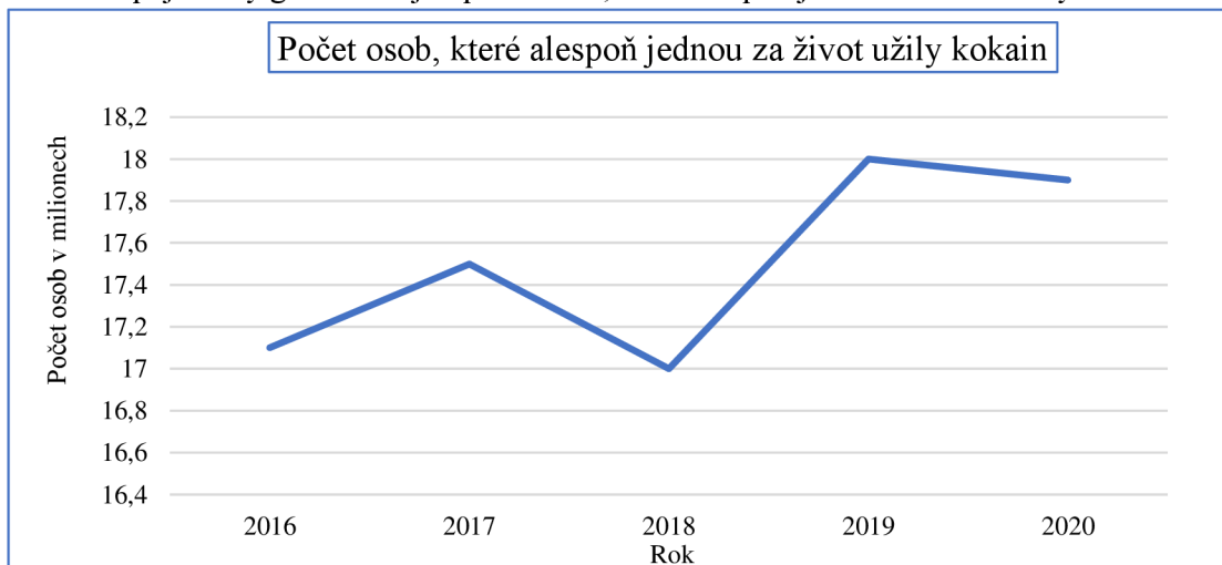
Graf 1: Spojnicový graf ilustrující počet osob, které alespoň jednou v životě užily kokain

Dle dat získaných a zpracovaných Evropským monitorovacím centrem pro drogy a drogovou závislost (EMCDDA) se počet uživatelů kokainu v Evropské unii zvyšuje. Přibývá nejen těch, kteří ho užili alespoň jednou za život, ale také osob, které ho konzumovaly v posledním roce. Situaci posledních pěti let popisují graf 1 a graf 2 (EMCDDA, 2020), (EMCDDA, 2019), (EMCDDA, 2018), (EMCDDA, 2017), (EMCDDA, 2016).