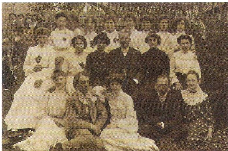
Ženský pěvecký sbor 1904 – 1908.