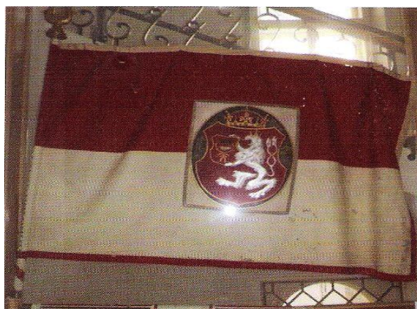
Prapor spolku je v současnosti uložen a vystaven v Muzeu na Horním náměstí v Humpolci.

Žerď je pobita stříbrnými hřebíky a pentle byly vyšité zlatem a hedvábím.