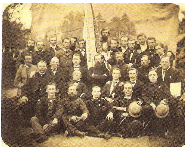
První společná fotografie spolku z 30. srpna 1863 při slavnostním svěcením praporu.