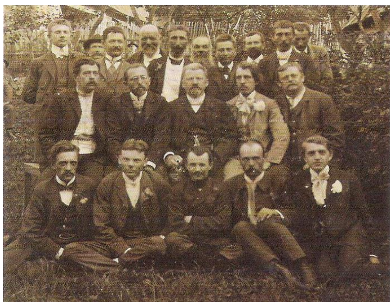
Mužský pěvecký sbor 1904 – 1908.