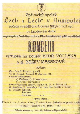
Pozvánky na koncert.