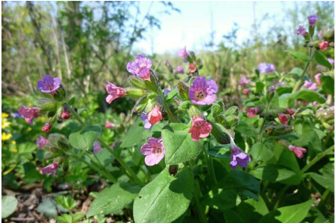
Obr. 40: plicník lékařský (21. 4. 2018)