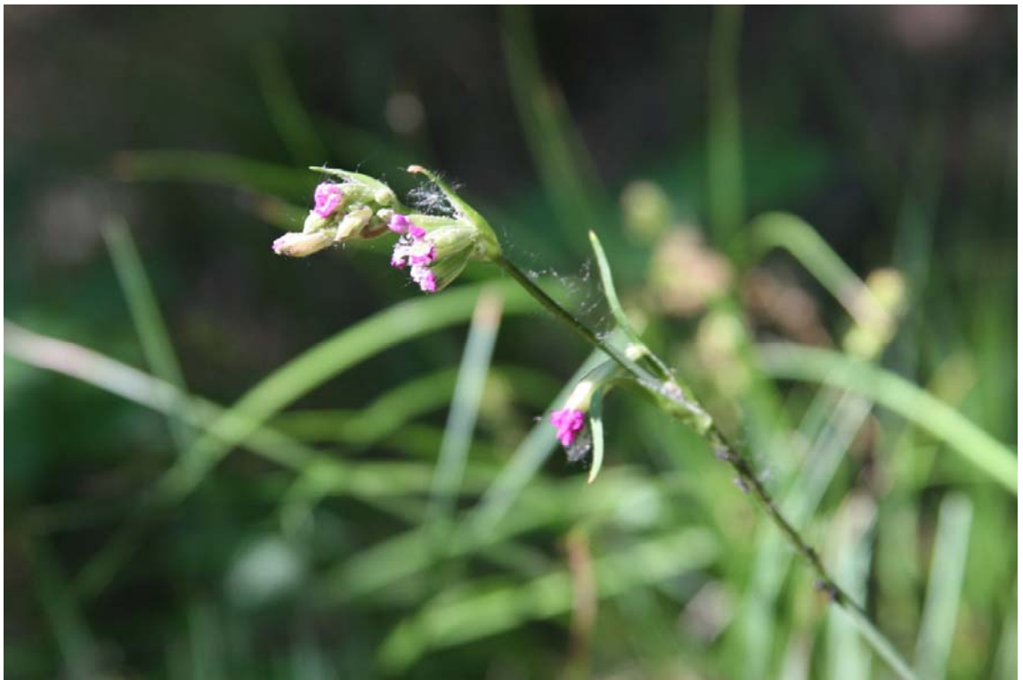
Obr. 38: smolníčka obecná (14. 5. 2018)