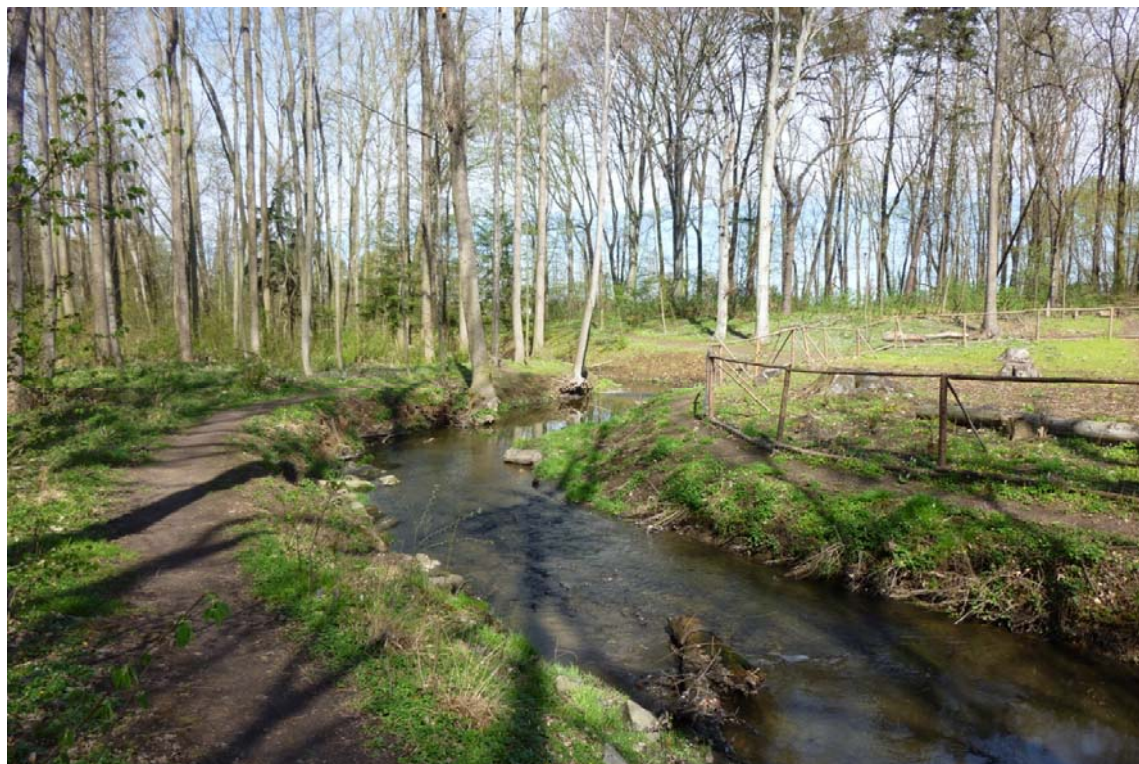
Obr. 15: nezpevněná cesta podél Říčanky (14. 4. 2018)