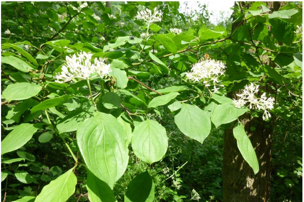
Obr. 45: svída krvavá (24. 5. 2018)