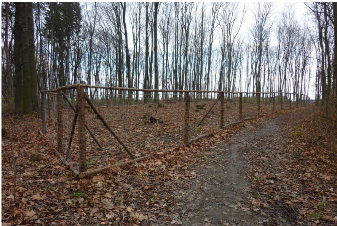
Obr. 29: seč v lokalitě 1, nad svahem (3. 12. 2017)