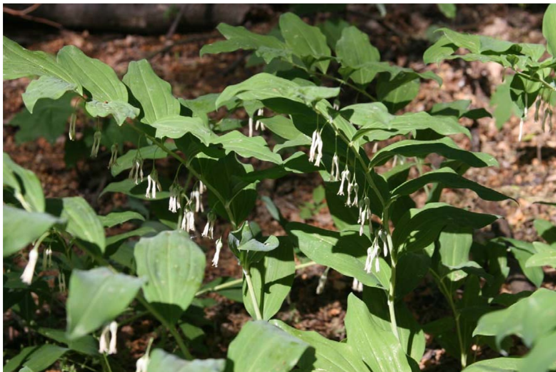
Obr. 48: kokořík mnohokvětý (14. 5. 2018)