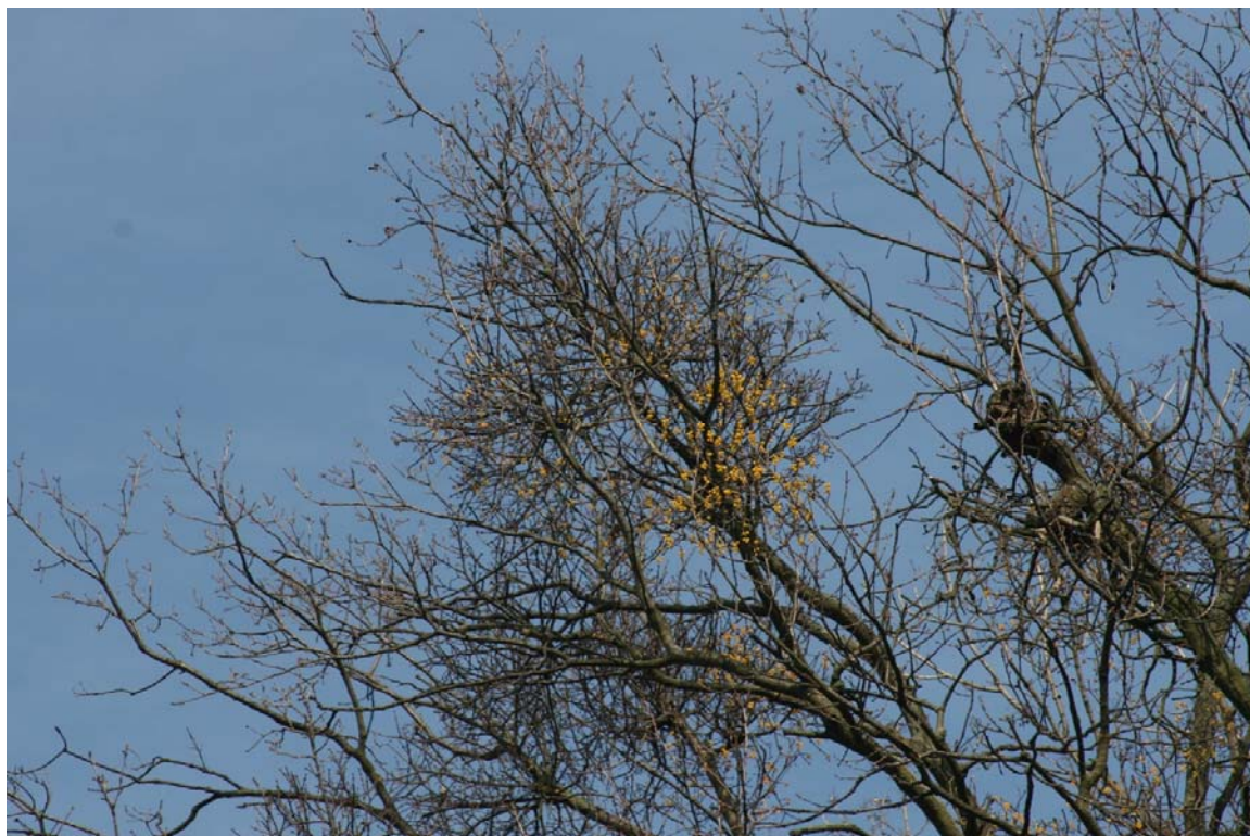
Obr. 52: ochmet evropský (17. 3. 2019)