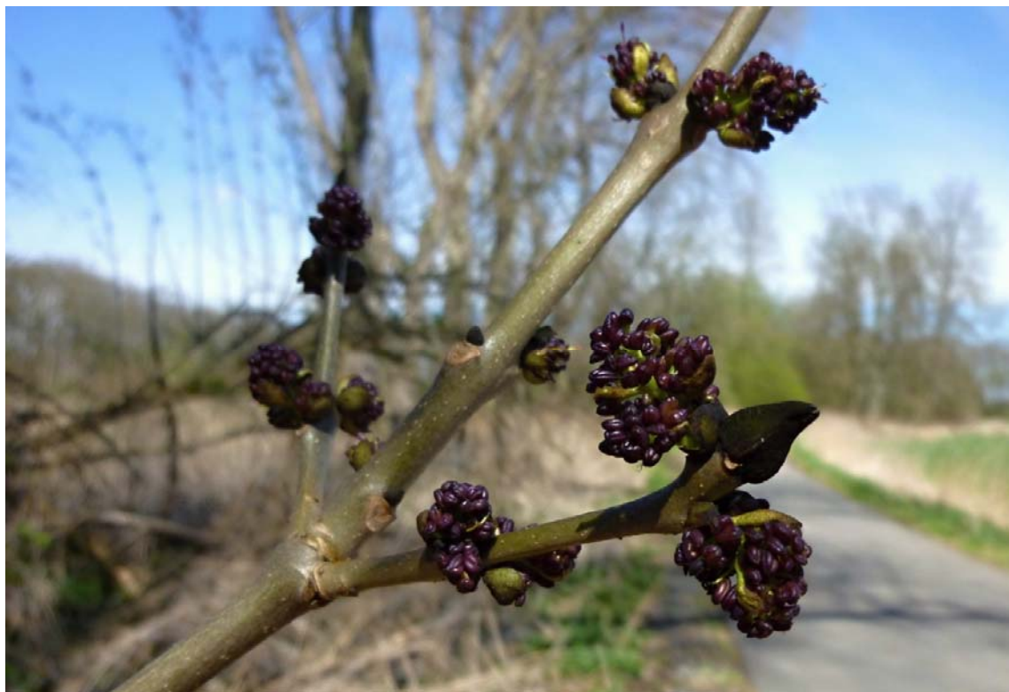
Obr. 55: jasan ztepilý – květ (14. 4. 2018)