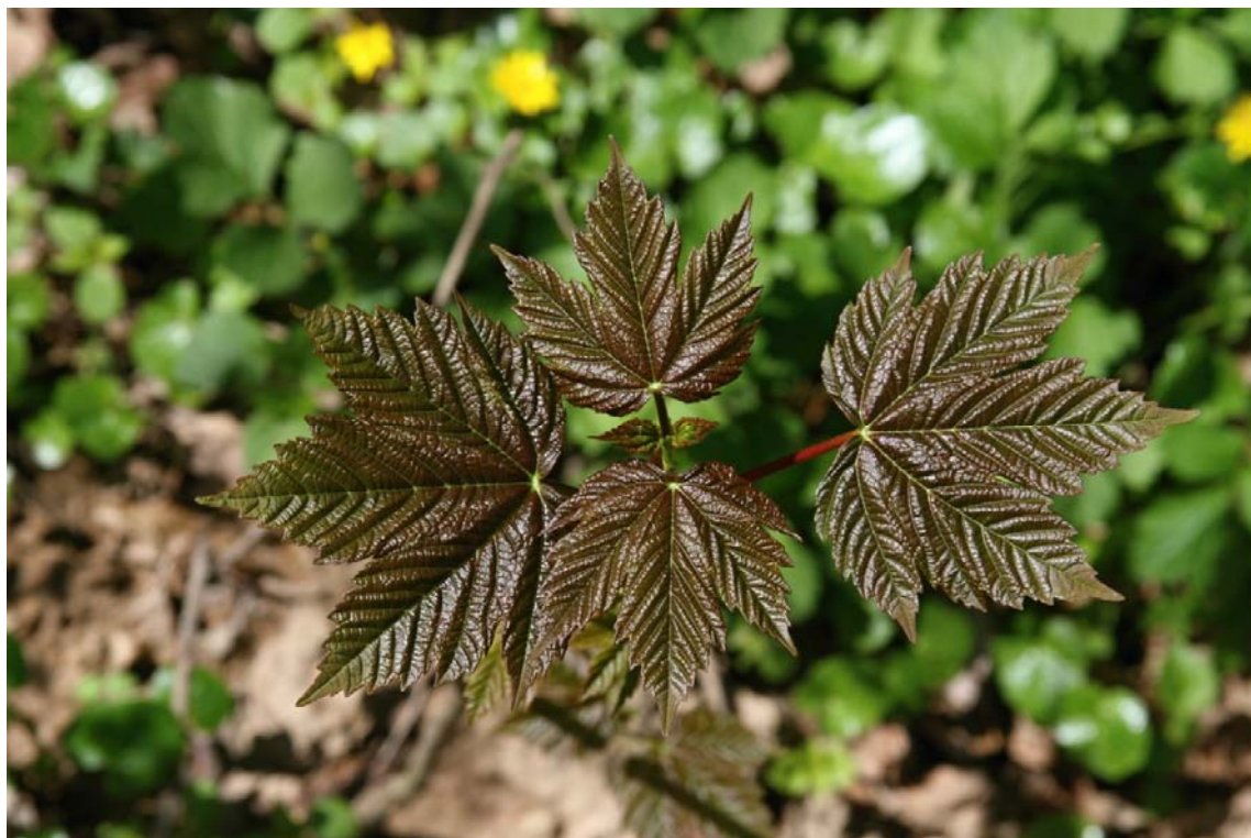
Obr. 54: javor mlč – semenáček (21. 4. 2018)