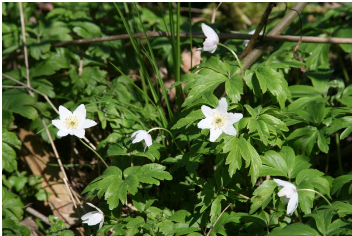
Obr. 35: sasanka hajní (21. 4. 2018)