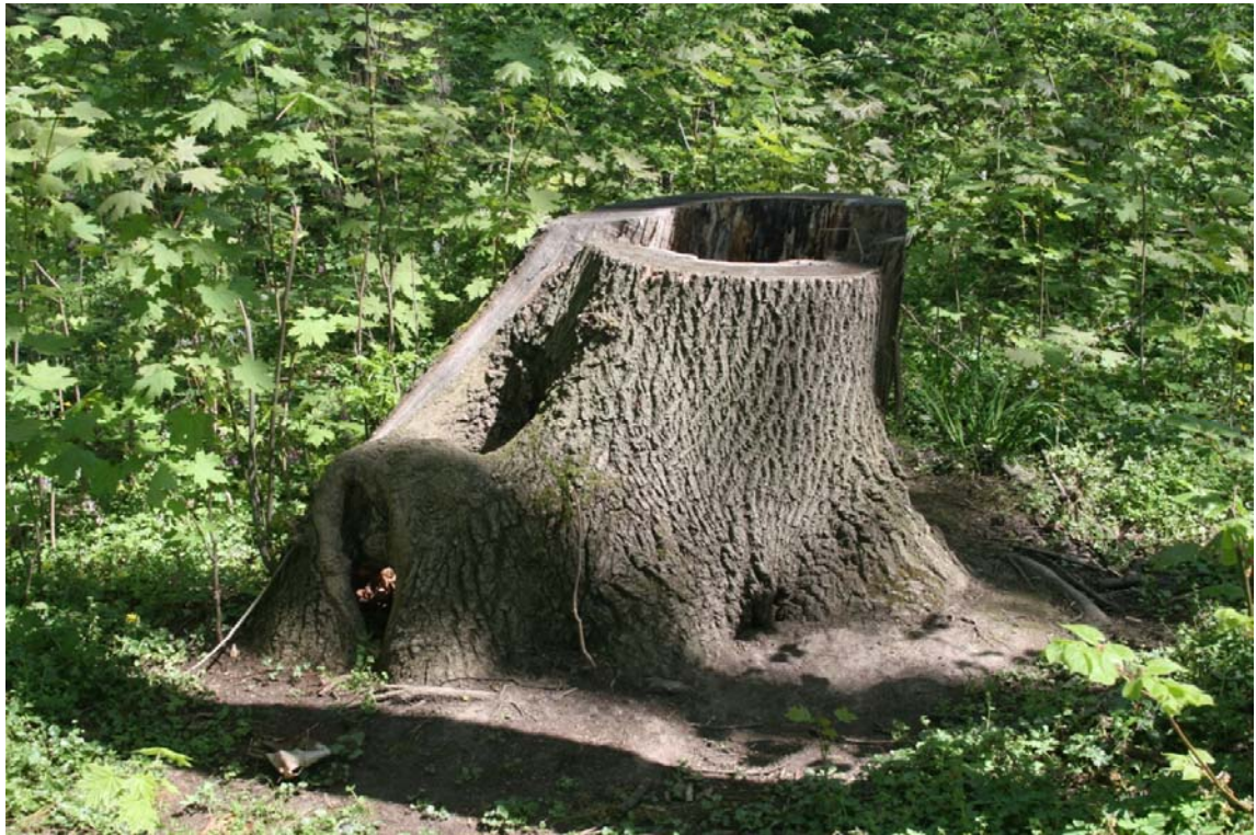
Obr. 32: lokalita 2 (21. 4. 2018)