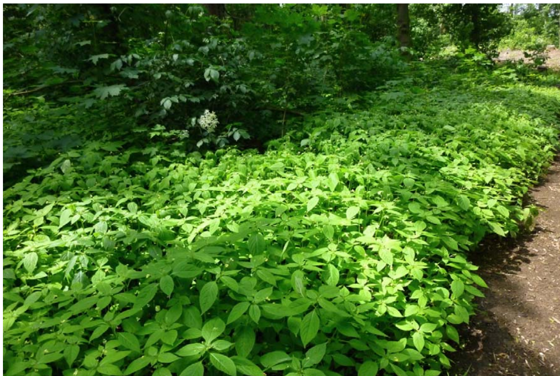
Obr. 50: netýkavka malokvětá (24. 5. 2018)