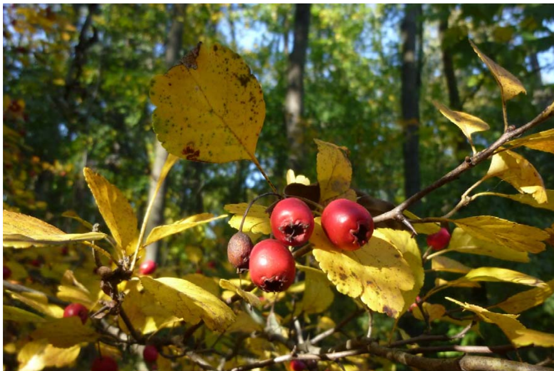
Obr. 56: hloh obecný (11. 10. 2018)