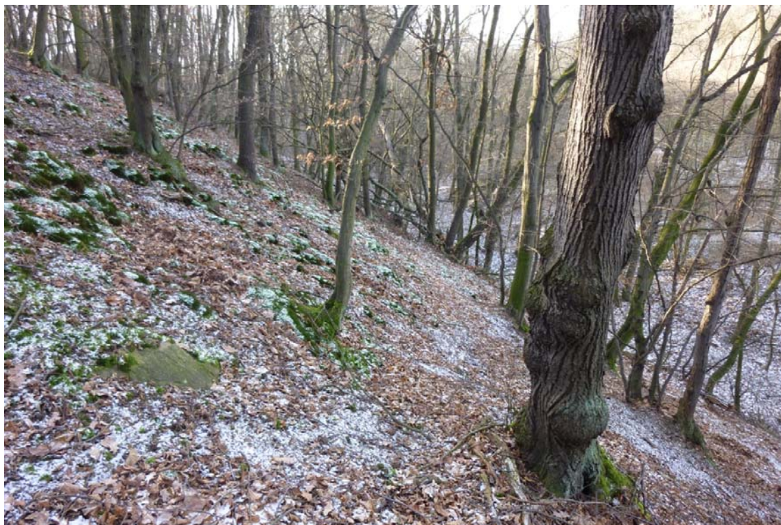
Obr. 1: zima (10. 12. 2017)