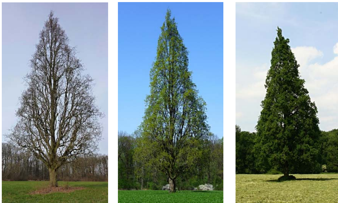
Obr. 7, 8, 9: (10. 12. 2017, 14. 4. 2018, 24. 5. 2018)