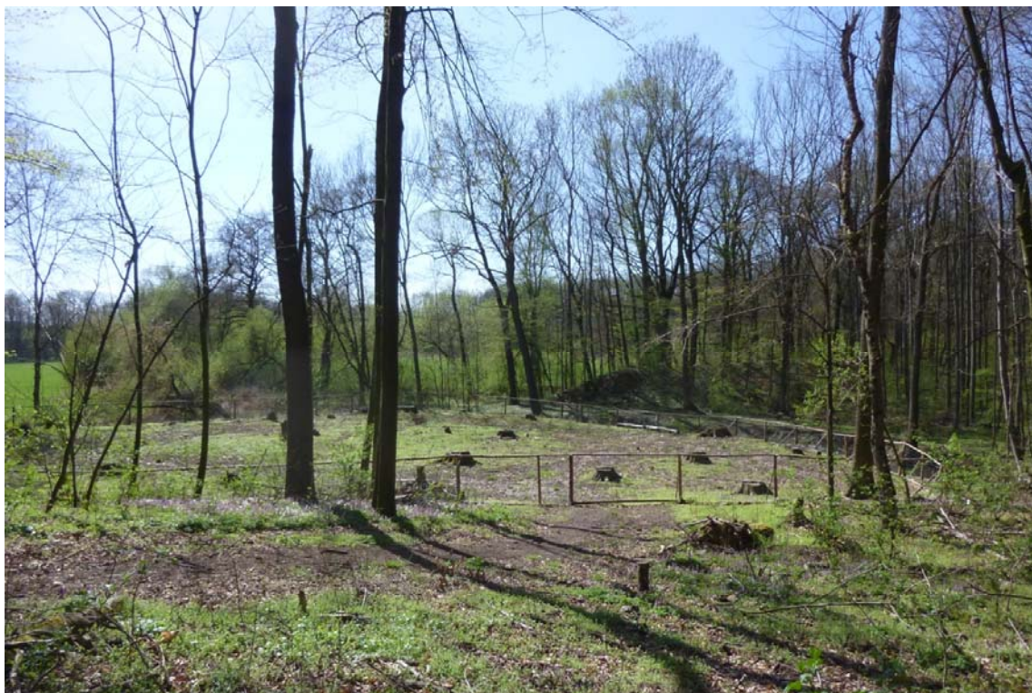
Obr. 28: seč v lokalitě 2 v místě původního výskytu akátů (14. 4. 2018)