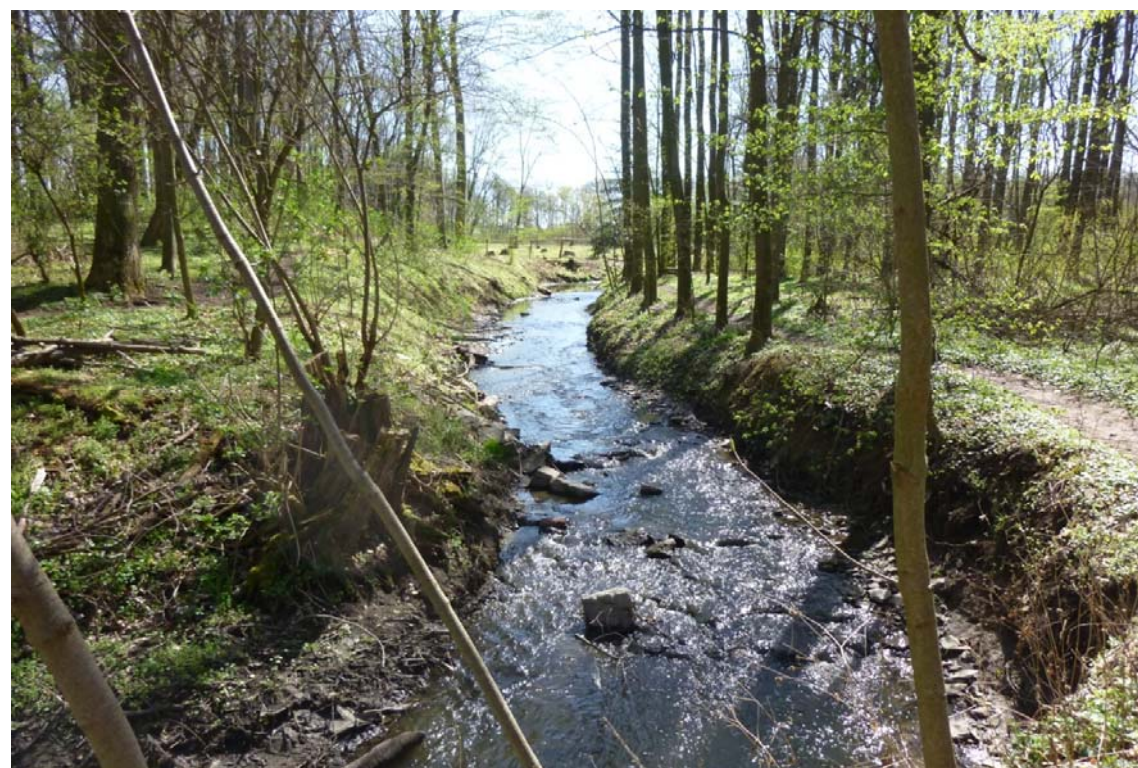
Obr. 6: jaro (14. 4. 2018)