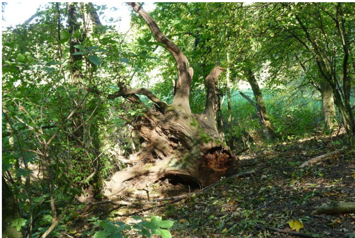
Obr. 30: dřevo ponechané ke ztrouchnivění v lokalitě 1 (11. 10. 2018)