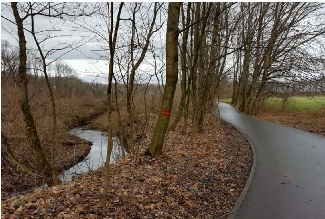
Obr. 14: u potoka, vpravo vzadu pole – potenciální extenzivní louka (23. 12. 2018)