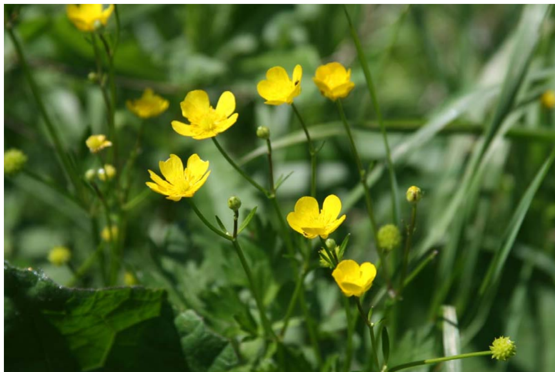
Obr. 47: pryskyřník prudký (21. 5. 2018)