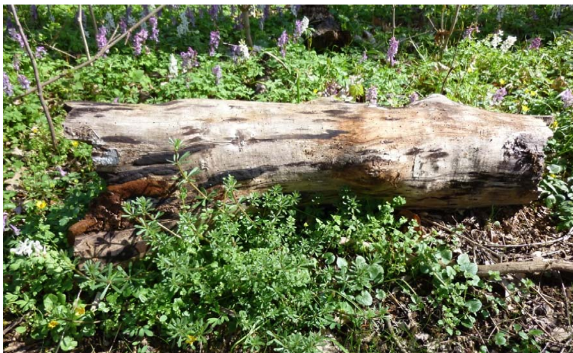
Obr. 31: dřevo ponechané ke ztrouchnivění v lokalitě 1 (14. 4. 2018)