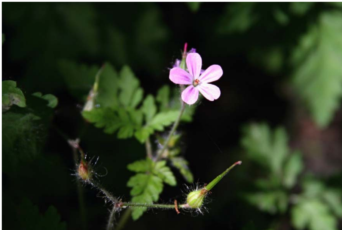
Obr. 43: kakost smrdutý (21. 5. 2018)