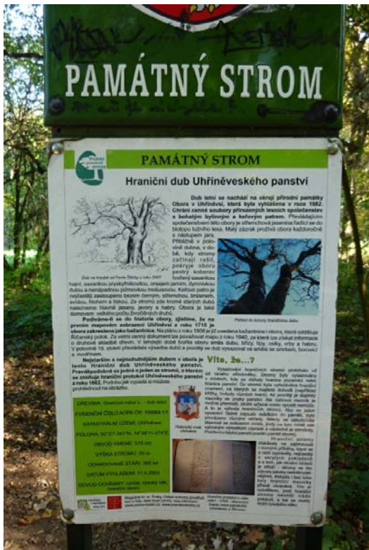
Obr. 24: tabule u „Krále dubů“ (11. 10. 2018)