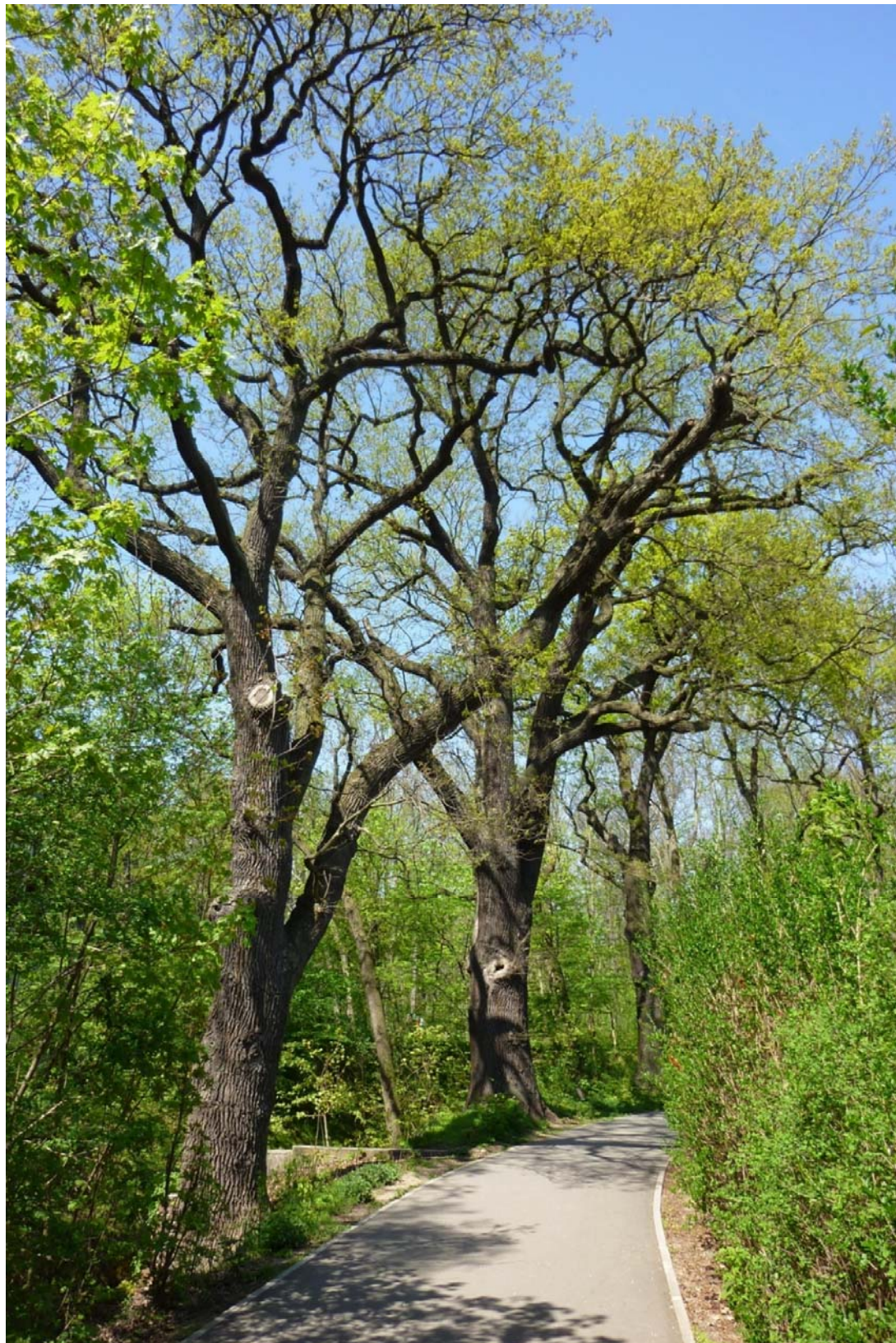
Obr. 17: památné duby na břehu potoka (21. 4. 2018)