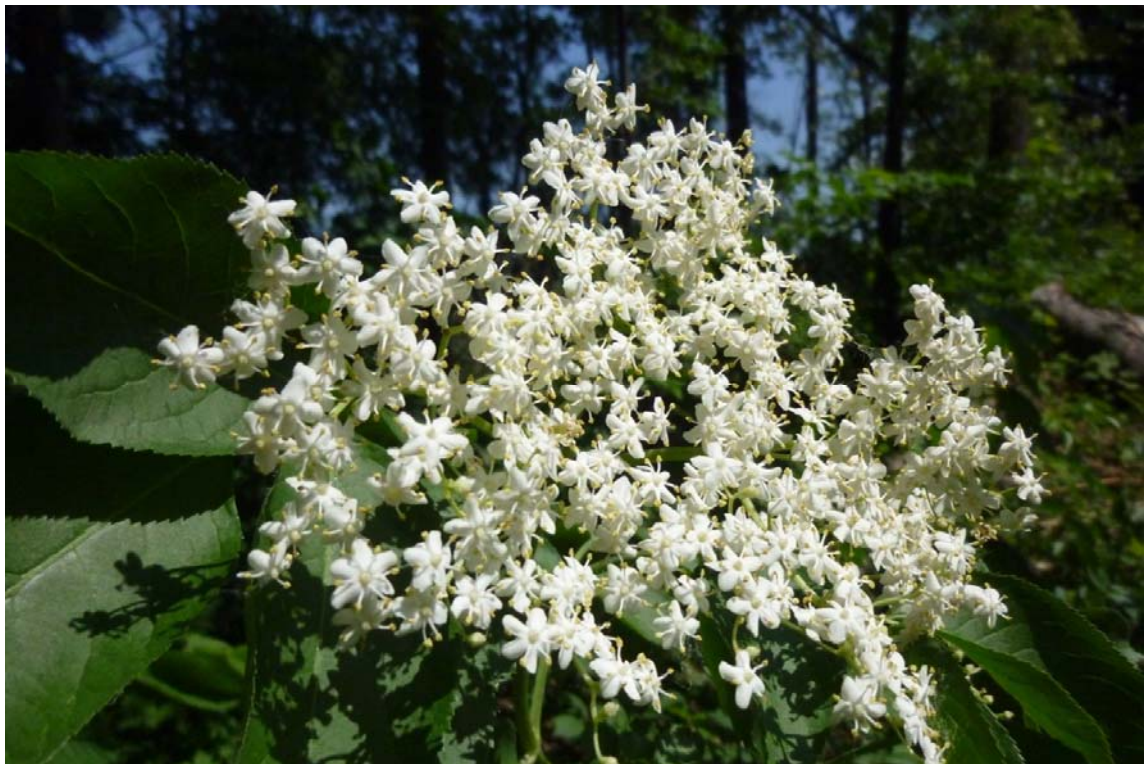
Obr. 41: bez černý (21. 5. 2018)