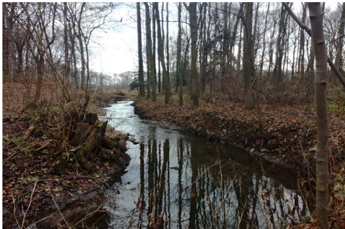
Obr. 5: zima (3. 12. 2017)