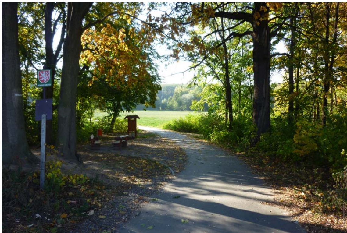
Obr. 11: vstup do Obory z východní strany (11. 10. 2018)