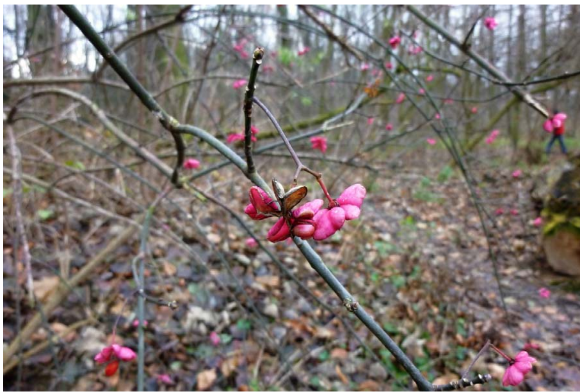
Obr. 56: brslen evropský (3. 12. 2017)