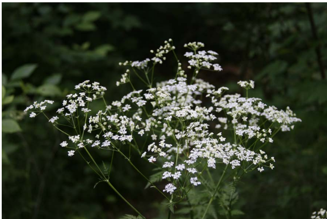
Obr. 49: kerblík lesní (21. 5. 2018)