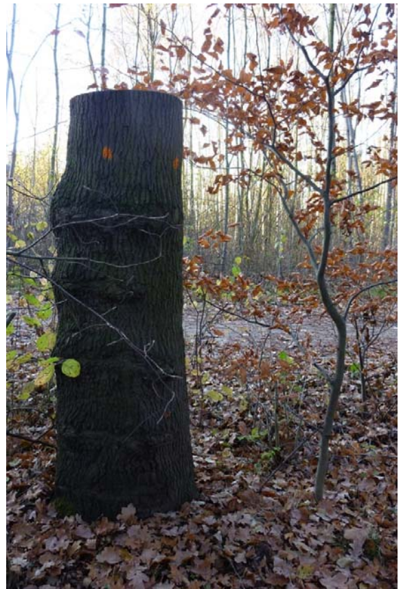
Obr. 33: vysoké pařezy – západní okraj (3. 12. 2017) Obr. 34: (15. 11. 2018)