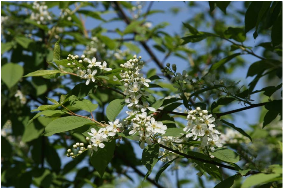
Obr. 44: střemcha obecná (21. 4. 2018)