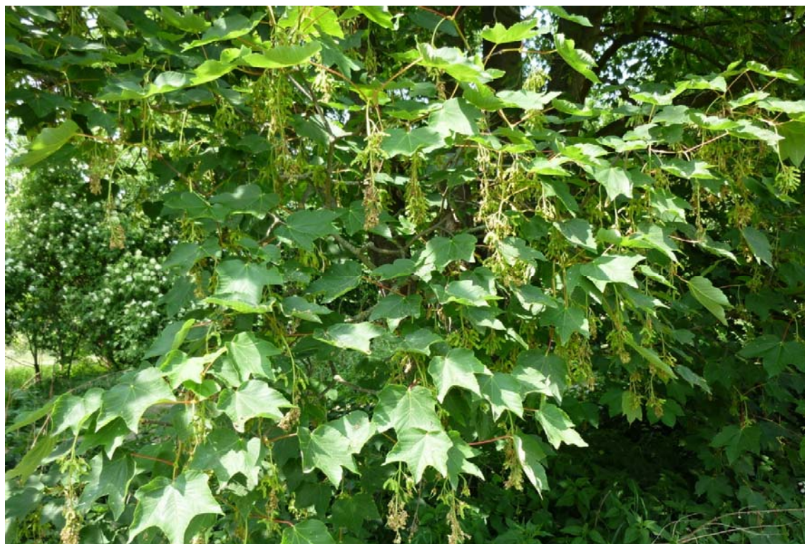
Obr. 51: javor babyka (24. 5. 2018)