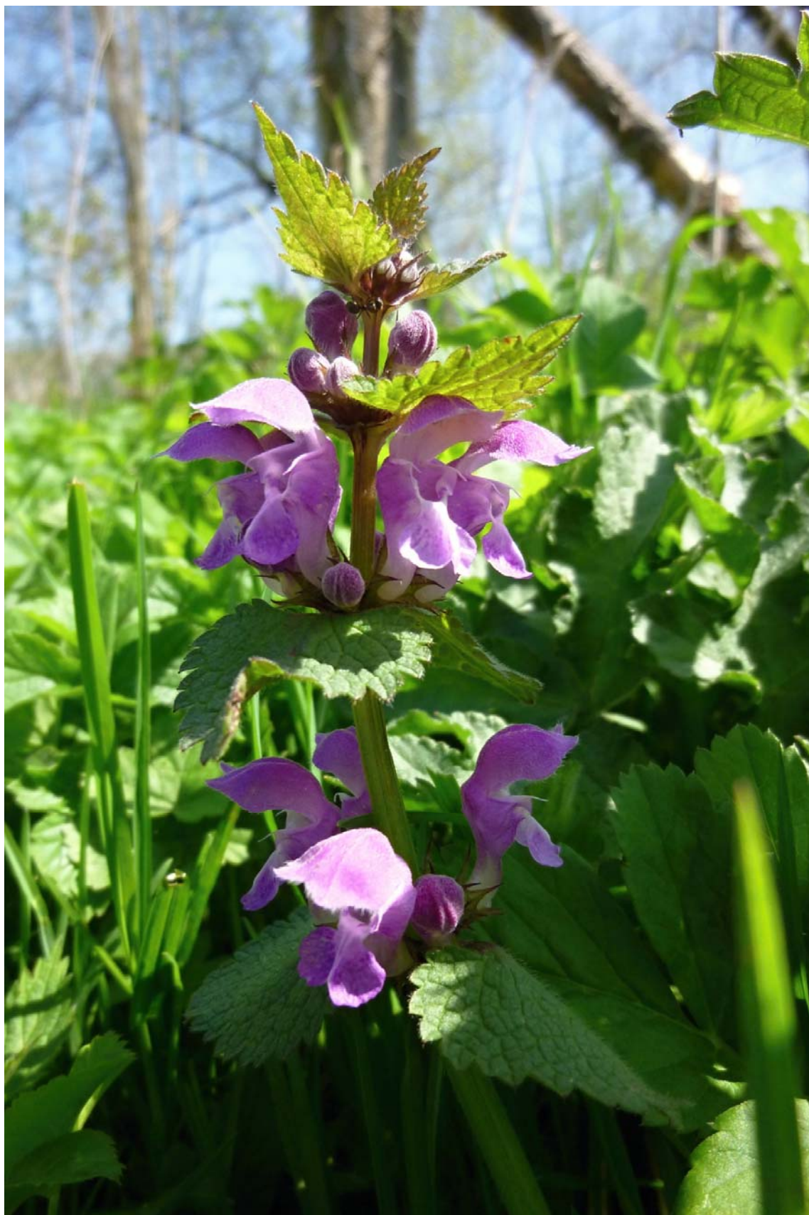
Obr. 39: hluchavka skvrnitá (21. 4. 2018)