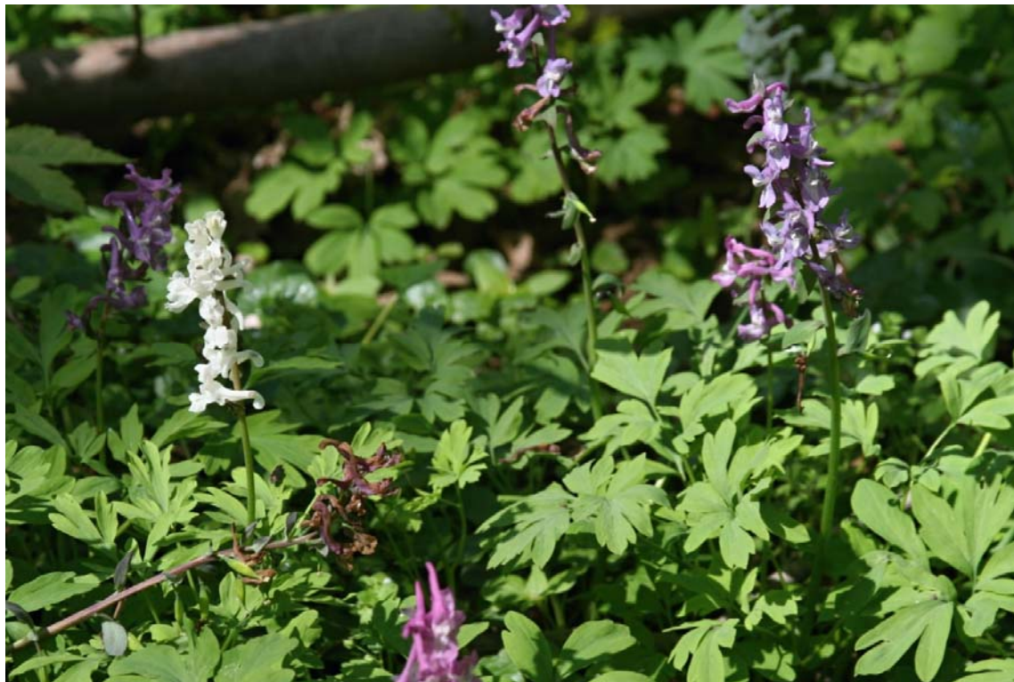
Obr. 42: dymnivka dutá (21. 4. 2018)