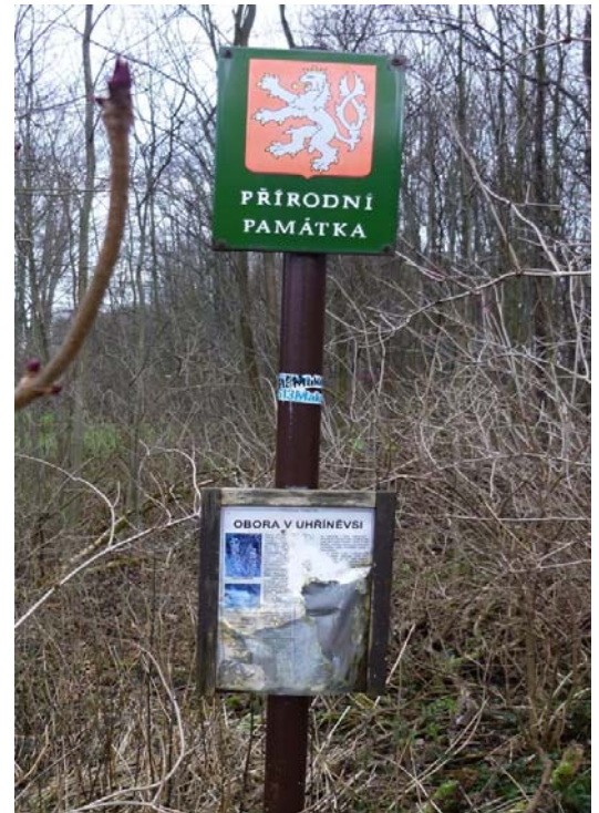
Obr. 23: vstup od západu (3. 12. 2017)