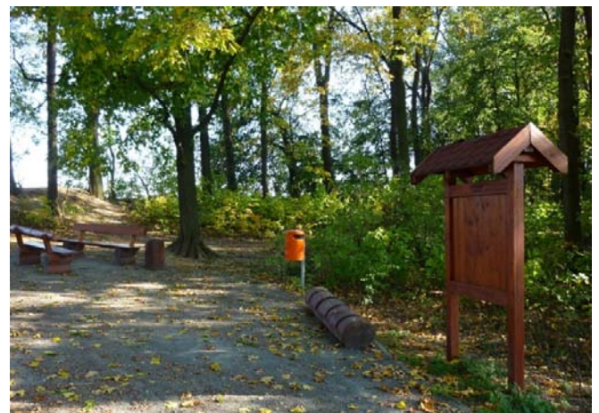
Obr. 25: posezení a informační panel u východního vstupu od Obory (11. 10. 2018)