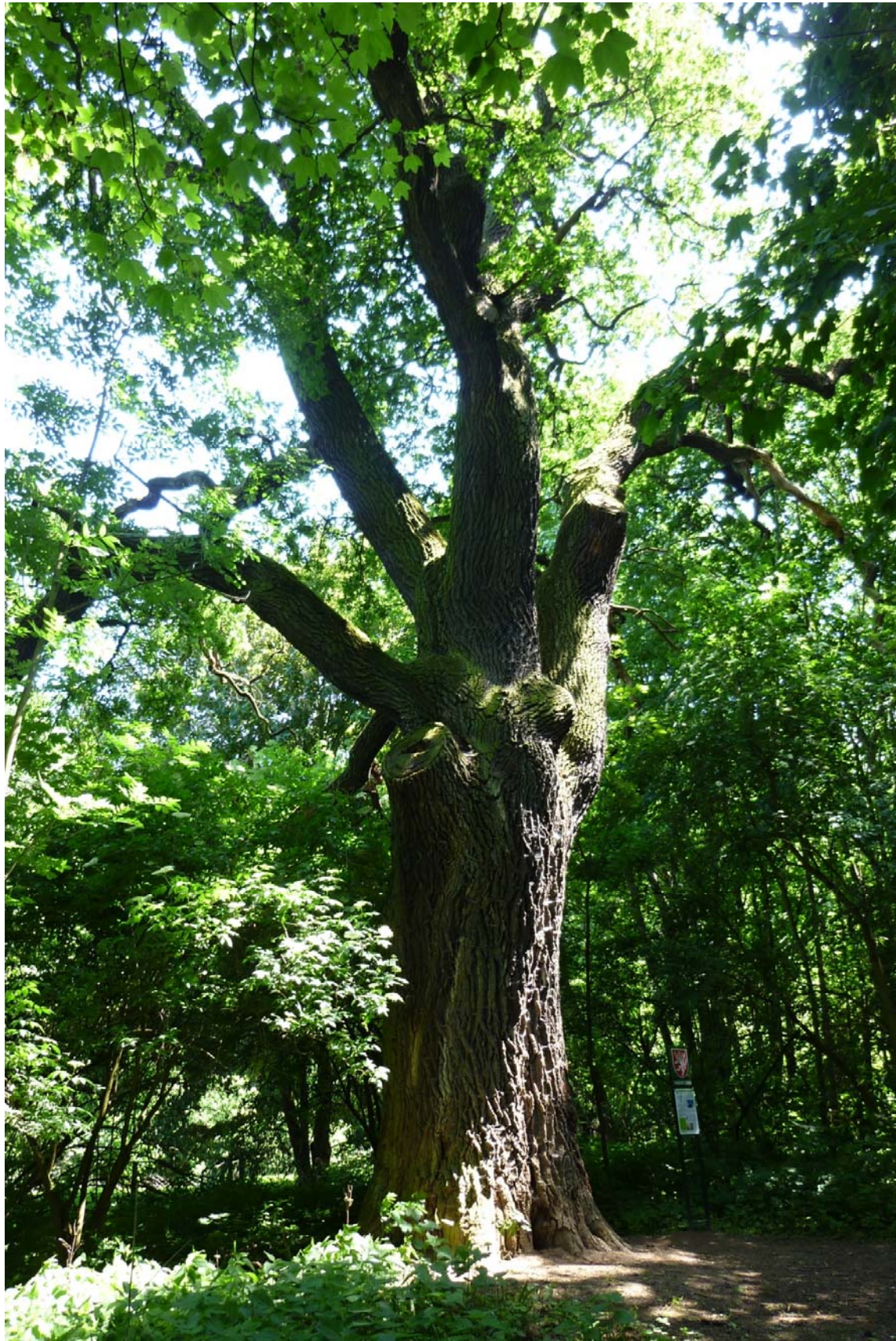
Obr. 21: „Král dubů“ (21. 5. 2018)