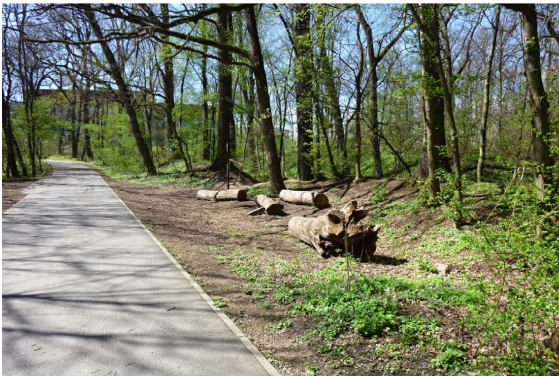
Obr. 13: nad lávkou (14. 4. 2018)