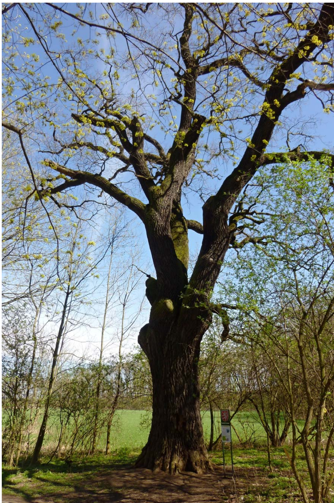
Obr. 20: „Král dubů“ (14. 4. 2018)