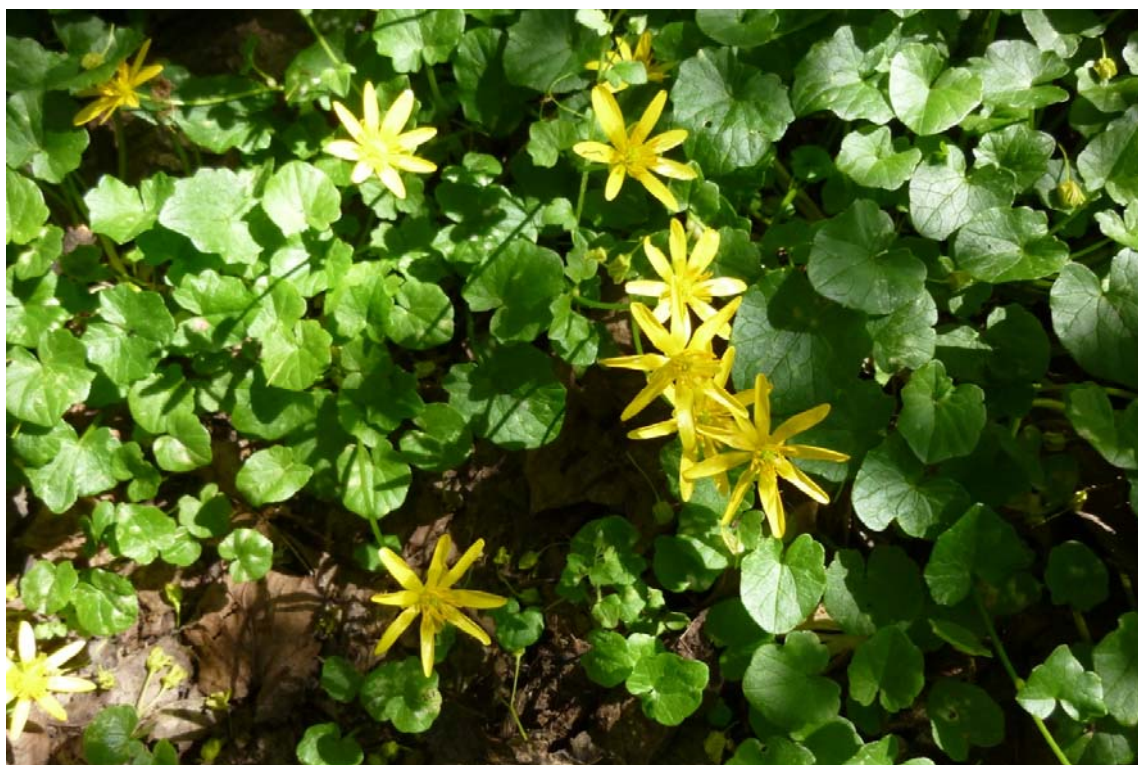
Obr. 36: orsej jarní (21. 4. 2018)