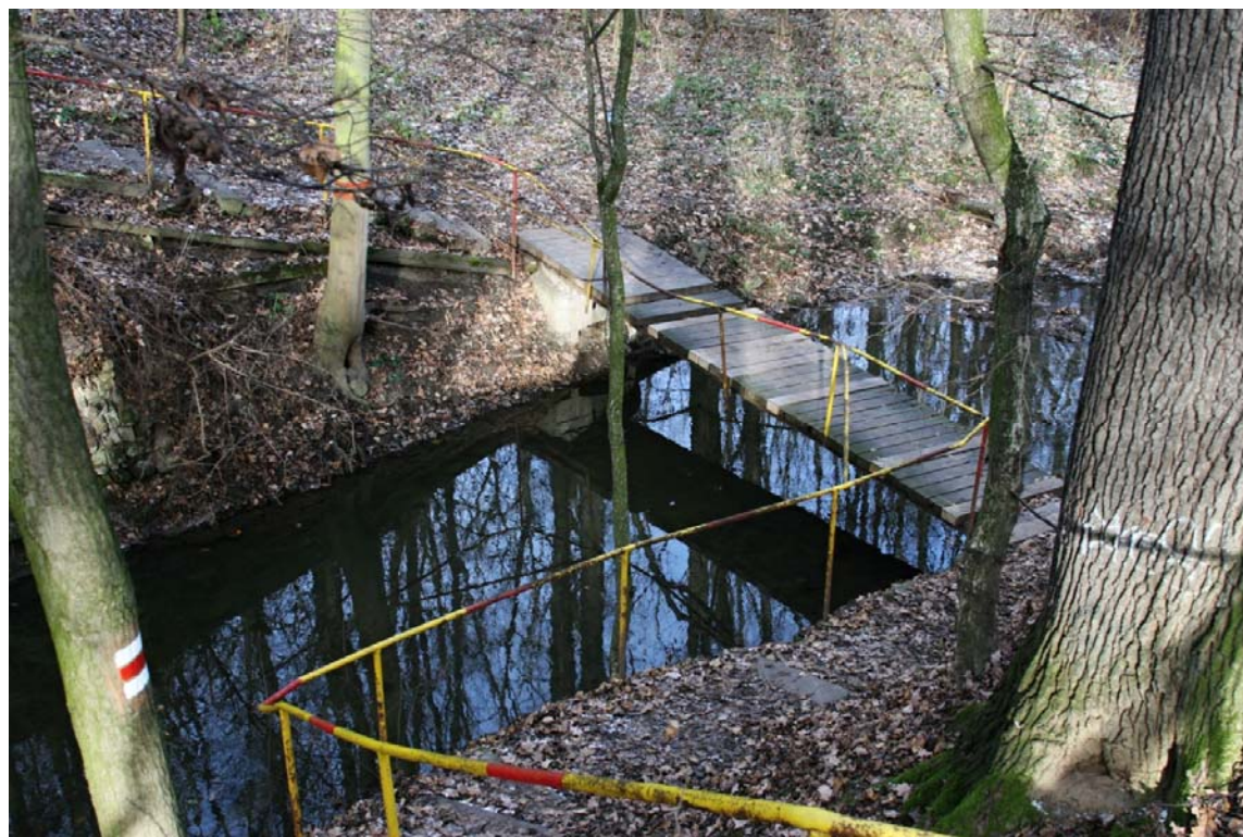
Obr. 12: lávka přes Říčanku (20. 1. 2018)