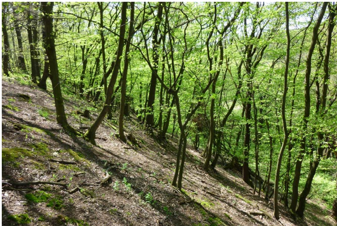
Obr. 2: jaro (21. 4. 2018)