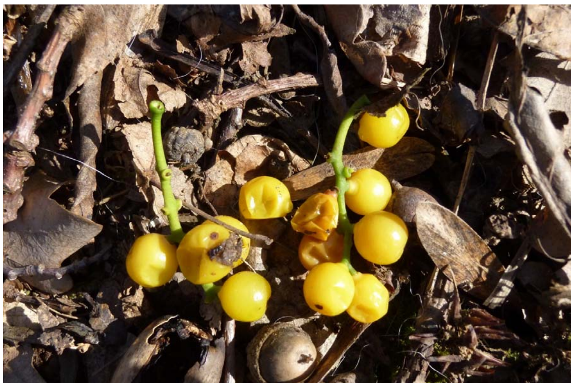
Obr. 53: ochmet evropský – plod (17. 3. 2019)