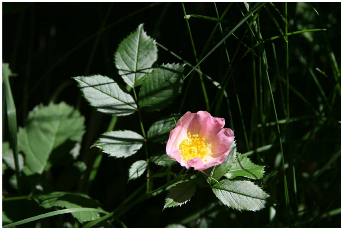
Obr. 46: růže šípková (21. 5. 2018)