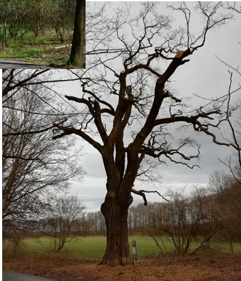
Obr. 27: „Král dubů“ po zásahu (23. 12. 2018)