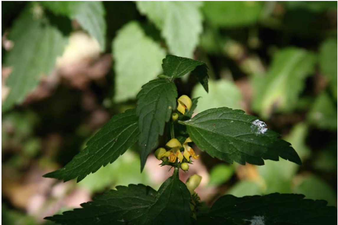
Obr. 37: pitulník žlutý (21. 4. 2018)