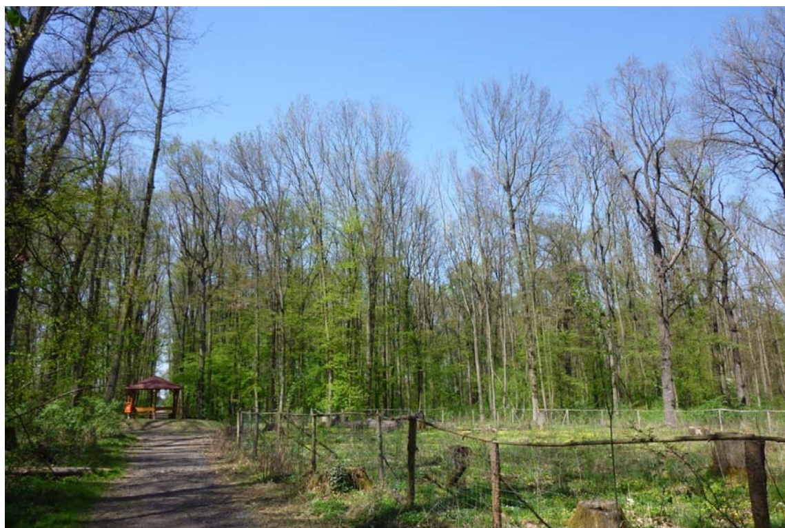
Obr. 16: cesta k altánu ve středu Obory (21. 4. 2018)