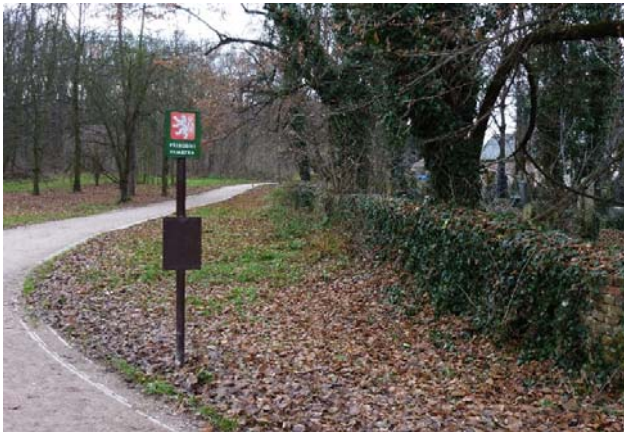
Obr. 22: u židovského hřbitova (3. 12. 2017)