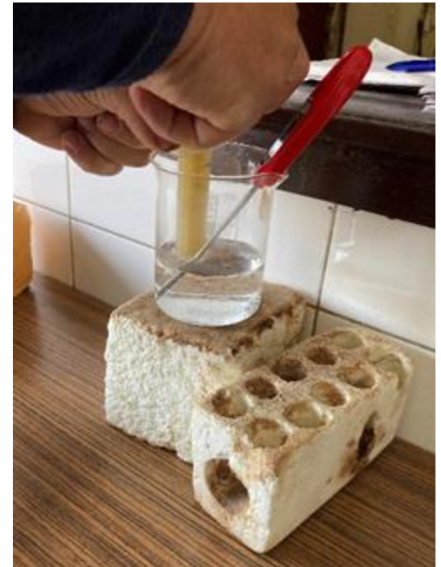
Příloha 7. Příprava ředidla spermatu (Autor: Cihlářová 2022) Příloha. 8. Ředění spermatu (Autor: Cihlářová 2022)