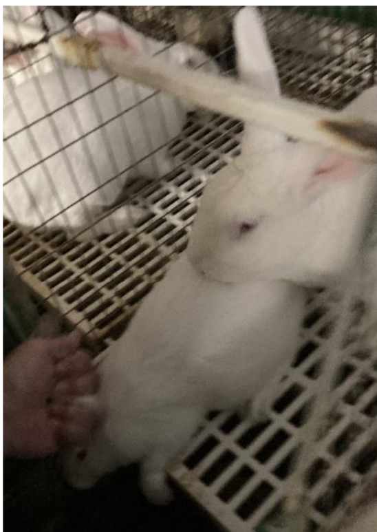
Příloha 5. Odběr semene pomocí samce prubíře (Autor: Cihlářová 2022)