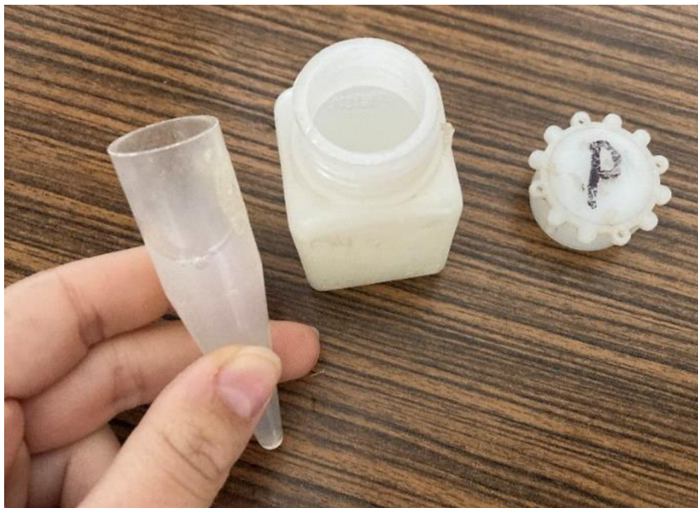
Příloha 9. Přelívání zředěného spermatu do směsné inseminační dávky (Autor: Cihlářová 2022)