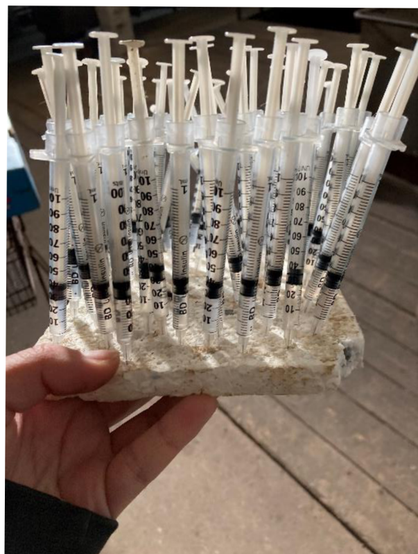
Příloha 2., 3. Hormon Supergestran, aplikovaný samicím ihned po inseminaci, sloužící k vyvolání ovulace (Autor: Cihlářová 2022)