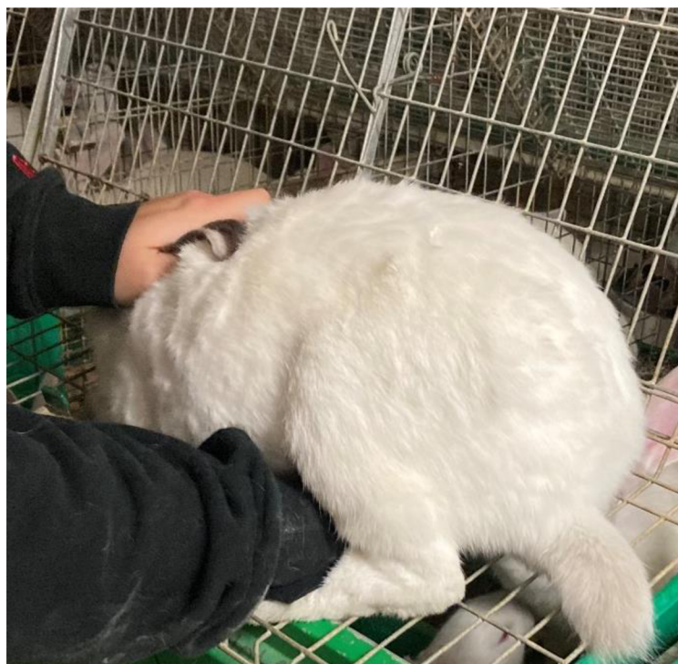
Příloha 16. Kontrola březosti prováděná pomocí palpace (Autor: Cihlářová 2022)