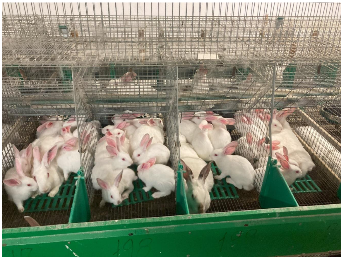
Příloha 26. Králíčata ve věku 35 dní, tedy před odstavem.