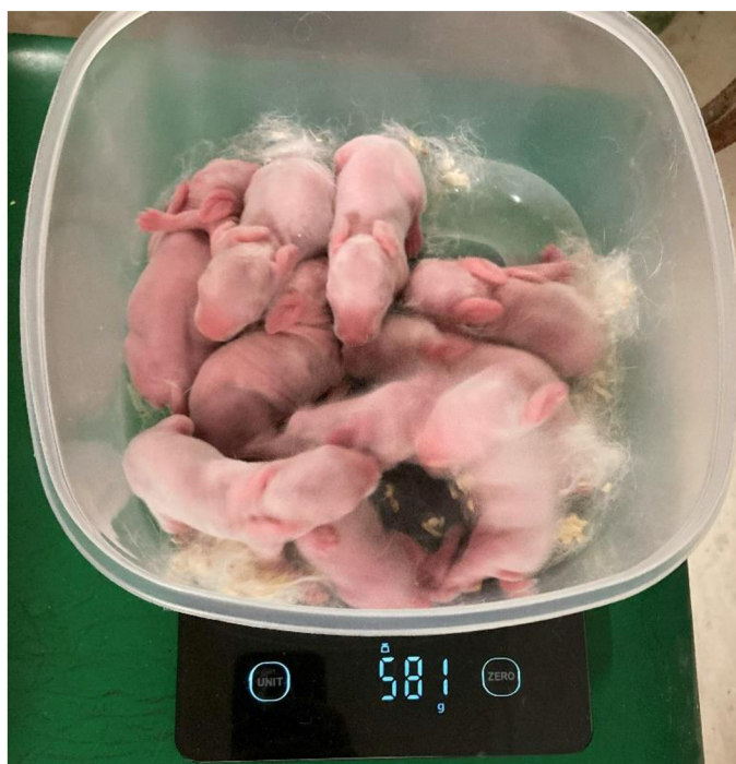
OPříloha 22. Vážení vrhu králičat v 2. dni věku (Cihlářová 2023)