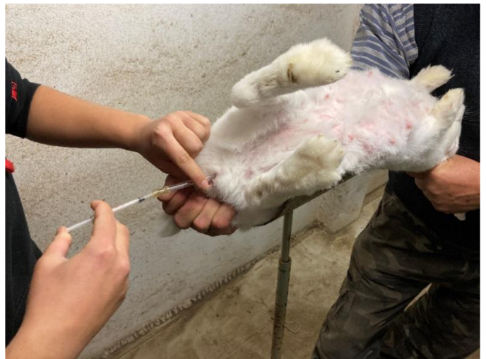
Příloha 15. Vlastní inseminace