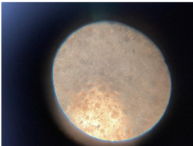
Příloha 10. Hodnocení inseminační dávky pod mikroskopem (Autor: Cihlářová 2022)