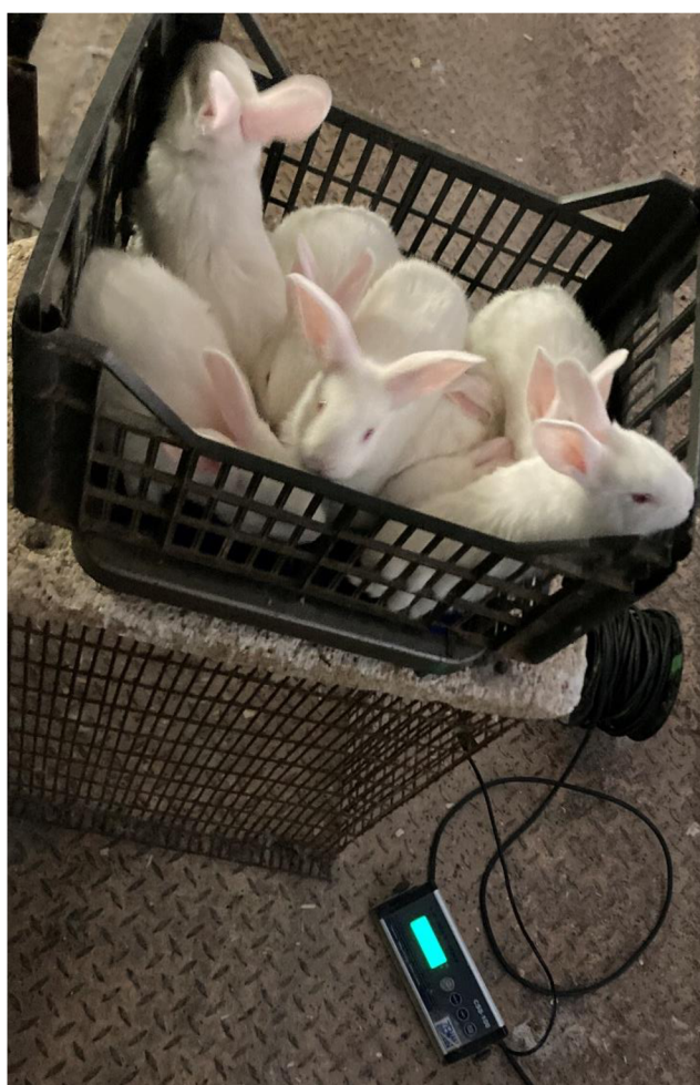
Příloha 23. Vážení vrhu králičat ve 21. dni věku (Cihlářová 2023)