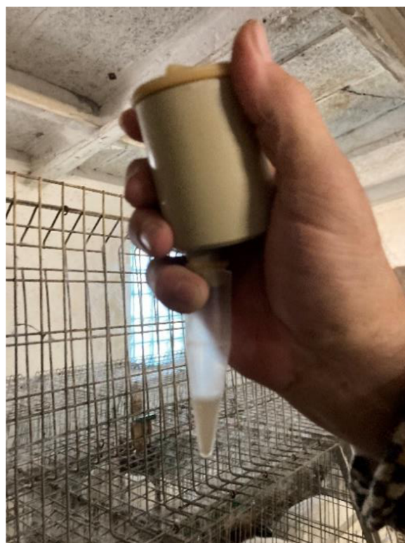
Příloha 6. Odebrané semeno ve sběrné zkumavce