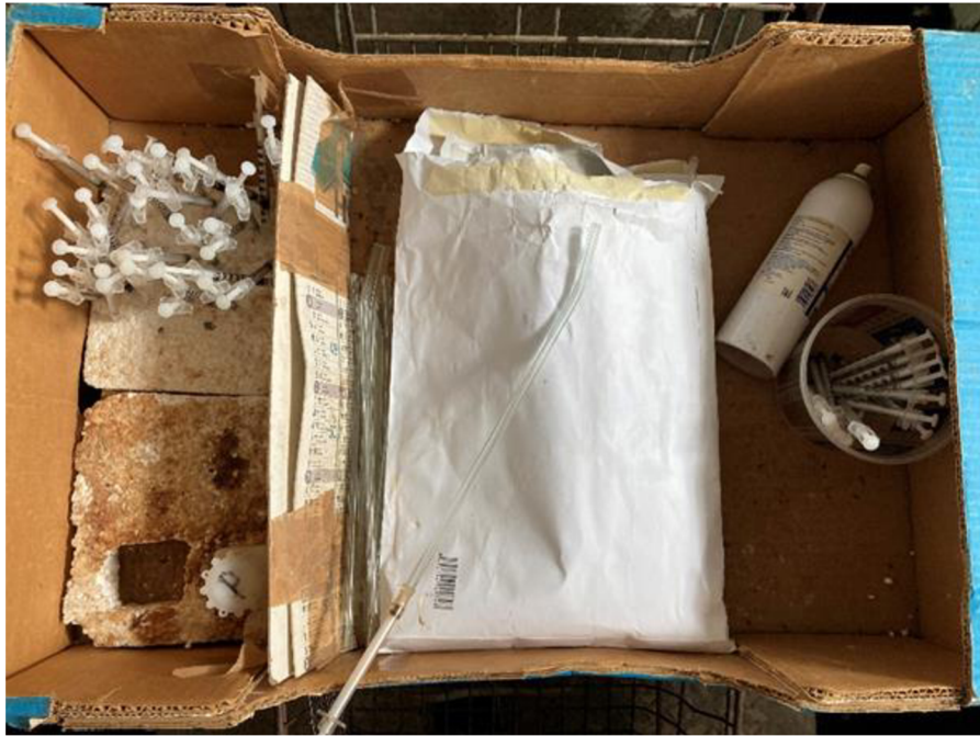
Příloha 13. Pomůcky nutné k inseminaci