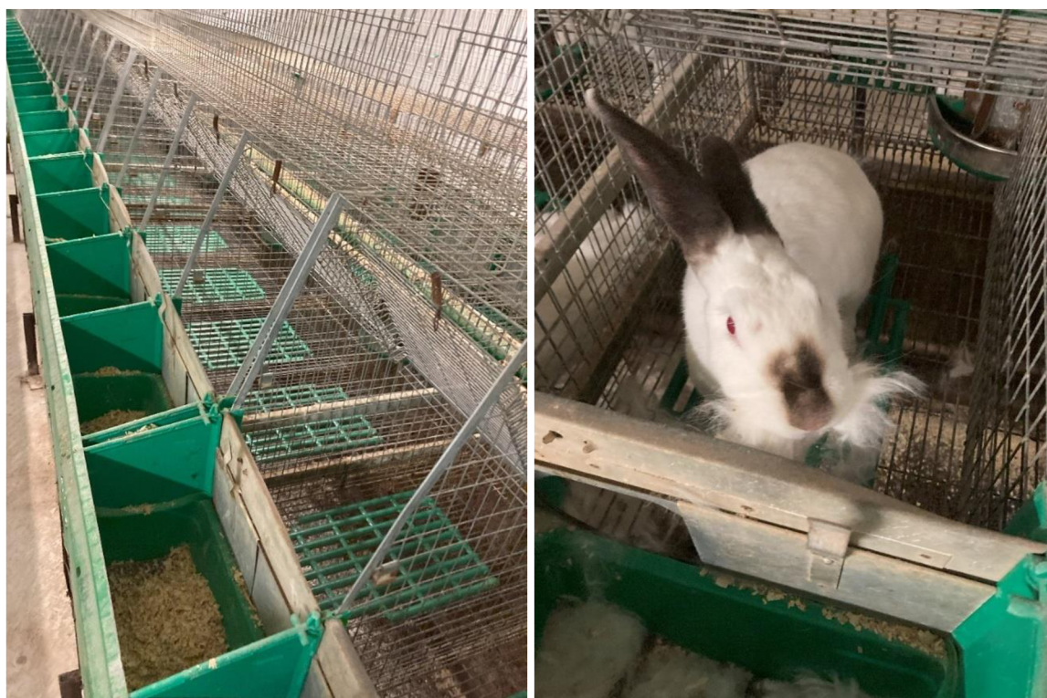
Příloha 17. Příprava porodních hnízd na kocení