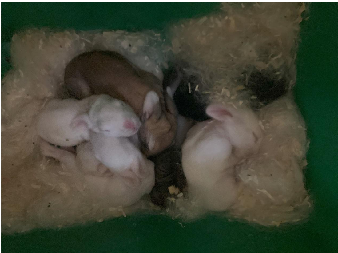
Příloha 25. Králíčata v hnízdě 6. den po porodu (Cihlářová 2023)