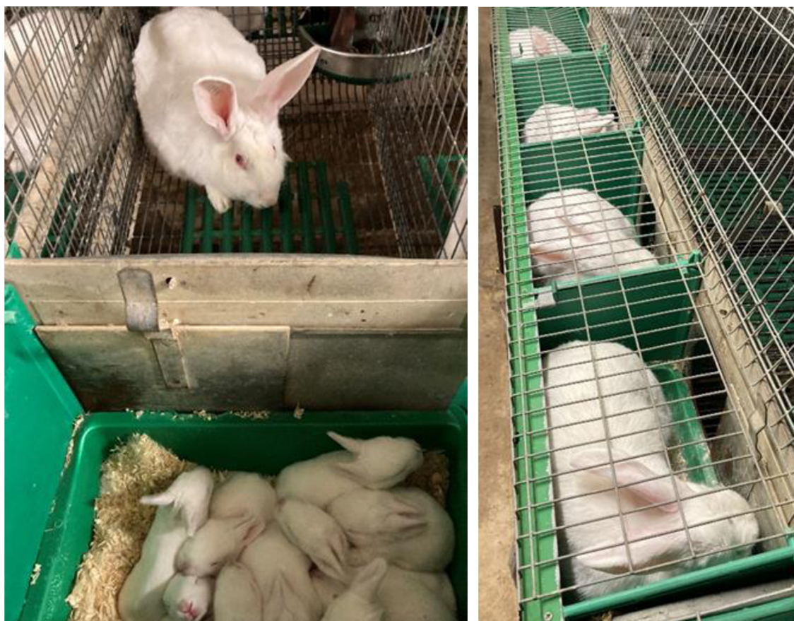
Příloha 11., 12. Řízená laktace k vyvolání lepší sexuální vnímavosti (Autor: Cihlářová 2022)