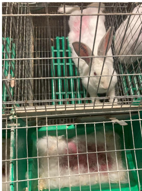
Příloha 19., 20. Samice v době po porodu