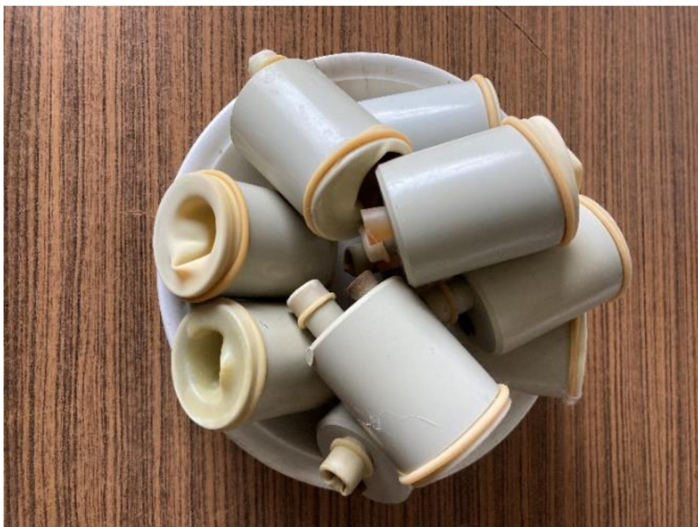
Příloha 4. Umělé vagíny používané při odběru spermatu