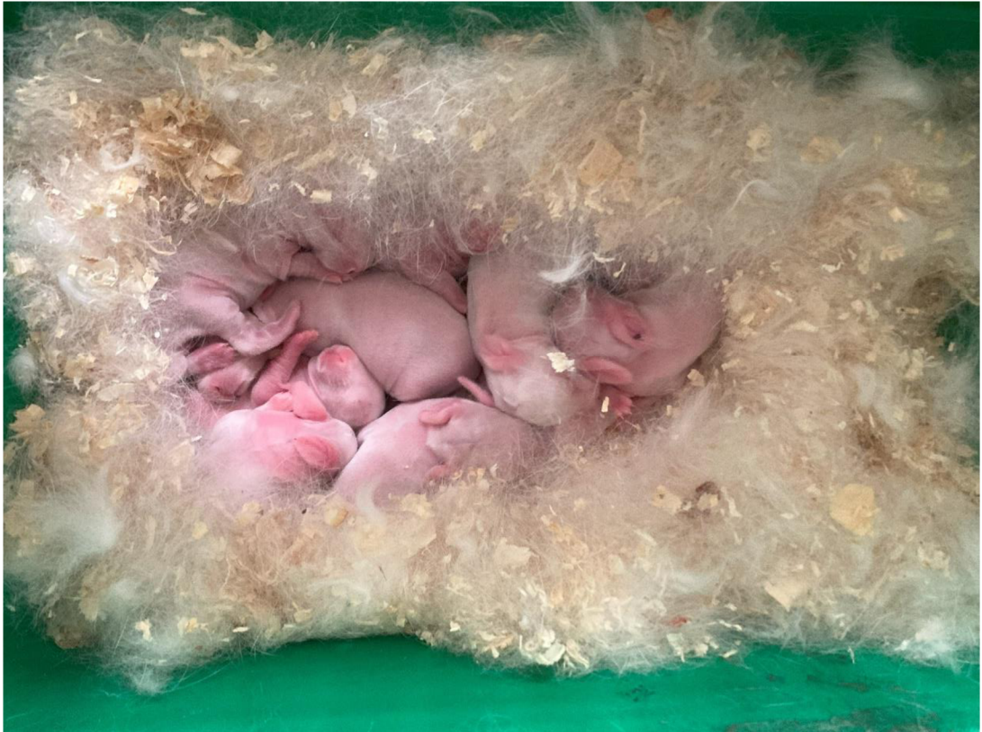
Příloha 24. Králíčata v hnízdě 2. den po porodu (Cihlářová 2023)