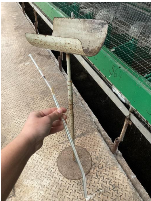
Příloha. 14. Fixační žlab s inseminační pipetou