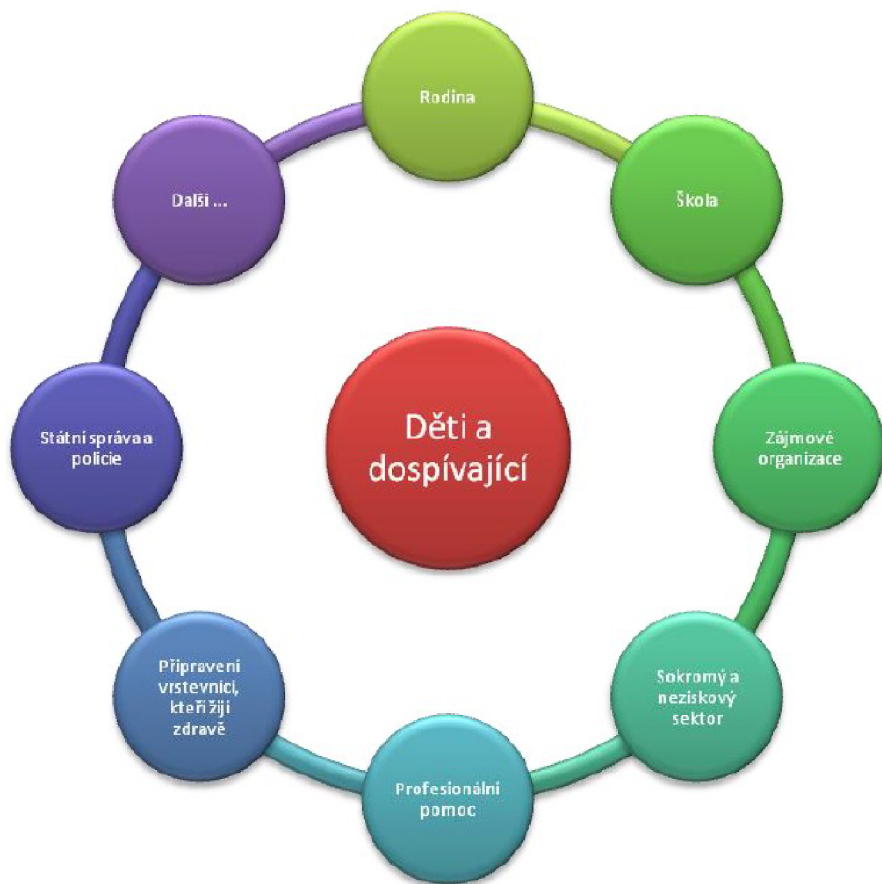
Obrázek 1 Aktéři prevence

Zdroj: NEŠPOR, K. 2011. Návykové chování a závislost: současné poznatky a perspektivy léčby . Praha: Portál. ISBN 978-80-7367-908-8.