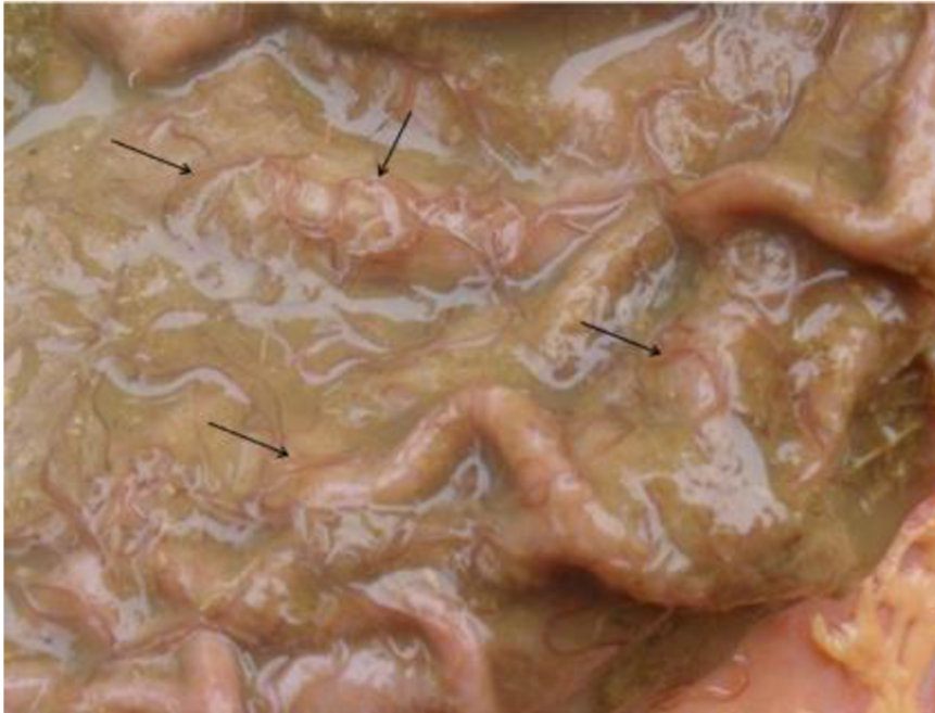
obr. 2. Slez zebra evropského s jasně viditelnými hlísticemi Ashworthius sidemi

( Cervus nippon ) a jelena sambra ( Cervus unicolor ) v Asii. Jejich výskyt v Evropě lze přičíst dovozu jelenů sika na konci 19. století a na začátku 20. století do evropských obor z Asie. Ashworthius sidemi byl zjištěn například ve Francii u jelena siky, daňka evropského, srnce obecného, jelena evropského a kamzíka horského. Obvykle infikují zebra evropského ( Bison bonasus ), kde velmi často tato hlístice parazituje a od roku 1998 byl v Polsku uznán jako nový hostitel této nepůvodní hlístice (Drozd et al. 1998).