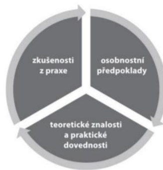
Obrázek č. 1: Odbornost sociálního pracovníka 81

Mátel uvádí, že klíč při řešení dilematických situacích se nachází v osobě sociálního pracovníka, v jeho zkušenostech, vědomostech, osobním nastavení a navrhuje, aby začínající sociální pracovníci využili „know-how“ od zkušenějších, protože pravděpodobně již mnoho dilematických situací prožili a s velkou pravděpodobností se s nimi dokážou popasovat profesionálně, s klidem a rozvahou a zkušenější by měli umět své poznatky a zkušenosti předat začínajícím pracovníkům a ochotně vše sdělit. 79 Tuto myšlenku Mátela potvrzují i Pemová a Ptáček, kteří ve své publikaci uvádějí obrázek, na kterém je evidentní, že zkušenost tvoří až jednu třetinu odbornosti sociálního pracovníka, ke které se pojí i schopnost řešit morální dilemata. 80