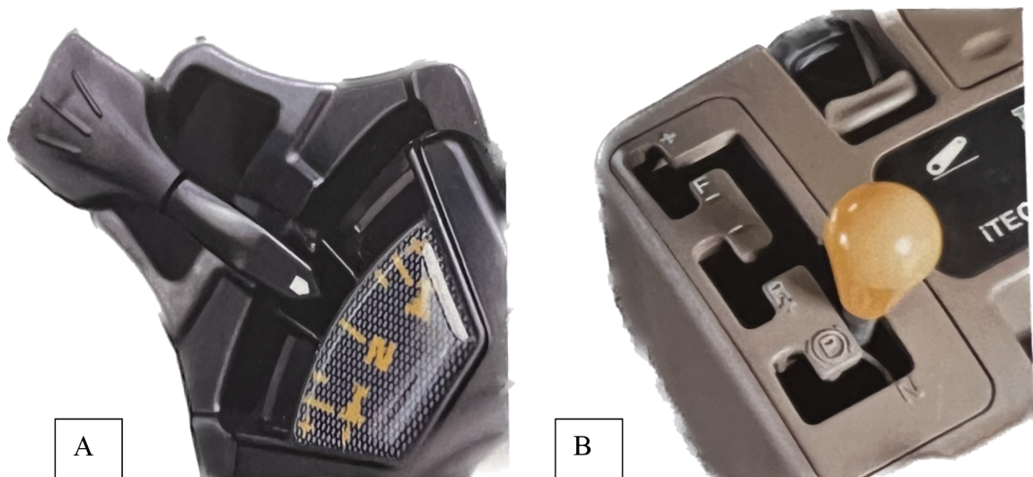
Obr. 5 A – ovladání reverzace pod volantem, B – řadící páka v loketní opěrce