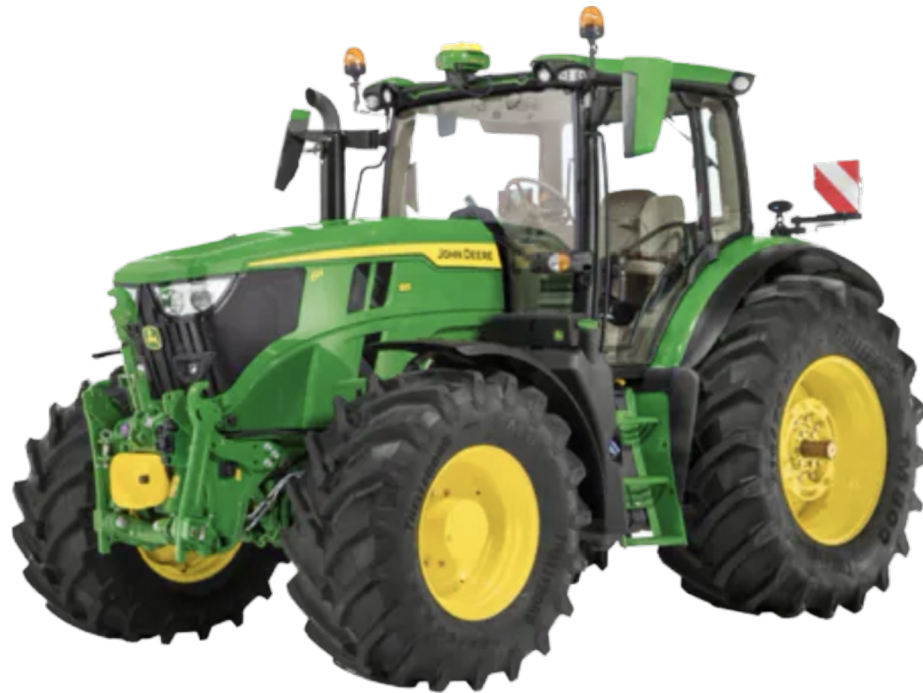
Obr. 7 Traktor John Deere 6155R