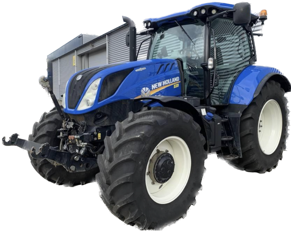
Obr. 8 Traktor New Holland T6.175