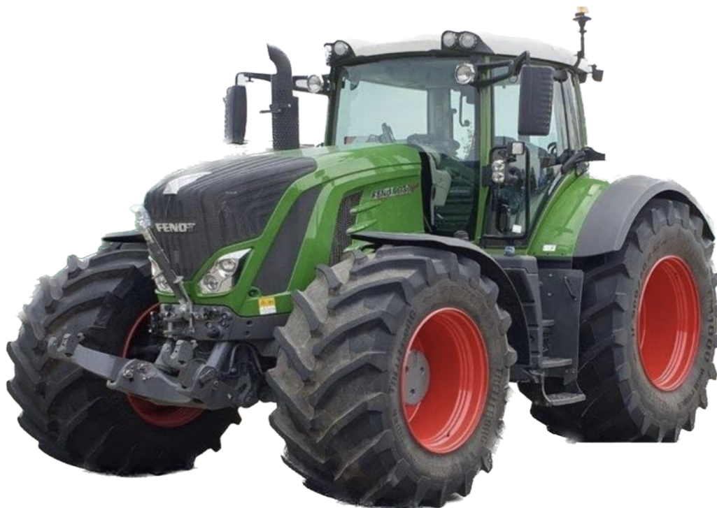
Obr. 9 Traktor Fendt 939 Vario