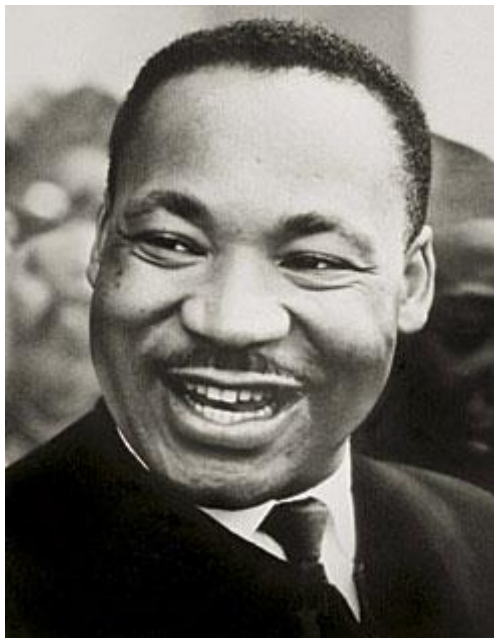
Příloha č.1: Obrázek č. 1: Dr. Martin Luther King, Jr.