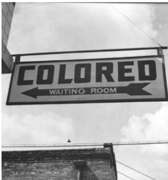
Příloha č. 3: Obrázek č. 3: Nápis na ulici značící čekárnu pro černochoy