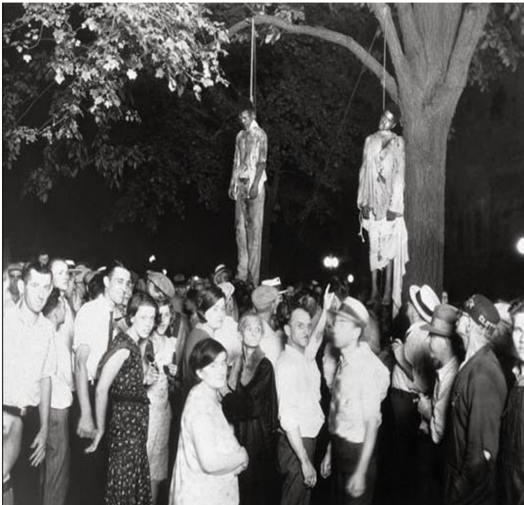
Příloha č. 4: Obrázek č. 4: Lynčování černochoů na veřejnosti