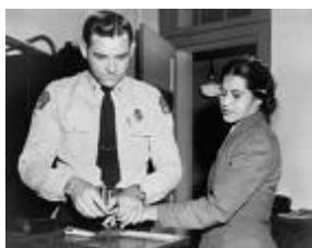
Příloha č. 2: Obrázek č. 2: Zatčení Rose Parksové