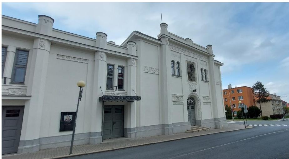
Obrázek 7: Dusíkovo divadlo v Čáslavi.