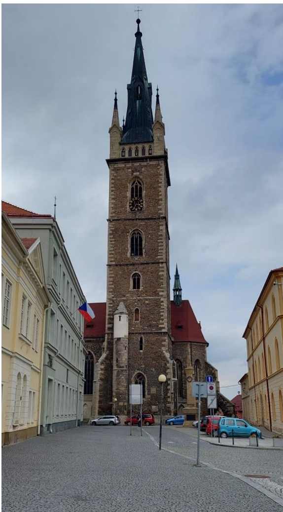
Obrázek 4: Kostel sv. Petra a Pavla.

Kostel je pro město jako takové až silně symbolicky důležitý, neboť zde se našly několikery tělesné ostatky. Spáčil a kol. (1940) uvádí, že v podvěžní kapli v roce 1910 byly objeveny ostatky Jana Žižky z Trocnova, které byly převezeny z Hradce Králové z neznámého důvodu. V kostele se také nacházel náhrobek přímo Žižky.