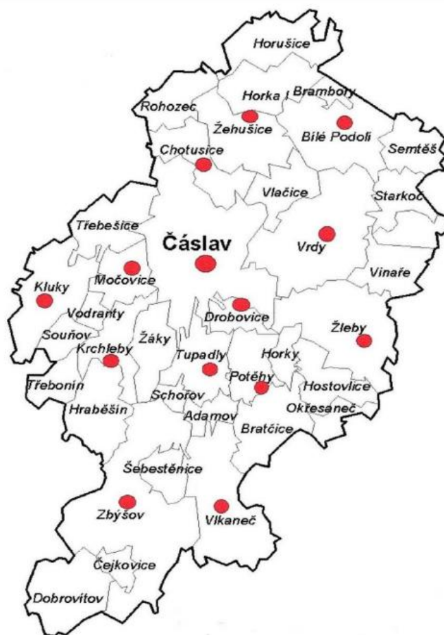
Obrázek 2: Mikroregion Čáslavsko. (Čáslavsko.cz; 2022)