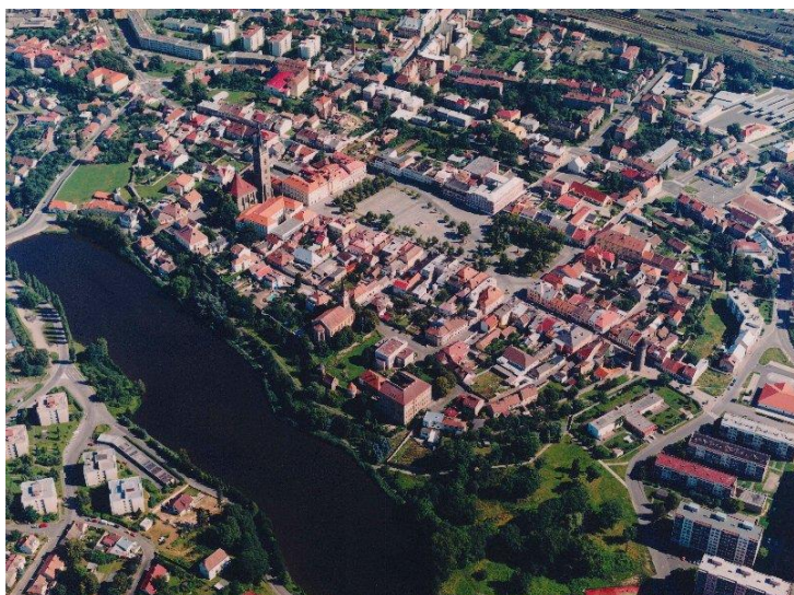
Obrázek 3: Městská památková zóna v Čáslavi.