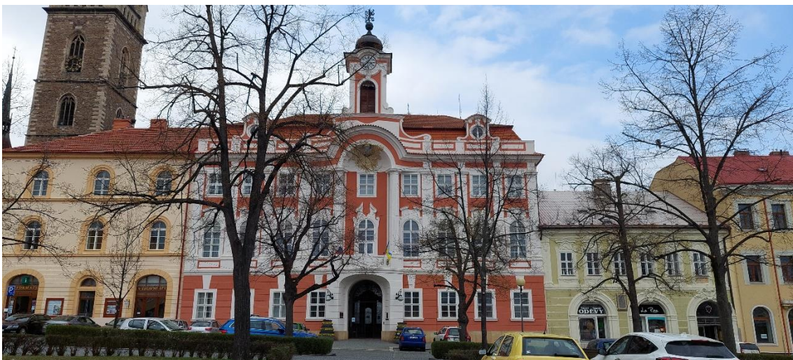
Obrázek 5: Radnice v Čáslavi.