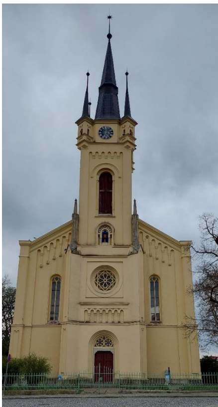
Obrázek 6: Evangelický kostel v Čáslavi.

Oba kostely jsou dnes v provozu a probíhají zde pravidelné modlitby. V kostele evangelickém v poslední době také svatby a vánoční koncerty. Kostel Evangelický se otevírá veřejnosti při událostech jako jsou Čáslavské slavnosti či výročí města.