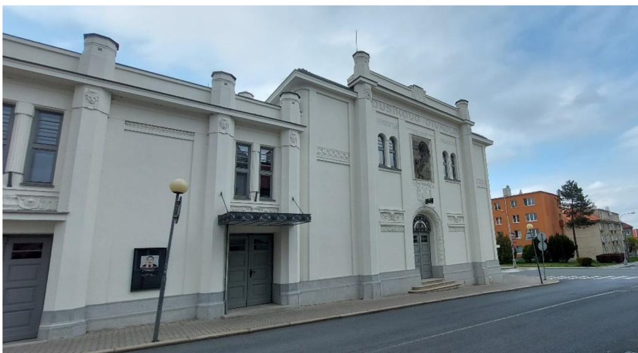
Obrázek 7: Dusíkovo divadlo v Čáslavi.