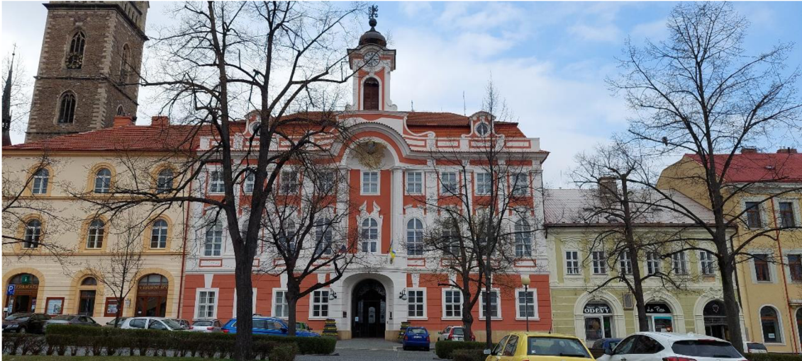
Obrázek 5: Radnice v Čáslavi.