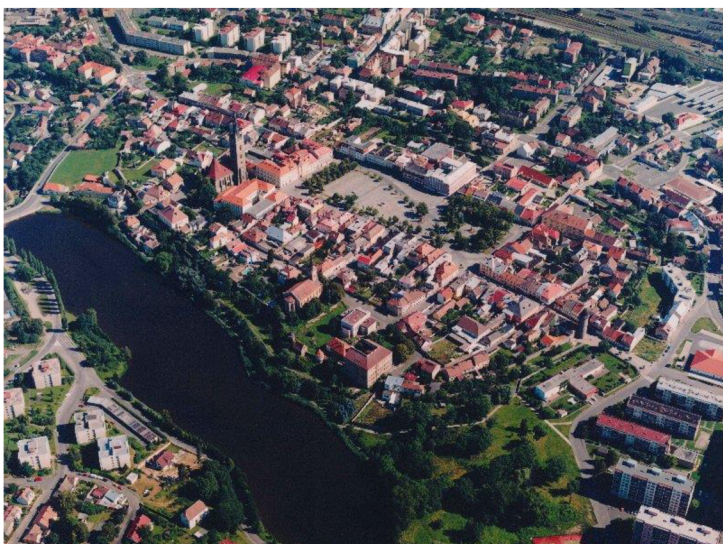
Obrázek 3: Městská památková zóna v Čáslavi.