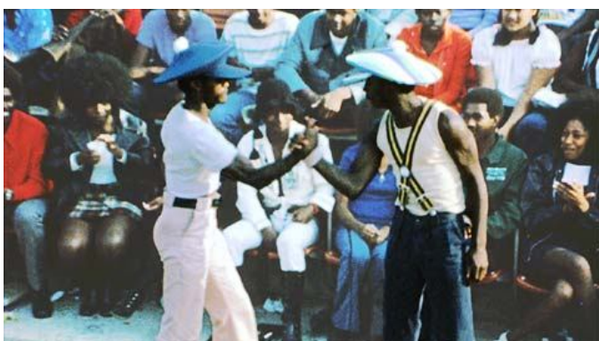
Fotka 2: Lockeri vítající se před battlem

Locking je jedinečný a nezaměnitelný druh tance, jehož zakladatelem je Don Campbell (později založil skupinu The Lockers). 16 Na samém zlomu šedesátých a sedmdesátých let 20. století, tak postupně stvořil