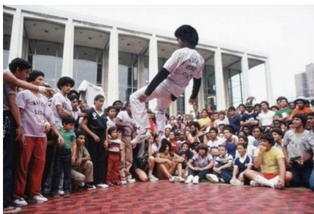
Fotka 1: B-boy

Street dance je zastřešujícím pojmem pro mnoho undergroundových tanečních stylů, jenž vznikly, jak napovídá název, přímo na ulici nebo v klubech. Jednotlivé tance se formovaly ve specifických příměstských oblastech segregovaných lokalit amerických měst a jsou tedy součástí místní lidové kultury. Segregace byla ve dvacátých a třicátých letech dvacátého století předmětem výzkumu chicagské školy, jejíž představitelé považovali rozdělení socioekonomických a kulturních skupin obyvatelstva do různých částí města za jeden z hlavních procesů, který formuluje vnitřní strukturu a charakter města. Život v segregovaných lokalitách skýtal značné nesnáze a těžkosti, mezi které patří špatná kvalita bydlení, sociální izolace, kriminalita, deviantní chování, nízká úroveň vzdělání a nezaměstnanost. Představují také bariéru životních šancí a sociálních příležitostí, jenž souvisí s vysokou finanční závislostí na sociálním systému. (Temelová, Sýkora 2005) Umělci trávili převážnou