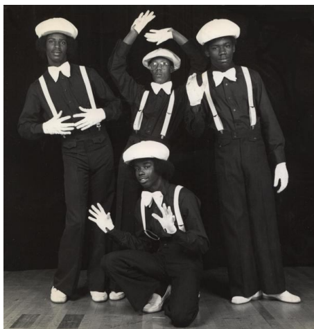
Fotka 3: Poppeři

Vedle tohoto stylu se v průběhu sedmdesátých let vytvořil ještě další taneční styl popping, který je postavený na kontrolovaných trhavých, šubavých pohybech svalů v rytmu hudby. Využívá střídání uvolnění a prudkého stažení konkrétního svalu nebo svalové skupiny. Při každém takovém šubnutí při tanci Sam vydechl „pop“, odtud popping. Popping a boogaloo jsou dva samostatné styly, které se ale velmi často